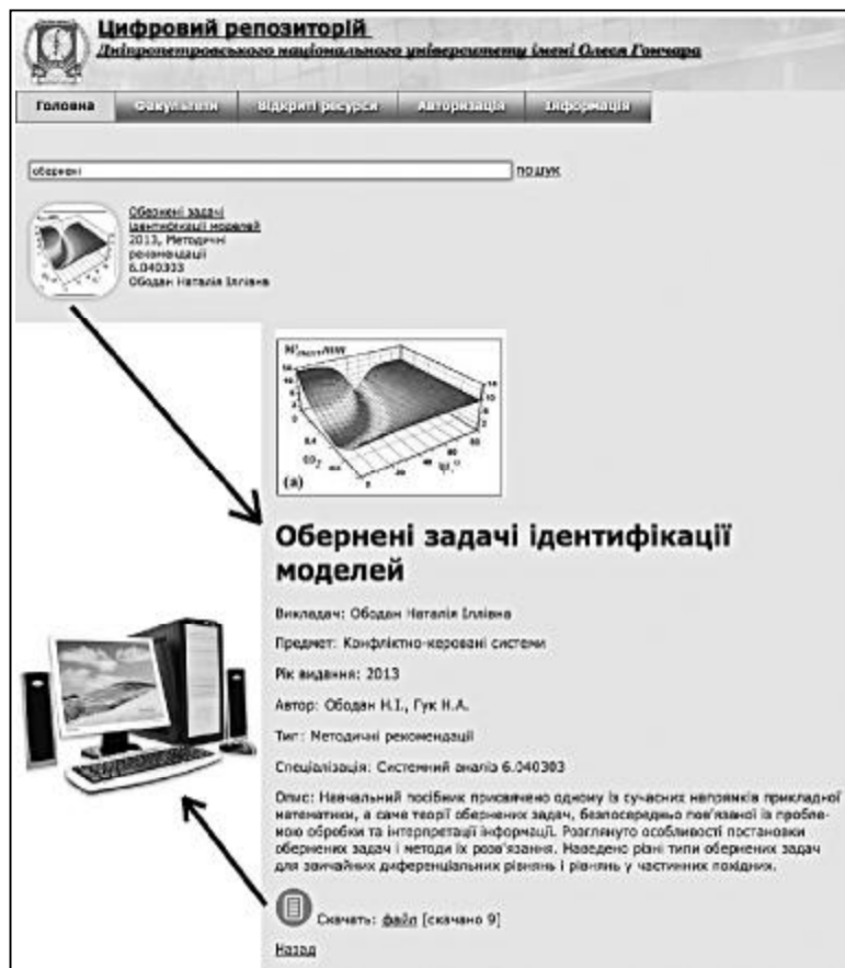
Схема організації та завантаження файлу ресурсу на комп'ютер користувача системи.

Усі характеристики ресурсу описуються з використанням спеціалізованих полів, у яких інформація доступна із довідників системи і не вимагає набору. Така форма додавання виключає можливість помилок, оскільки дані не набираються, а стають доступними користувачеві із централізова-