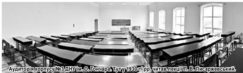
Аудиторія корпусу №3 ДНУ ім. О. Гончара. Тут у 1930-ті рр. читав лекції Л. В. Писаржевський.

Пам'ятник намогилі Л. В. Писаржевському у Дніпропетровську, у парку, що названий на його честь. Скульптура М. Г. Манізера.