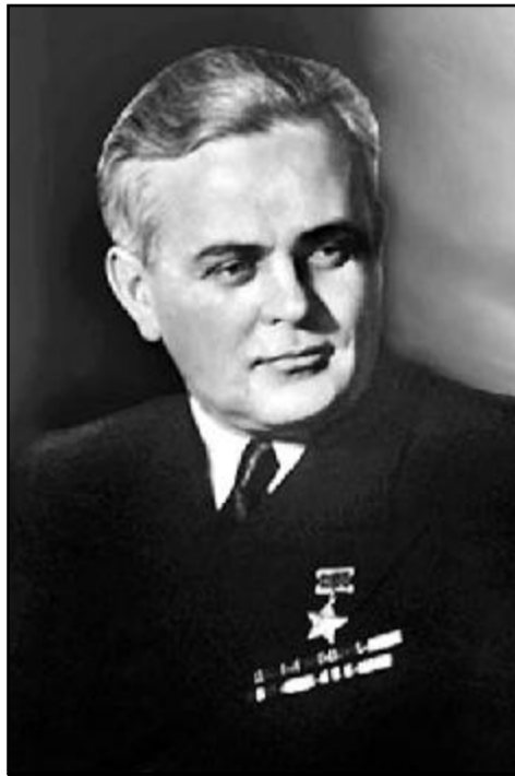
Петро Петрович Ширшов – доктор географічних наук, дійсний член Академії наук СРСР.

Працював заступником начальника Головного північного морського шляху (1939-1942), наркомом, міністром морського флоту СРСР (1942-1948), директором Арктичного інституту, засновником і директором Інституту океанології АН СРСР, головою Тихоокеанського наукового комітету (1946-1950).