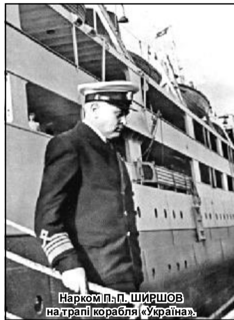
Нарком П. П. ШИРШОВ на трапі корабля «Україна».

го гідробіолога, професора-альголога Д. О. Свіренка. У кінці 20-х – на початку 30-х років ХХ ст. для кардинального вирішення проблеми Дніпрових порогів, що перешкоджали наскрізному судноплавству по Дніпру, розгорталася будівництво Дніпровської гідроелектричної станції (Дніпрогесу). Для вивчення порожистої ділянки Дніпра та відстеження в подальшому гідробіологічних та іхтіологічних змін, викликаних будівництвом Дніпрогесу, у серпні 1927 року уряд прийняв постанову про організацію Дніпропетровської державної гідробіологічної станції. Директором станції в березні 1928 р. призначили Д. О. Свіренка. Петро Петрович займався тут вивченням перифітону (організмів-оброшувачів) Дніпрових порогів та фітобентосу (рослинних організмів, що мешкають на дні водойми).