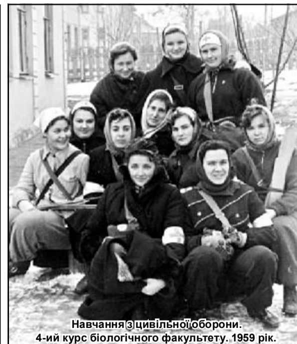
Навчання з цивільної оборони. 4-ий курс біологічного факультету. 1959 рік.