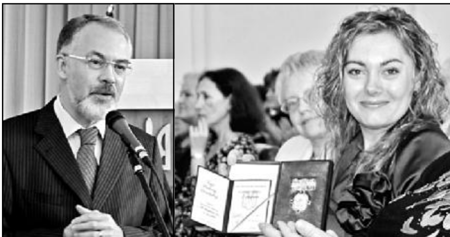
НА ЗНІМКАХ: (зліва) Міністр освіти і науки України Д. В. ТАБАЧНИК вітає к. б. н., доцента кафедри фізіології людини та тварин, заступника декана з виховної роботи факультету біології, екології та медицини, голову молодих учених ДНУ імені Олеся Гончара Т. Г. ЧАУС. Тільки-но він вручив їй орден. (Справа) Тетяна Григорівна ЧАУС з орденом Княгині Ольги III ступеня.