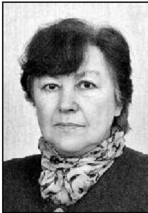
НОСЕНКО Елеонора Львівна

Завідувач кафедри педагогічної психології та англійської мови у 1989-2007 рр., завідувач кафедри загальної та педагогічної психології у 2007-2011 рр., з 2011 р. – професор цієї кафедри, член-кореспондент АПН України, доктор психологічних наук, професор.