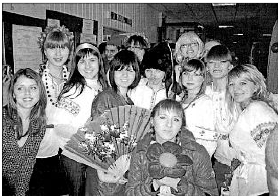
Студенти економічного факультету вмійють вигадати щось цікаве, пофантазувати, щоб було на дозвіллі і змістовно, і весело. НА ЗНІМКУ: День економічного факультету.

(Використано інформацію з сайту ДНУ ім. О. Гончара).