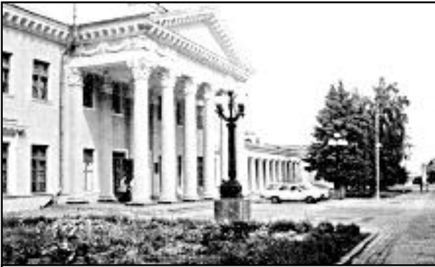
Палац культури студентів Дніпропетровського національного університету імені Олеся Гончара. Тут у 1918 році відбулося урочисте відкриття Катеринославського університету (так тоді називався наш навчальний заклад). Зараз біля Палацу відбувається поштова першокурсників у студенти.