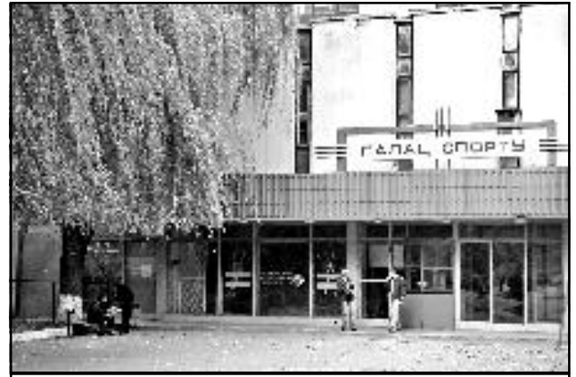
Палац спорту Дніпропетровського національного університету імені Олеся Гончара – один із найбільших серед спортивних споруд навчальних закладів України.