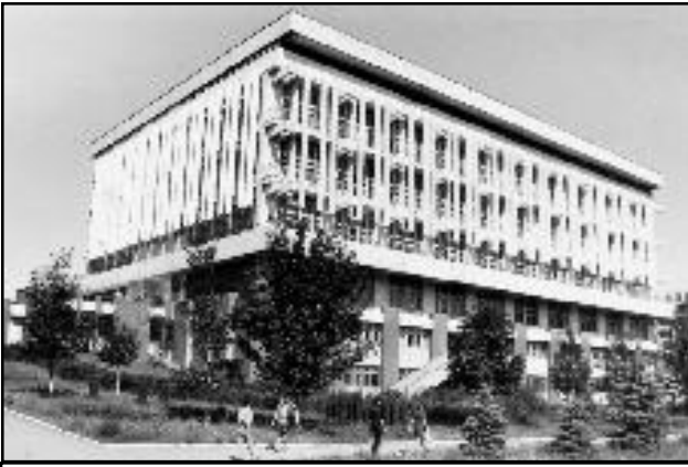
Бібліотека Дніпропетровського національного університету імені Олеся Гончара – одна з найбільших серед бібліотек вищих навчальних закладів Придніпров'я.