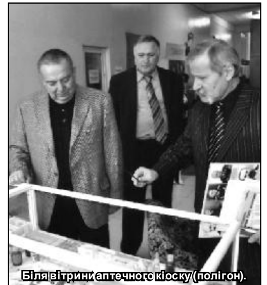
Біля вітрини аптечного кіоску (полігон).