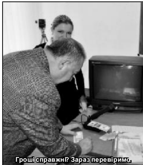
Гроші справжні? Зараз перевіримо.