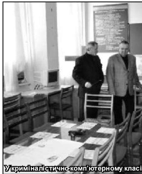
У криміналістично-комп'ютерному класі.