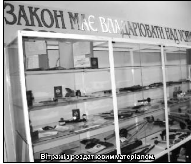
Вітражі з роздатковим матеріалом.