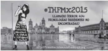
Affiche du Second TransHack-Feminist, Puebla, Mexique, 2015.

le maintien d'infrastructures féministes autonomes 5 . Pensons aux projets de serveurs féministes lancés au cours de la première convergence TransHackFeminist (THF) 6 , au projet Systerserver 7 piloté par Genderchangers 8 et au Carnaval Eclectic Tech , destinés à l'hébergement de services en ligne, ou encore Anarchaserver 9 , lancé par des habitants de Calafou 10 , dont le but est l'hébergement de données « mortes » et en transition. En 2015, un nouveau serveur féministe dénommé Vedetas 11 a vu le jour, sous l'égide du hacklab féministe Marialab, situé à São Paulo (Brésil). Enfin, des camarades basées au Mexique ont créé Kefir.red 12 , un serveur autonome qui soutient et accueille des collectifs féministes.