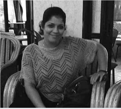
Philippe Merlant / 50/50 Magazine