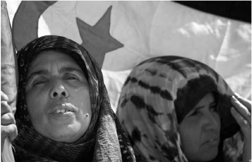
Des femmes sahraouies dressent leur drapeau durant le discours du président Mohamed Abdelaziz, Tindouf, Algérie, 2009.

Au fil de ce processus de résistance, les Sahraouies font mentir les expériences passées qui pouvaient laisser à penser que le combat féministe était incompatible avec les idéaux de libération nationale et montrent que, pris dans leur contexte, indépendance et féminisme sont des objectifs indissociables et interdépendants. Elles battent également en brèche l'idée selon laquelle ces femmes ne seraient qu'un pion instrumentalisé par la structure politique du Front Polisario, le mouvement de libération sahraoui.