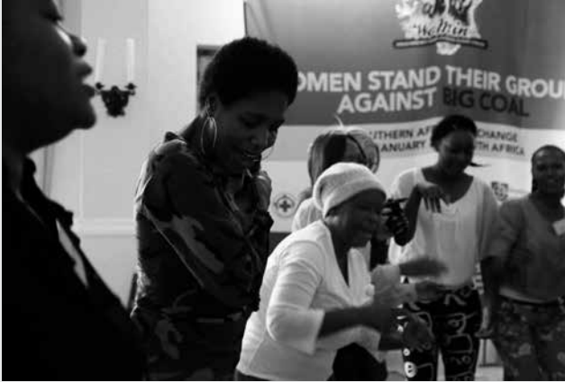
Événement de WoMin en janvier 2015 sur le thème : « Les femmes défendent leur position sur l'industrie du charbon ».

le vide laissé par les mouvements des femmes « traditionnels » aux échelons national et régional, qui ont suivi une trajectoire réformiste libérale abordant des problématiques liées aux droits des femmes comme la participation en politique, la violence à l'égard des