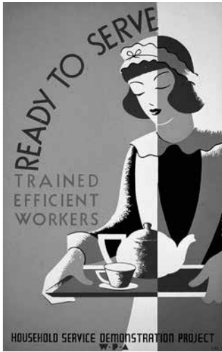
Affiche américaine de 1939 vantant le travail domestique.

dans le travail domestique et parental au sein des couples, la répartition a peu changé 3 et, comme nous le verrons, cette différence d'implication des unes et des autres dans le travail domestique a des effets significatifs sur l'activité professionnelle des femmes.