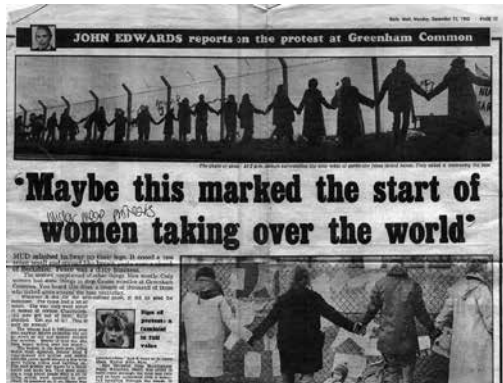
Coupage du Daily Mail issue du site d'archives de Greenham Common.