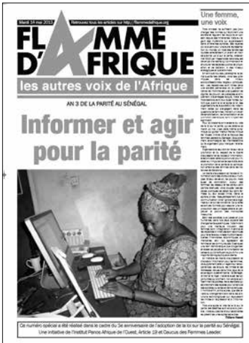
Numéro spécial de Flamme d'Afrique , à l'occasion du 3 e anniversaire de l'adoption de la loi sur la parité au Sénégal, 14 mai 2013.

Après avoir conquis le Sénégal, le colonisateur prit un ensemble de mesures politiques consacrant le recul de la femme. En stipulant qu'elle devait se soumettre à l'ordre colonial et à son mari, il lui enlevait tout droit de représentation mais aussi l'accès à la propriété. En 1904, la loi foncière sur les territoires sous occupation française ne reconnaît comme légale que la propriété privée, personnalisée et dûment enregistrée. Et s'appuyant sur le code napoléon 2 , toute propriété fut quasi-automatiquement attribuée au chef de famille qui est « naturellement » le mari. La politique coloniale ouvertement sexiste a limité l'accès des femmes à l'éducation et à la formation. En 1906, il y avait 29 écoles dispensant un enseignement aux garçons et qui comptaient 3 252 élèves, contre quatre écoles pour les filles (40 élèves). Au niveau de la formation professionnelle, l'École Normale William Ponty, pépinière des futurs cadres et chefs d'État africains, fut ouverte en 1910, et c'est seulement en 1939 que fut fondée une section féminine, soit 29 ans plus tard (MFEF, 1993 : 145).