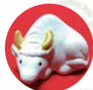
おみくじ入りの「牛みくじ」500円