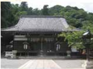
本堂に虚空蔵菩薩像を祀っている