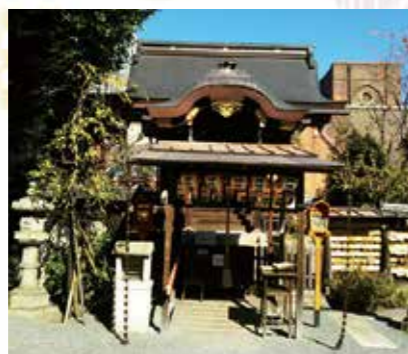
まずは社殿(本殿)に参拝を

☎075-211-4769 6時～17時(年末年始は12/31の23時～1/1の20時も参拝可能。1/2・3は6時～19時) 境内自由 無休 地下 丸太町駅下車、徒歩約5分