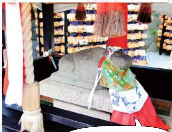
「一顧成就のお牛さん」として親しまれる

☎075-461-0005 ◎6時30分～17時 ※変更となる場合あり 🗺️参拝自由 🗺️無休 📍京都駅前から徒歩50・101分 北野天満宮前下車すぐ