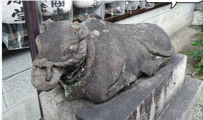
神の使い・牛の石像は入口近くにある