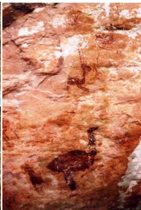
Fig. 10 et Fig. 11