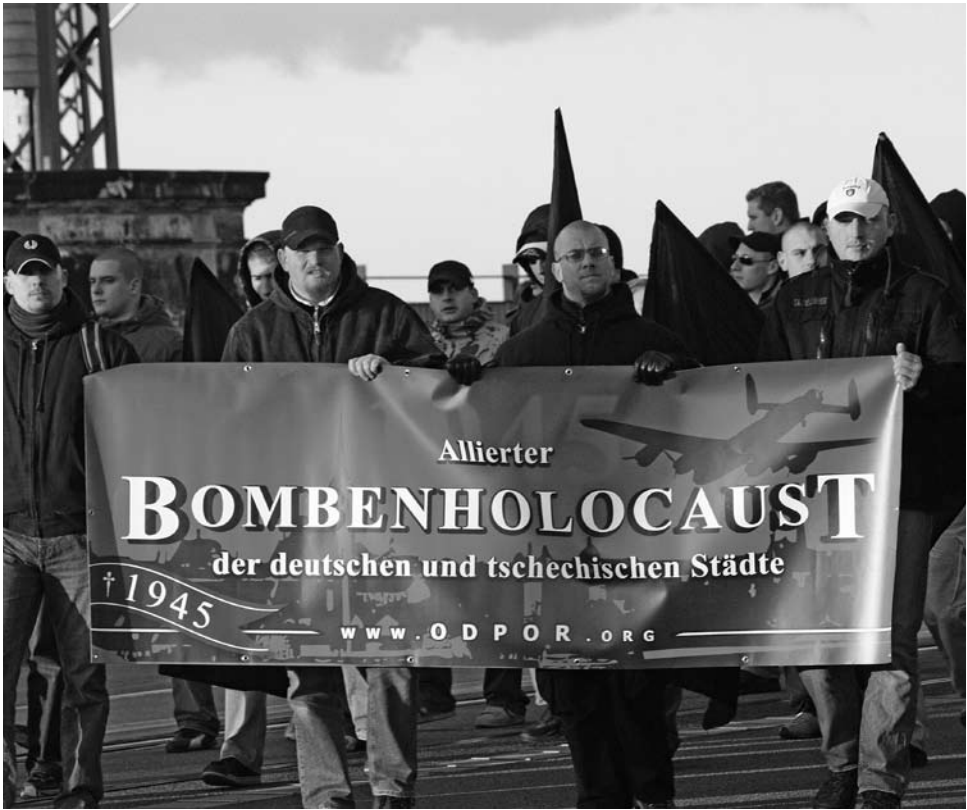
Tschechische Neonazis am 16. 2. 2008 in Dresden beim sogenannten «Trauermarsch»

Über ihre innere Wirkung hinaus geht es bei diesen Veranstaltungen jedoch auch immer wieder darum, die Geschichte zu verleugnen und zu relativieren. Der deutschen Gesellschaft soll vermittelt werden, dass der Nationalsozialismus ein System war, in dem vieles gut und richtig war. Dafür werden die Toten des Bombenangriffs auf Dresden von den Nazis benutzt, um einen Opfermythos zu kreieren. Die Alliierten werden einer «sinnlosen», «kriminellen» «Massenbombardierung» beschuldigt, die Bewohnerinnen und Bewohner Dresdens und damit zugleich die Bevölkerung Deutschlands ausnahmslos als Opfer dargestellt. Mit der Stilisierung des Bombenangriffs zum «Brand», «Flammenmeer» oder «Bombenholocaust» sollen die Verbrechen des Nationalsozialismus und insbesondere der Massenmord an den europäischen Jüdinnen und Juden relativiert werden. Der Holocaust soll damit zu einem von vielen Kriegsverbrechen werden, wie sie von allen Seiten begangen wurden.