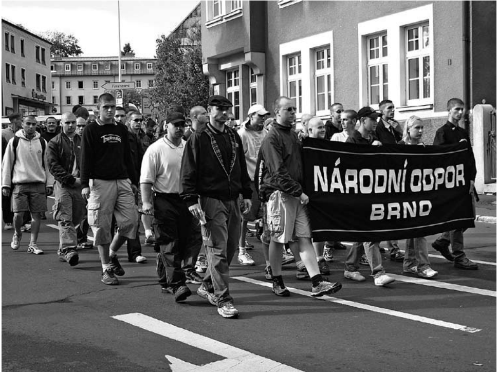
Vertreter der tschechischen Gruppierung Národní odpor aus Brno beim Heß-Marsch in 2004 in Wunsiedel