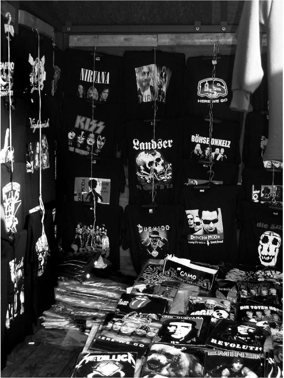
Am Markt in der Grenzstadt Hrensko sind T-Shirts der Rechtsrock-Band Landser frei zu erwerben; die Band ist in Deutschland als kriminelle Vereinigung eingestuft, und ihre Lieder sind indiziert