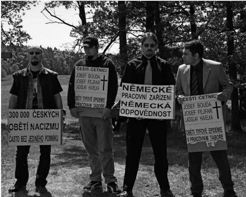
Aktivisten der Národní strana störten im Mai 2007 eine Gedenkveranstaltung in dem ehemaligen KZ für Roma in Lety bei Písek

zeitung Národní politika (Nationale Politik) an. Eine weitere Methode ist die direkte Störung von Gedenkveranstaltungen der Roma. Bei einer eigenen Veranstaltung im Januar 2006 in Lety bei Písek zog die Národní strana den Genozid an den böhmischen und mährischen Roma, die in der Zeit des Protektorats im dortigen KZ untergebracht worden waren, in Zweifel. Sie relativierten den Genozid mit der Behauptung, dass die Lager für Arbeitsscheue errichtet worden und die Roma dort dementsprechend zu Recht interniert gewesen seien. Einzige Opfer einer Typhusepidemie seien drei tschechische Wachleute gewesen.