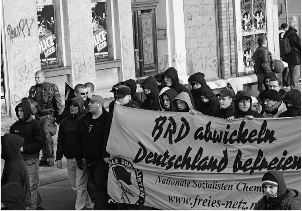
Ein Transparent der Nationalen Sozialisten Chemnitz bei einer Demonstration im Januar 2008 in Leipzig

1989 zu fremdenfeindlich motivierten Angriffen auf sogenannte Vertragsarbeiter in Bezirks- und Kleinstädten der DDR. 36 Alle Versuche seitens neonazistischer Kader, steuernd auf diese Welle rassistischer Gewalttaten zunächst gegen Unterkünfte sog. DDR-Vertragsarbeiter, später gegen Asylbewerber Einfluss zu nehmen, blieben mit Ausnahme der Ereignisse in Rostock-Lichtenhagen im Jahr 1992 marginal. Dass durch die faktische Untätigkeit der DDR-Behörden und die Abwesenheit rechtsstaatlicher exekutiver und judikativer Strukturen (deren Aufbau kann erst zu Beginn der 1990er Jahre als abgeschlossen gelten) verursachte zwischenstaatliche Vakuum begünstigte diese Gewalteskalationen.