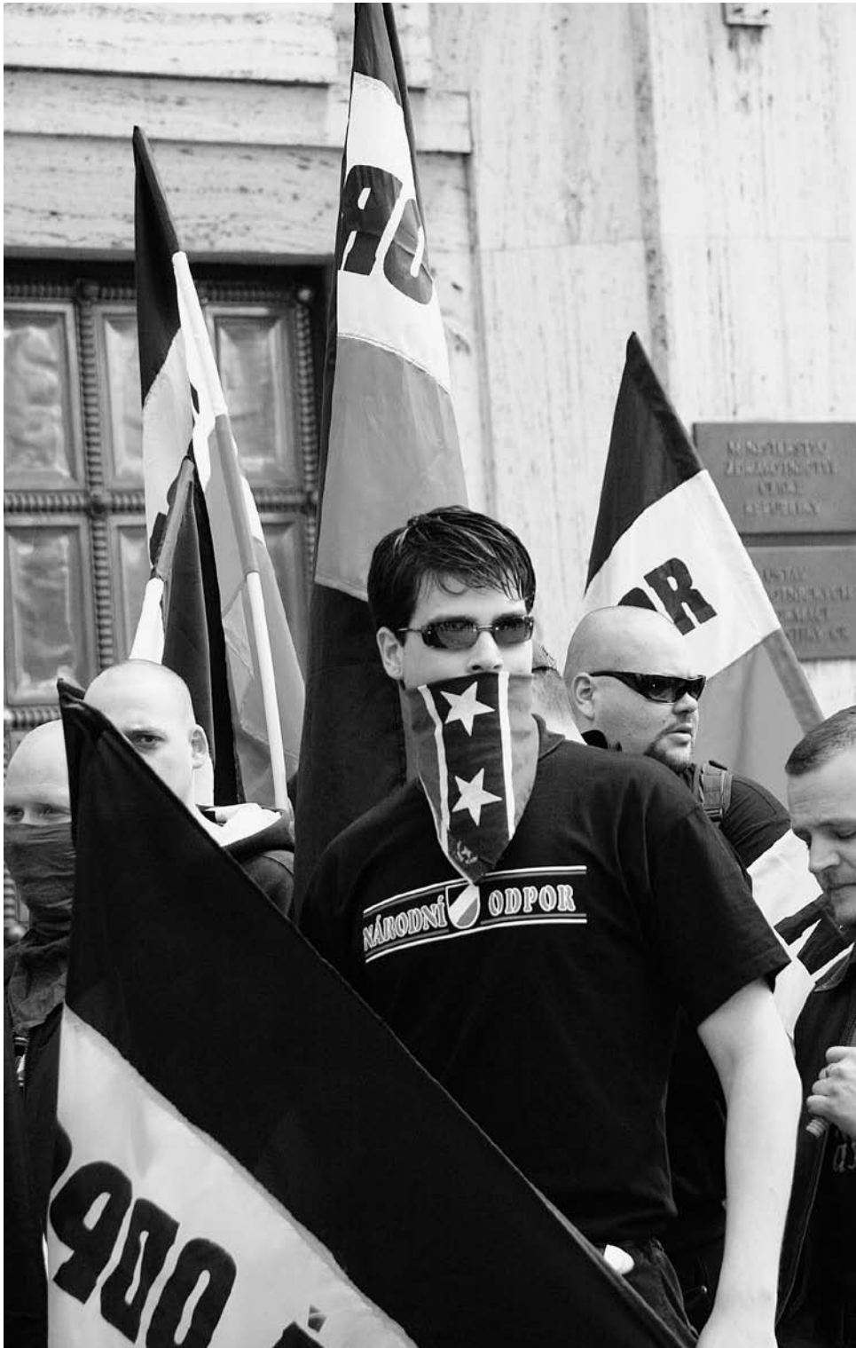
Demonstration des Národní odpor in Prag am 1. Mai 2006