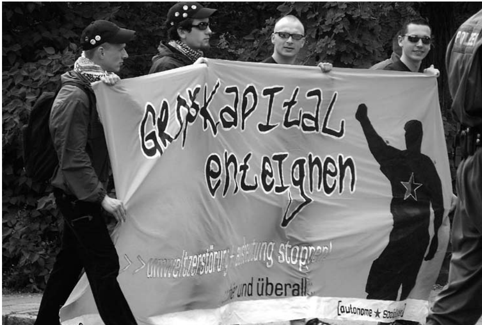
„Großkapital enteignen“ – ein Transparent der Autonomen Sozialisten beim Aufmarsch im Juli 2005 in Weisswasser

gehört.» 16 Einmal abgesehen von Selbstbereicherung 17 , Kinderpornographie 18 oder Spendenbetrug 19 in den eigenen Reihen, die deutlich machen, dass solche persönliche Vorteilsnahme nicht an Gesellschaftssysteme, sondern an Menschen gebunden ist, wird aus diesen Zitaten eines überdeutlich: Die NPD ist – trotz des demokratischen Anspruchs in ihrem Namen – eine antidemokratische Partei und trachtet danach, das bestehende politische und gesellschaftliche System durch ein anderes auszutauschen, das auf dem völkisch-rassistischen Solidarismus basiert und zentrale Menschenrechte verletzt. Der Einzelne soll sich nicht als selbstbestimmt handelndes Individuum begreifen, sondern sich der Volksgemeinschaft bzw. einer Partei, die