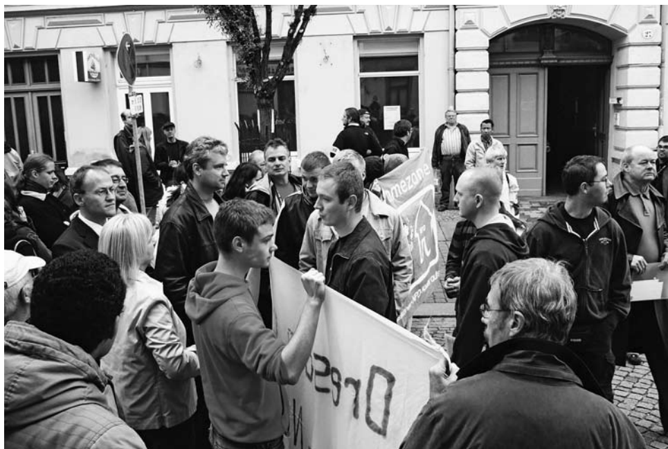
Bürgerfrühstück der Bürgerinitiative Pieschen gegen Rechts

für die Bevölkerung dürfte dagegen eher gering sein: Auch wenn in den Berichten von großer positiver Resonanz zu lesen ist, so ist von Bürgermeistern und Gemeinderäten eher Unverständnis über diese Aktionsform zu vernehmen. Während sich allerdings Rechtsextreme bei Demonstrationen eher geringer Aufmerksamkeit erfreuen können, ist ihnen bei Störungen von Veranstaltungen von Demokraten eine Aufmerksamkeit gewiss.