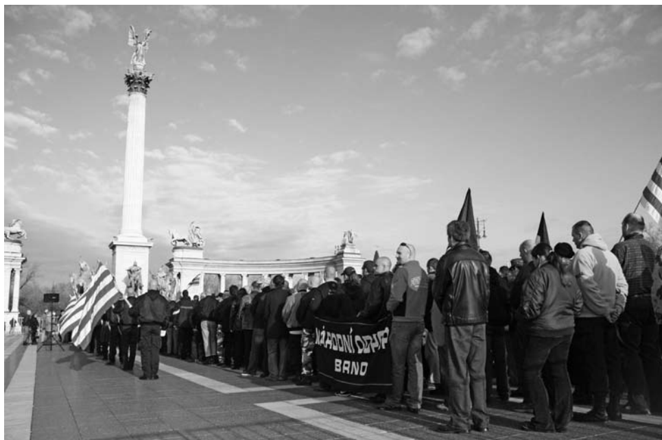
Tschechische Neonazis von Národní odpor Brno am 10. 2. 2007 beim «Tag der Ehre» in Budapest