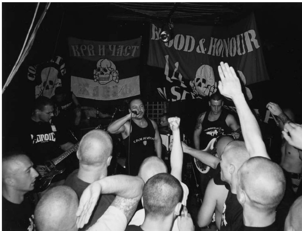
Die tschechische neonazistische Band Conflict 88 trat auf der Jubiläumsfeier des Netzwerkes Blood & Honour Division Serbia im serbischen Novi Sad auf

konzentriert er sich auf die Verbindungen zwischen tschechischer und deutscher Szene. Wie bereits in Kapitel 2 dieser Broschüre verdeutlicht, muss im Rahmen der tschechischen extrem rechten Szene zwischen Nationalisten und Neonazis unterschieden werden. Daneben finden die Konzepte des Autonomen Nationalismus und des tschechischen Neofaschismus Berücksichtigung.