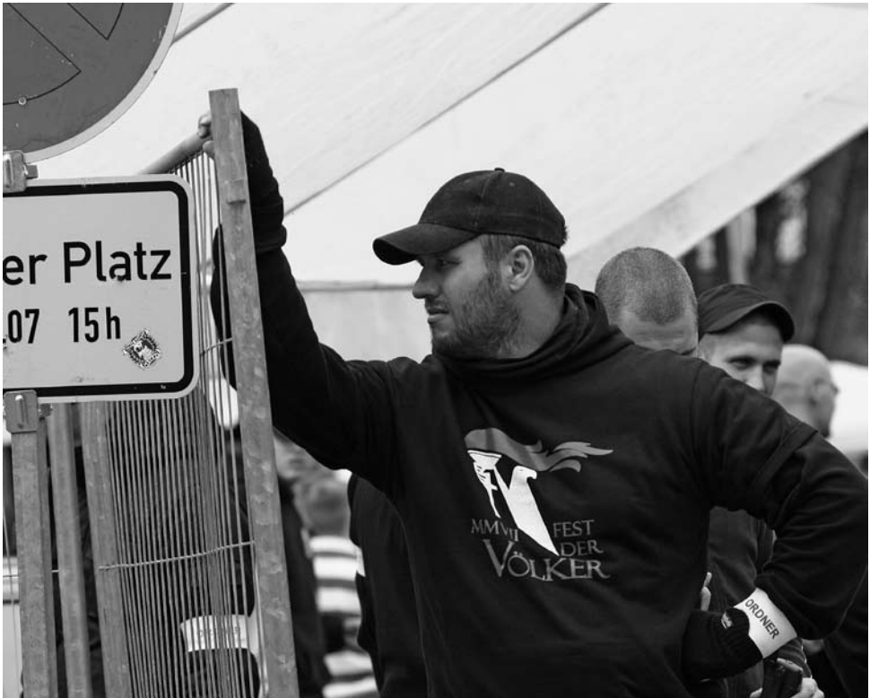
Mitglied der Selbstschutz Security beim Fest der Völker 2007 in Jena

«ewigen Cowboys», zögen Nutzen aus dem «ethnischen Suizid» Europas. Der Kontinent erlebe derzeit den entscheidenden Kampf zwischen «Ethnosuizid» und «Ethnobewusstsein», «zwischen Rassenvernichtern und Ethnokraten». 3