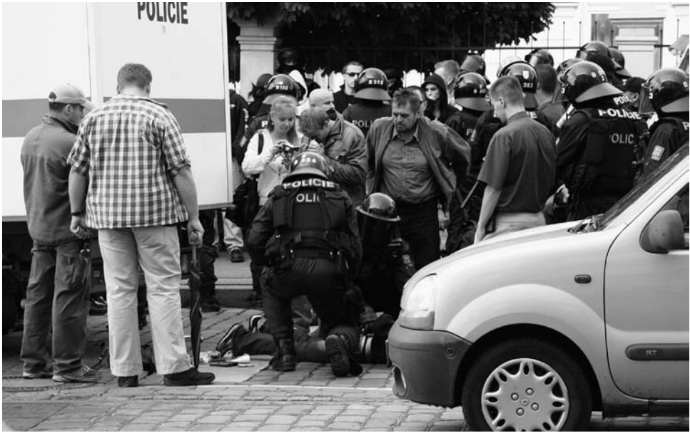
Tschechische Polizei während der Demonstration vor der israelischen Botschaft in Prag

Inzwischen gibt es eine stärkere interne Kontrolle, was zu mehr Schlagkraft bei den Polizeioperationen führte.