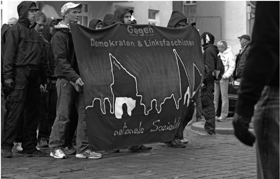
«Gegen Demokraten & Linksfaschisten – nationale Sozialisten»; ein Transparent während einer Demonstration am 12. 1. 2008 in Leipzig

Ganzen» fühlen. Gleichzeitig hatten sie den regionalen Bezug, sie kamen aus dem Ort bzw. der unmittelbaren Umgebung und setzten mit ihrer Kapitalismuskritik an ortsspezifischen Problemen an. Freie Kräfte, die mit der rechtsextremen NPD wenig zu tun haben möchten, konnten sich genauso aufgehoben und angesprochen fühlen wie junge Nachwuchskader der Partei. Die Bevölkerung nahm trotz der exponierten Route entlang der Hauptstraße wenig Notiz von dem braunen Spuk. Ganz anders die Darstellung der Rechtsextremisten selbst, die auf ihrer Homepage davon berichten, dass ihre Flugblätter dankend entgegengenommen worden seien und die Freitaler Bevölkerung die Kundgebung sogar bis zum Schluss interessiert verfolgt habe.