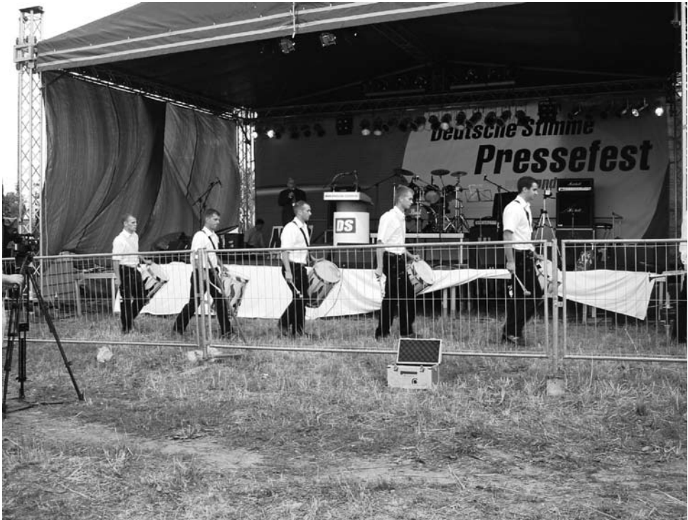
Pressefest der Deutschen Stimme am 5.8.2006 in Dresden-Pappritz

wurde das NPD-Open-Air in Gera «Rock gegen Krieg» mit etwa 500 rechtsextremen Besuchern genannt. Das Pressefest 2006 fand am 5. August in Dresden-Pappritz mit 7000 – 8000 Teilnehmern statt. Auch hier ist von Jahr zu Jahr eine größere internationale Beteiligung zu beobachten. 2007 und 2008 fand kein Pressefest statt. Stattdessen organisierte die NPD mit ihrer Jugendorganisation JN deren «Sachsentag».