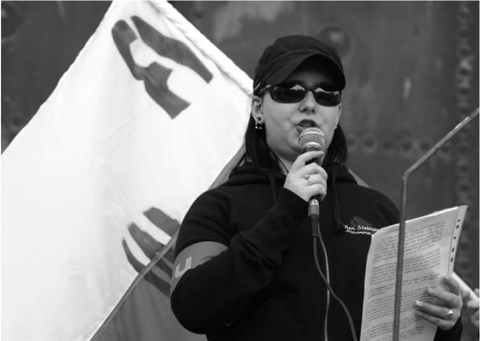
RWU-Aktivistin am 1. Mai 2008 in Brno

Organisation zwischen Nationalismus, Neonazismus und Neofaschismus. Im April 2008 teilte der NK seine Auflösung mit. Die Aktivist:innen wechselten zum NO und der AN, auf der politischen Ebene zur Partei Dělnická strana (Arbeiterpartei).