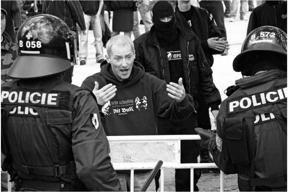
Die Demonstration am 1. Mai 2006 in Prag

listé, Národní korporativismus und die Dělnická strana oder die Vlastenecká fronta und der Národní korporativismus . Die Nationalisten meiden es grundsätzlich, mit Neonazis aufzutreten, diese hingegen können öffentliche Versammlungen der Nationalisten aber individuell unterstützen. Trotz der offiziell erklärten Unwilligkeit von Neonazis und Nationalisten zur Zusammenarbeit gibt es daneben auch bei öffentlichen Auftritten persönliche Verknüpfungen. Gleichzeitig ist ein Trend erkennbar, wonach mit steigender Intensität eigener Demonstrationen die Unterstützung der Neonazis für nationalistische Veranstaltungen sinkt.