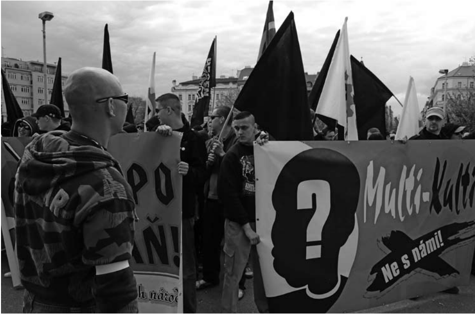
«Multi-Kulti. Nicht mit uns!»

publiziert auf der Altermedia-Webseite, die Teil eines europaweiten nationalistisch-konservativen Netzwerkes ist. Zudem gibt es Kontakte zur slowakischen nationalistischen Partei Slovenská pospolitost' .