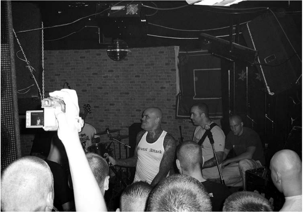
Konzert der Band Brutal Attack

ich noch meine Jacke gesucht, die ich mir eine Woche zuvor gekauft hatte. Weg war sie. Aber was erwartet man von solchen Landräubern.» Das zeigt: Gedacht wird nicht in Kategorien vom «weißen Brudervolk», sondern in den in der Bevölkerung verbreiteten rassistischen Stereotypen. Allerdings gibt es jenseits der Ideologie auch finanzielle, juristische und andere Gründe für grenzübergreifende Kontakte, bei denen etwa tschechische Nazis in die BRD reisen oder ihre deutschen Gesinnungsgenossen in die Tschechische Republik. Zudem sind es nicht nur Aktivisten, die auf dem Weg zu Treffen, Aufmärschen und Konzerten die Grenzen überschreiten. Auch Produktion und Vertrieb von CDs, Platten und Szenebekleidung sind heute grenzübergreifend organisiert.