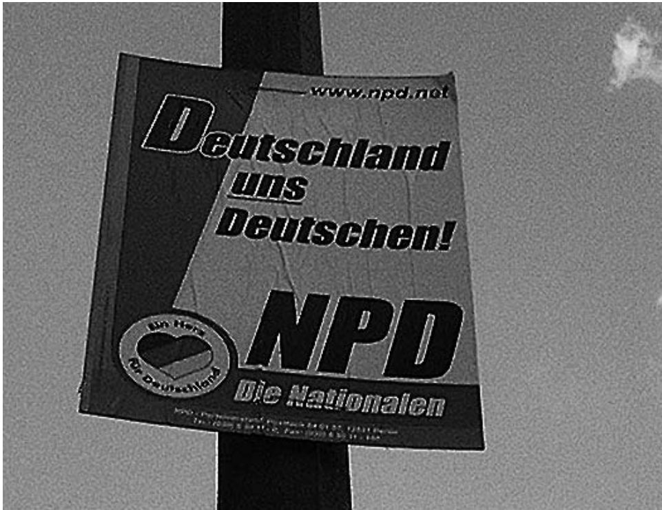
Deutschland uns Deutschen! – Wahlplakat der NPD in Pirna

Ostdeutschlands dauerhaft in Organisationen gebunden werden könne, die gegenüber dem wachsenden Verfolgungsdruck widerstandsfähiger seien. Die Führungskräfte nunmehr verbotener Organisationen wie Nationalistische Front (NF), Deutsche Alternative (DA), Nationale Offensive (NO) und einiger anderer suchten nach Organisationsmodellen, die sich gegenüber Verboten als resistent erwiesen und ein Mindestmaß an interner Handlungsfähigkeit garantierten. Hierzu wurde in der Szene das Modell informeller, regionaler Personenzusammenschlüsse diskutiert, die untereinander vernetzt agieren sollten. Neu gegenüber der Praxis neonazistischer Organisationen der 1980er Jahre war zudem, dass man nun offensiv dort um Sympathisanten warb, wo der Uniform- und NS-Ideologiefetischismus auf Skepsis stieß: im Milieu der rechtsextremen Skinheads und Hooligans Ostdeutschlands. Die damals als Zellenmodell bezeichnete Organisationsstruktur kann als Ursprung der sog. «Freien Kameradschaften» gelten, deren aktionistische Ausrichtung das heutige Erscheinungsbild des militanten Neonazismus prägen.