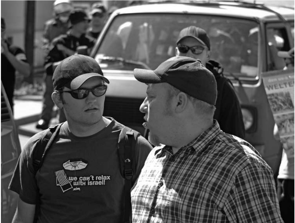
„We can't relax with Israel“. T-Shirt mit dieser Aufschrift trägt ein Teilnehmer einer rechtsextremen Demonstration im August 2006 in Berlin

Neben ihr existieren verschiedene andere rechte Jugendkulturen. Durch diesen Wandel – weg von einer Szene, hin zu einer Jugendbewegung – haben diverse Musikrichtungen und Dresscodes in die Neonazi-Bewegung Einzug gehalten. Auf eine eindeutige stilistische Abgrenzung zur restlichen Gesellschaft wird zunehmend verzichtet, und neue, dezentere Codes werden geschaffen. Unter diesen Rahmenbedingungen sind eine Reihe von Marken entstanden, die dieses neue Selbstverständnis zu bedienen versuchen. Gemein ist diesen Marken, dass sie nicht als eindeutig neonazistisch zu erkennen sind und meist nur auf eine bestimmte Jugendkultur abzielen.