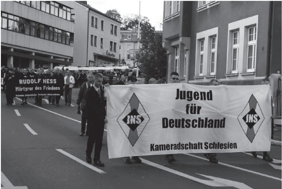
Kameradschaft Schlesien beim Heß-Aufmarsch 2004 in Wunsiedel

zur Bundesrepublik am 3. Oktober 1990 gewissermaßen über Nacht mit dem neuen Gesellschaftssystem konfrontiert. Die Erprobung des demokratischen Systems verlief in Ost- und Westdeutschland auf verschiedenen Zeitskalen. Vor diesem Hintergrund ist auch die unterschiedliche Haltung zur Demokratie als Wert und zum Umgang mit demokratischer Kultur zu betrachten.