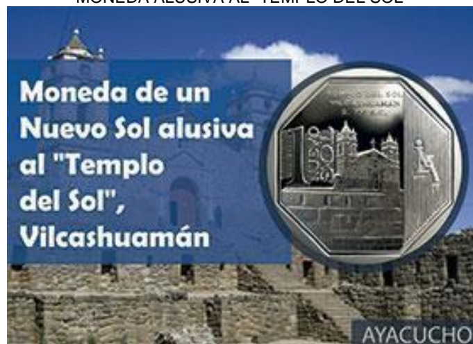
MONEDA ALUSIVA AL "TEMPLO DEL SOL"

El templo tiene un recinto principal que está debajo de la Iglesia San Juan Bautista. Cuenta con una serie de terrazas similares a las que tiene el Coricancha del Cusco, que eran usadas para albergar los jardines ceremoniales, donde destacaban también hornacinas altas, canales y fuentes de agua. Está frente a la plaza principal, donde además se instaló un ushno o pirámide sagrada y una serie de palacios.