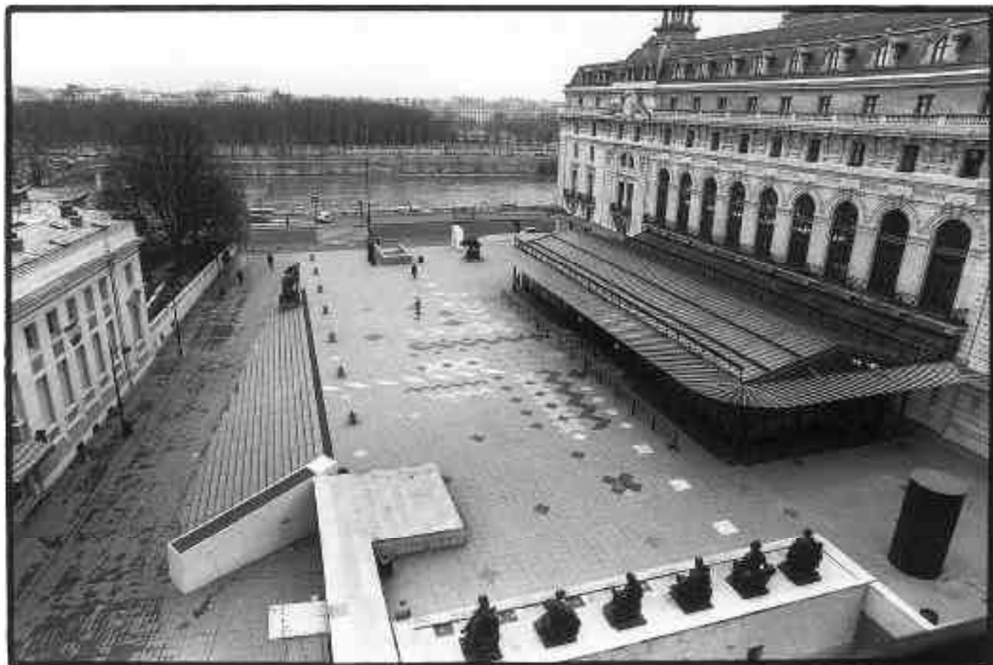
Guy de Rougemont, Parvis Bellechasse, 1986. Musée d'Orsay, inscriptions de signes en marbre.