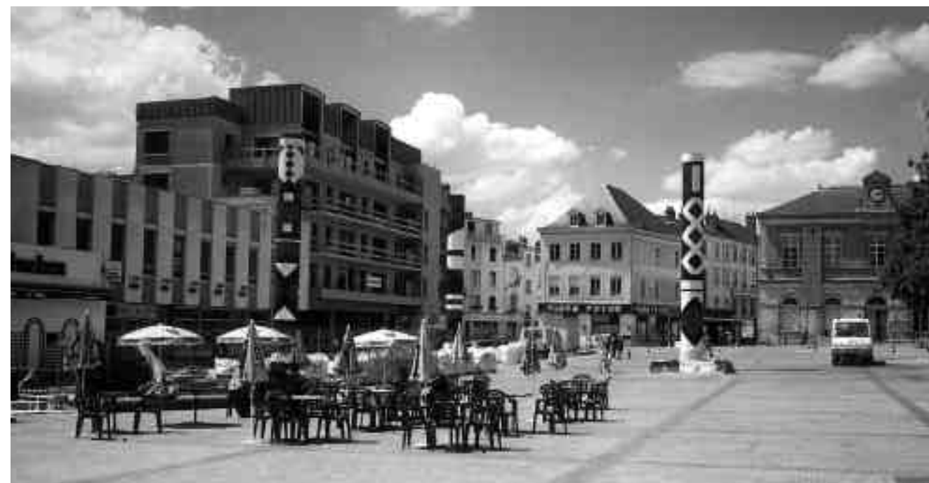
Guy de Rougemont, Les Piliers de la République, 1999, Châteauroux, trois cylindres polychromes.

La mise en situation monumentale dans la ville d'un choix esthétique impose une exigence principale : la justesse - comme le disait Pierre Reverdy : "Il n'y a pas d'autre vérité en art, pas plus d'ailleurs qu'en tout autre chose, que la justesse".