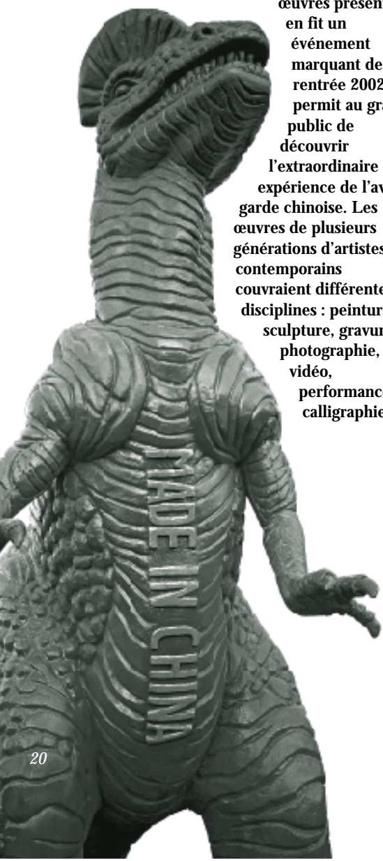
A gauche : Sui Jianguo, Dinausorus, 1999, fibre de verre.

L'Académie des beaux-arts vient de décerner ses Prix de Dessin Pierre David-Weill 2002.