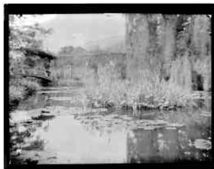
En haut : vue de la partie ouest du jardin.