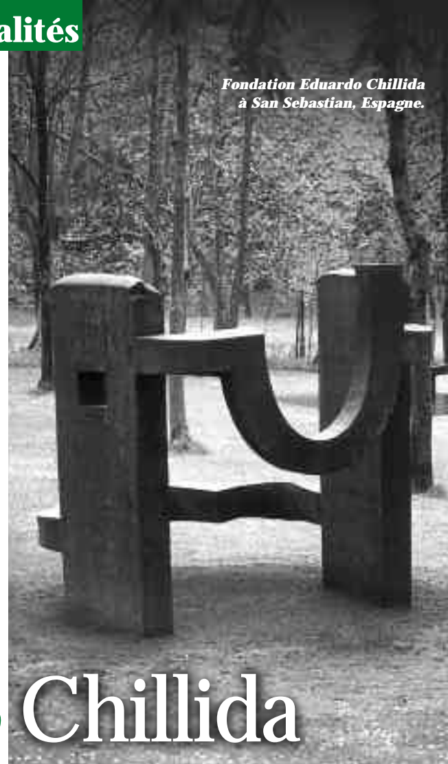
Fondation Eduardo Chillida à San Sebastian, Espagne.

La sculpture de Chillida s’impose par la force et la sévérité de ses formes abstraites simples, plans et lignes, qui peuvent prendre une tournure d’art minimal, mais ne sont jamais géométriques ni systématiques. Elles viennent de la main, ont été construites physiquement, donnent la mesure de l’homme, et autorisent toutes sortes de projections mentales. Cet archaïsme délibéré n’a pas toujours été admis dans les milieux d’avant-garde, convertis à un art prétendument sans histoire et sans mémoire dans les années 1960 et 1970. La reconnaissance pleine et entière de son travail, de sa poétique de l’espace et de la matière viendra plus tard.