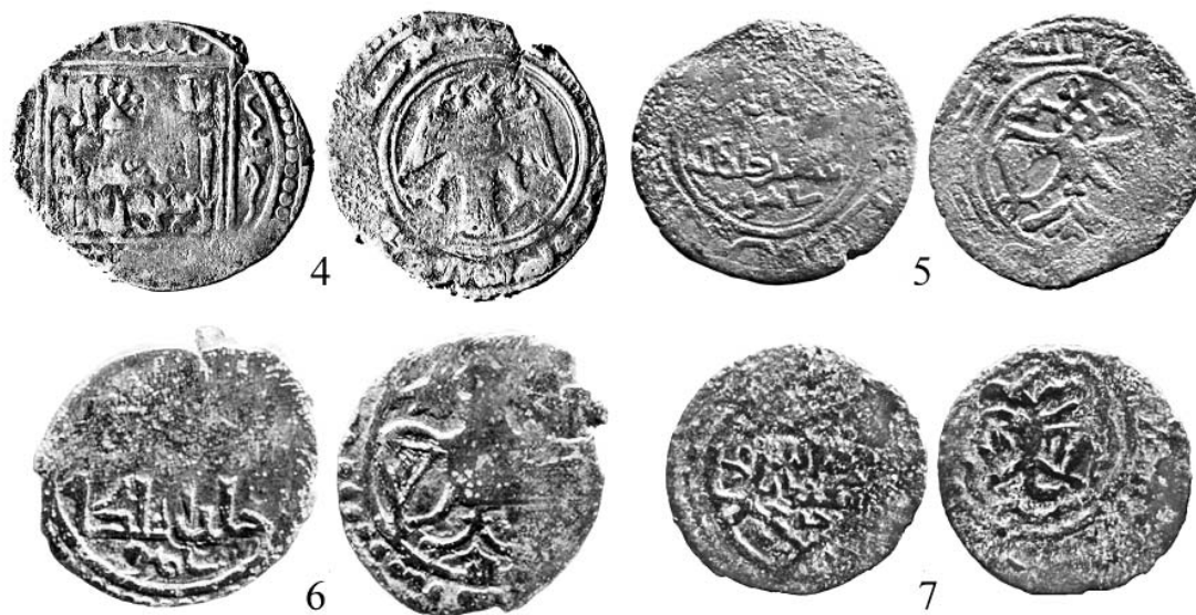
Рис. 2. Фалсы (5–7) и дирхам (4) Ильханов