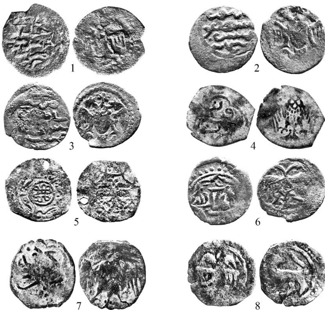
Рис. 3. Мангыры турецких бейликов

К статье Гончаров Е.Ю. «Двуглавый орел на монетах Золотой Орды и Малой Азии. Вторая половина XIII – XIV вв.»