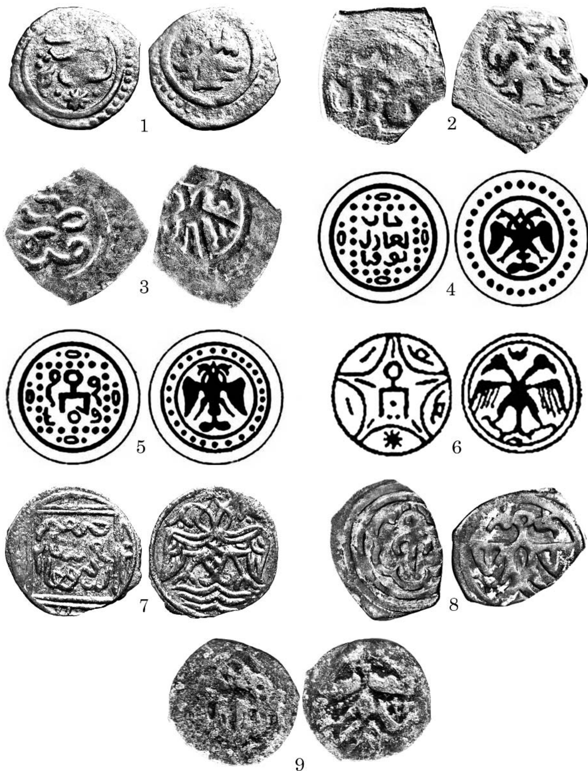
Рис. 1. Джучидские монеты с изображением Двуглавого орла

К статье Гончаров Е.Ю. «Двуглавый орел на монетах Золотой Орды и Малой Азии. Вторая половина XIII – XIV вв.»