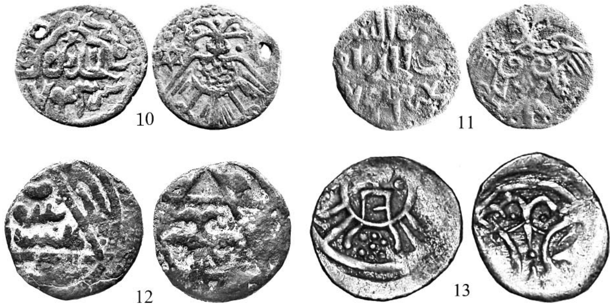
Рис. 1. Джучидские монеты с изображением Двуглавого орла (продолжение)