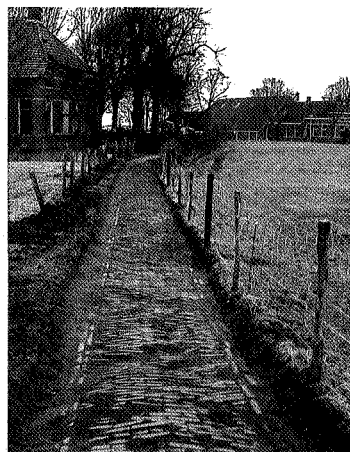
Hetzelfde pad, weer geheel zichtbaar; een van de schakels in de radiaire structuur