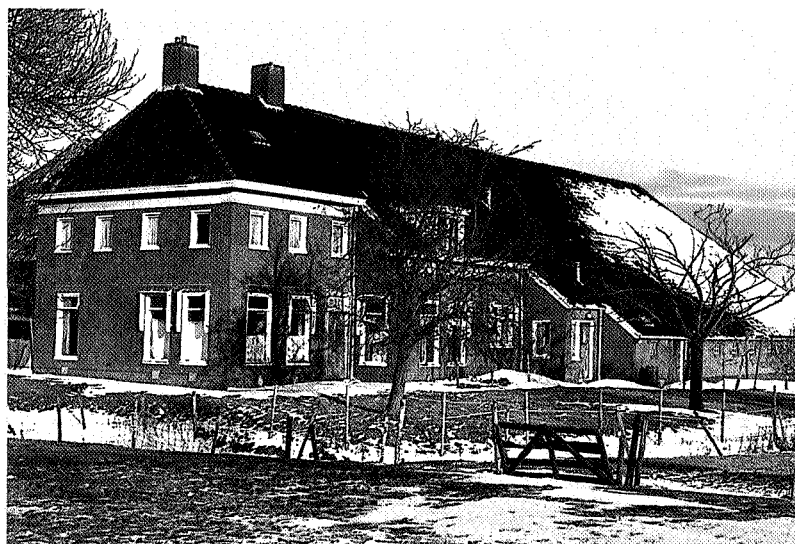
Weiwerd 1992, foto Aerophoto Eelde

Niet-bewoonde boerderij in Weiwerd, foto Derk Huizinga