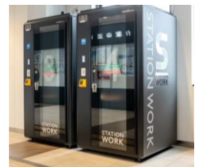
STATION BOOTH イメージ

一般のお客さまが、STATION BOOTH をご利用になる際は、空きがある場合に限り、交通系 IC カードのみでご利用いただけます。