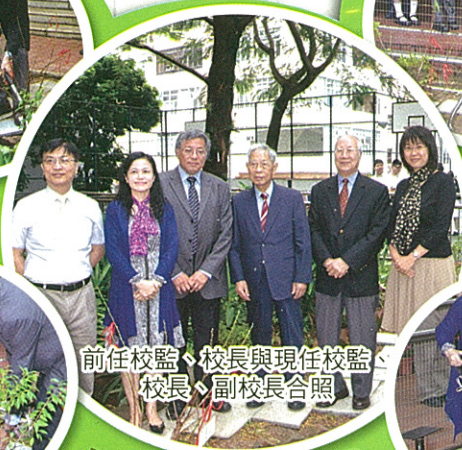
前任校監、校長與現任校監、校長、副校長合照