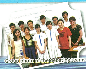
Group photo of the debating teams