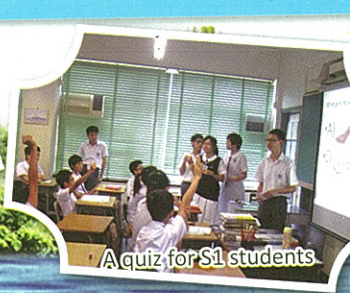
A quiz for S1 students