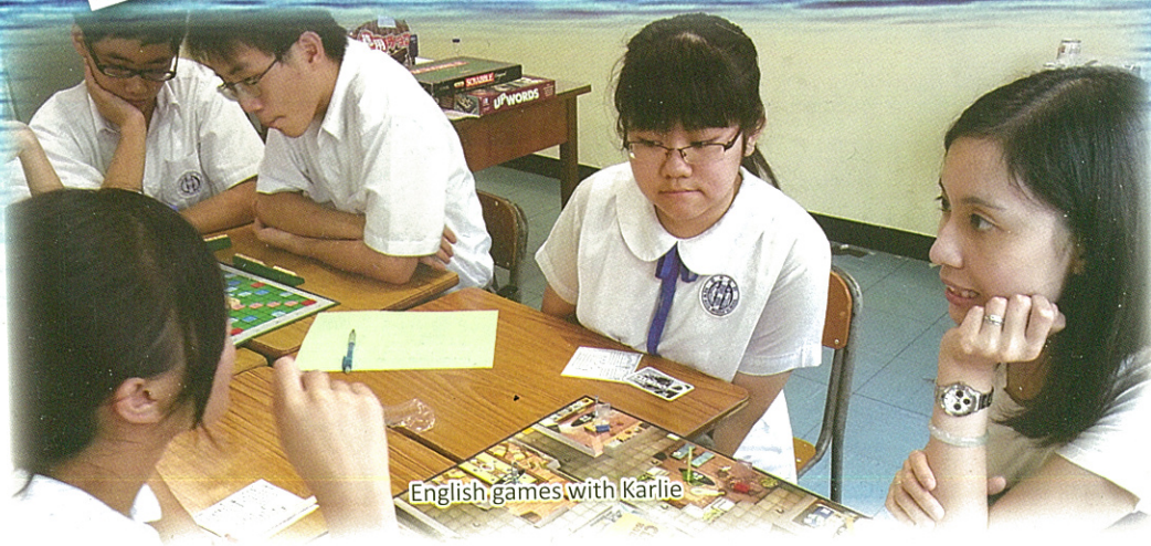
English games with Karlie