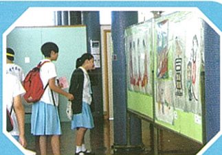
學生學習成果展覽