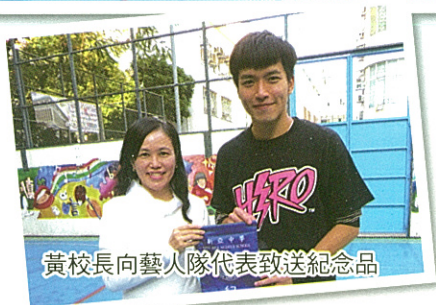
黃校長向藝人隊代表致送紀念品