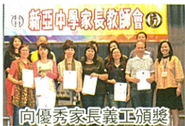
向優秀家長義工頒獎