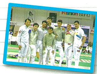
參加第十二屆泰國海軍劍擊公開賽