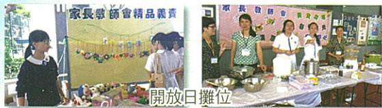
家長教師會精品義賣

第十六屆家長教師會於 10 月 27 日舉行會員大會及就職典禮，新一屆委員於台上宣誓，將繼續發揮家校合作精神。同日舉行敬師宴，老師、家長、學生聚首一堂，分享交流，場面熱鬧。