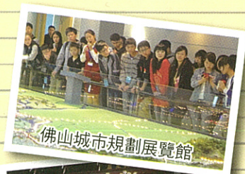
佛山城市規劃展覽館