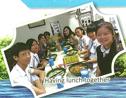
Having lunch together

Our students have gained a lot from the programme, from improved English proficiency to greater cultural awareness. Above all, they have had great fun with the university students in a memorable summer!