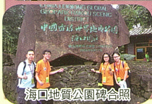
海口地質公園碑合照