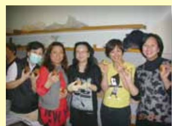
家長展示製作成品