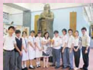
勇奪評判推介獎後合照