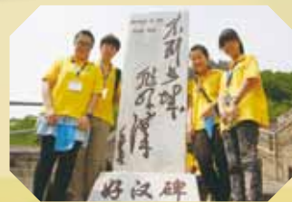
在長城「好漢碑」前合照