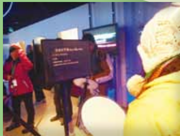
參觀光與聲科學館