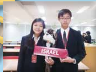
代表以色列參與國際原子能總署會議