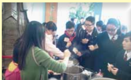
中國文化日美食廣場

今年家長教師會舉辦了不少活動, 例如親子大旅行、鉤織班、中菜、甜品烹飪班等, 目的是透過多元化的活動, 讓家長們可以善用餘閒, 發揮專長, 促進親子關係, 以達到家校合作的精神。