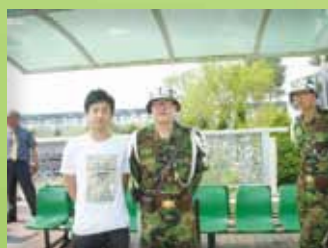
與駐守三八線的軍人合照