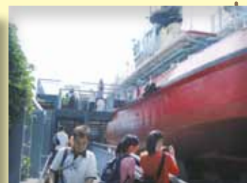
葛亮洪號滅火輪展覽館