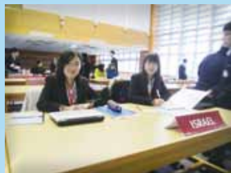
模擬以色列代表參與聯合國大會