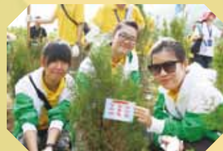
在八達嶺種植樹苗