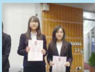
獲大會頒發良好表現獎