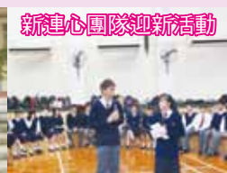
新連心團隊迎新活動