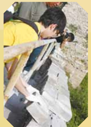
參與修復長城活動