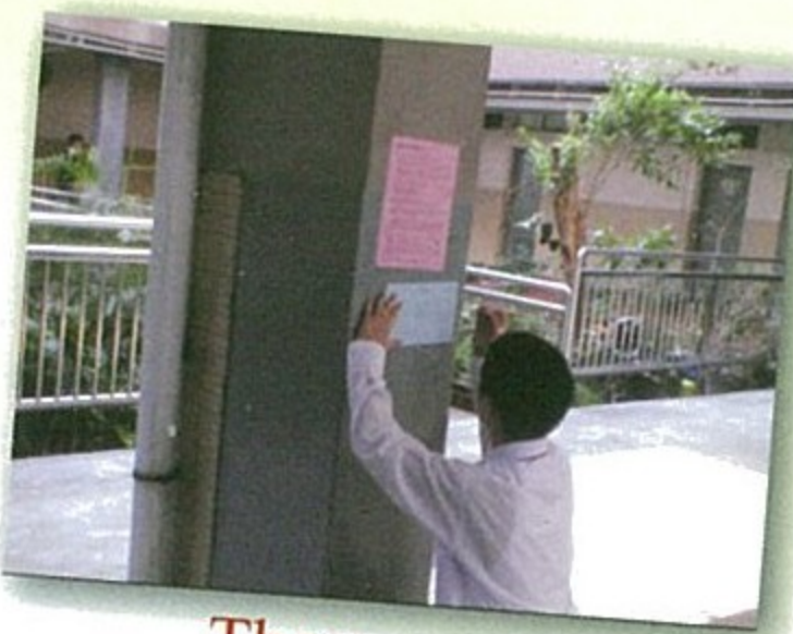
There are no shortcuts to life's greatest achievements