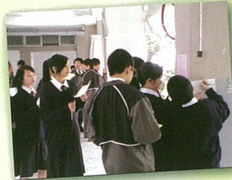
Everyone has the potential to give something back