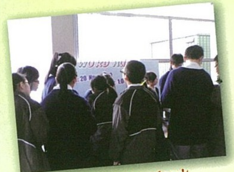
Obstacles don't have to stop you