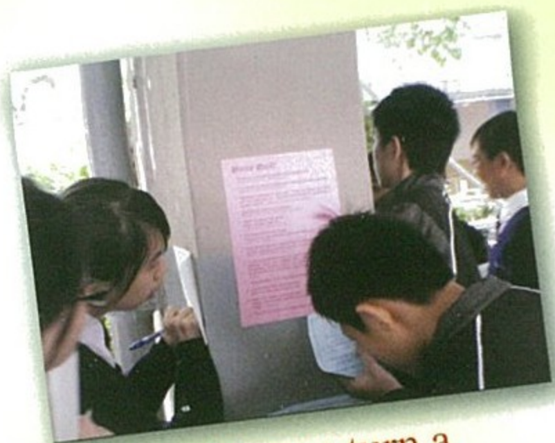
Always turn a negative situation into a positive one

* Word Hunt, held twice a year after lunch, is an English activity in which our junior form students look for words to complete famous quotes of famous people. Prizes are candies and fun.