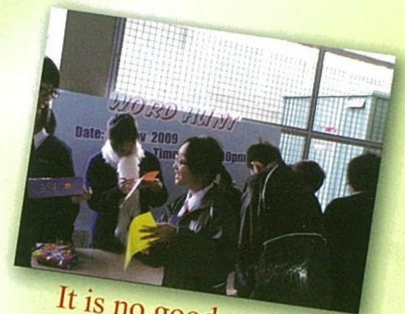
It is no good getting furious if you get stuck