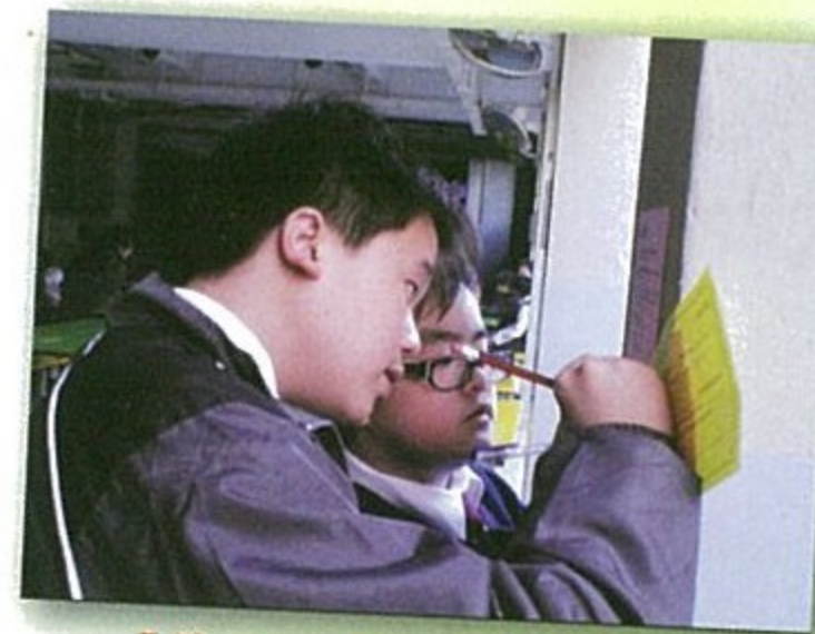
Victory belongs to the most persevering