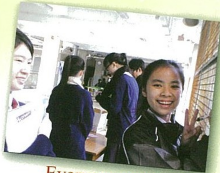
Everyone needs to be valued