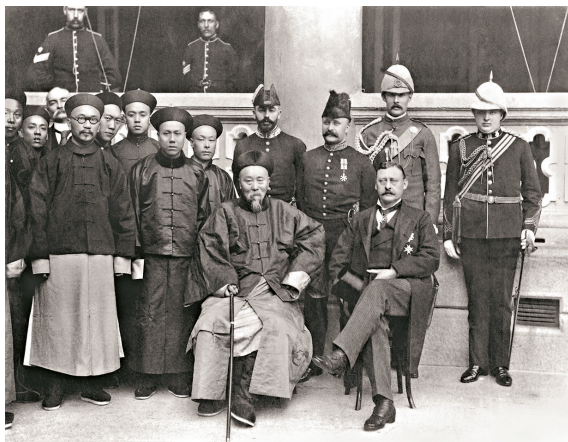
一九〇〇年一月十五日，新任兩廣總督李鴻章（前排左一）在其幕僚唐紹儀（二排左一）及醫官麥信堅（二排左二）的陪同下，與香港總督卜力（前排右一）及港府要員會面，包括輔政司駱克（二排右三）、為卜力擔任翻譯的皮士葡（二排右四）、桑德斯上尉（二排右二）和蘇德爾少尉（二排右一）。