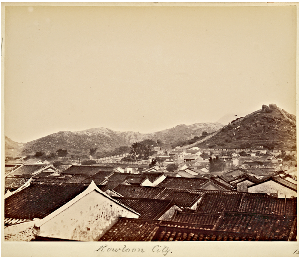
十九世紀末的九龍寨城。