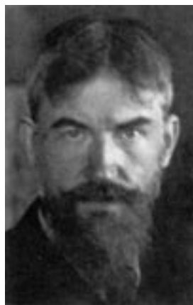
George Bernard Shaw

Hagamos un breve aparte sobre las vinculaciones entre literatura y filosofía o, si se prefiere,