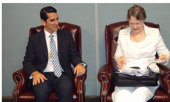
Reunión del Ministro de Relaciones Exteriores Rómulo Roux y la Directora Ejecutiva del Programa de Desarrollo de las Naciones Unidas, Helen Clark en la ciudad de Nueva York.