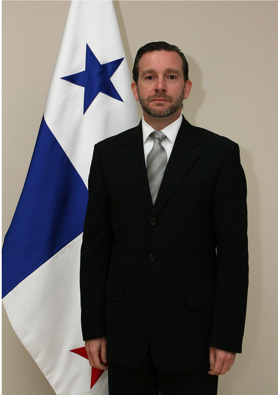
Su Excelencia Francisco Álvarez De Soto Viceministro de Relaciones Exteriores