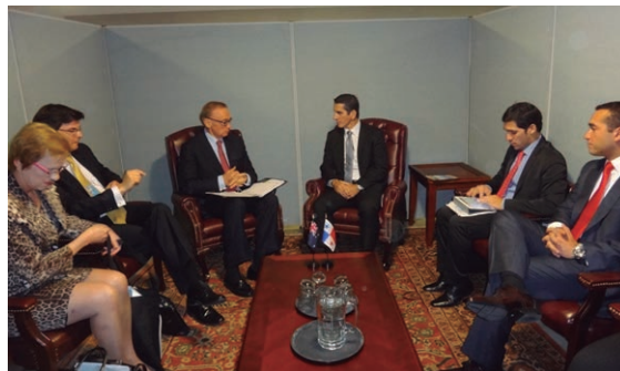
Panamá y Australia fortalecen las relaciones políticas y comerciales.