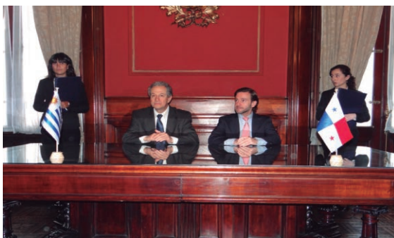
III Reunión de Consultas Políticas Uruguay- Panamá.