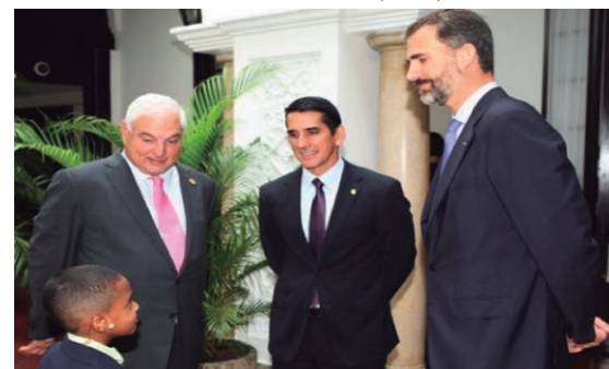
Visita al Palacio de las Garzas de Su Alteza Real El Príncipe Felipe de Asturias, durante la cual se trataron temas de interés bilateral.