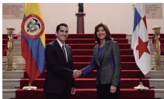
Encuentro de Cancilleres de Panamá y Colombia.