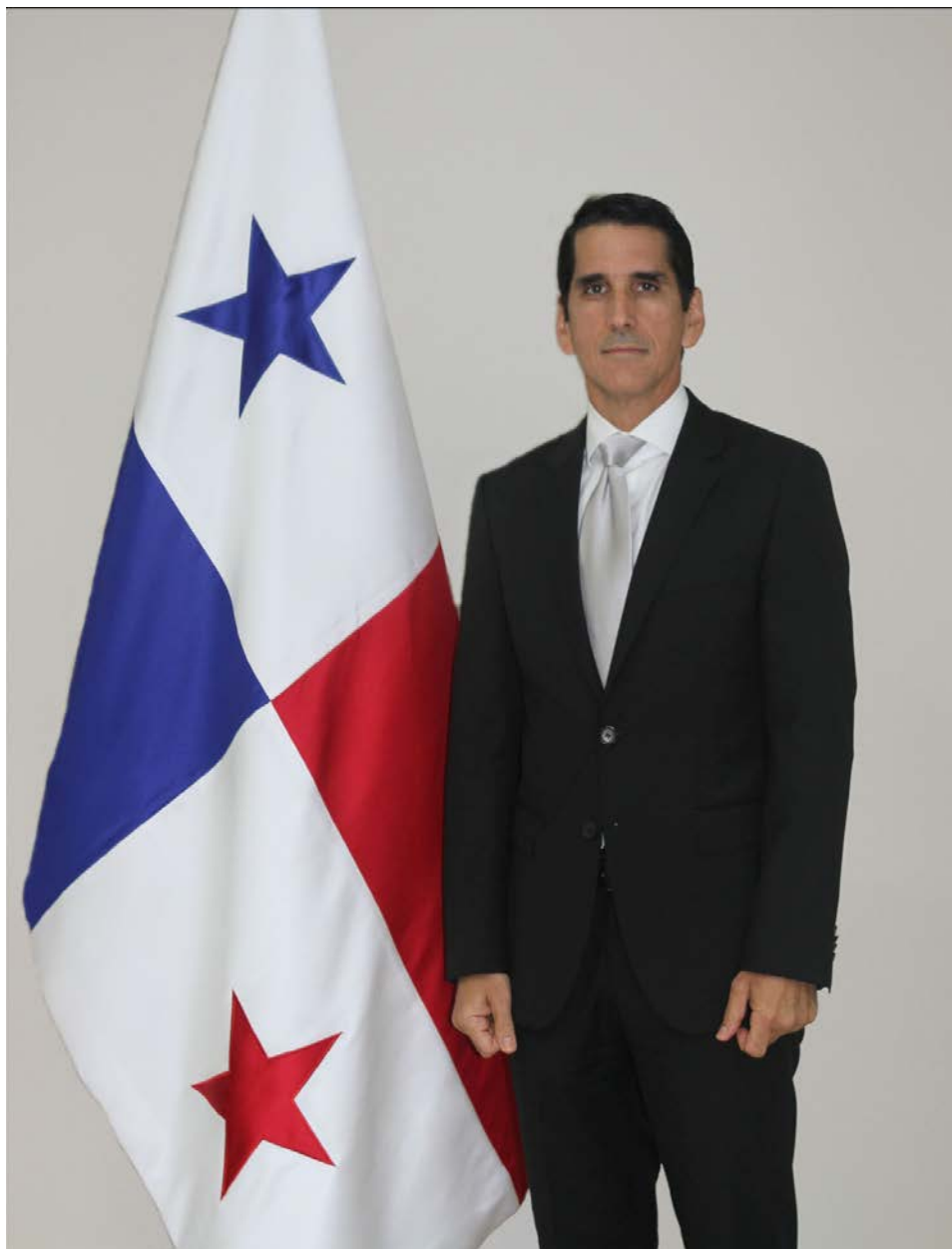
Su Excelencia RÓMULO ROUX Ministro de Relaciones Exteriores