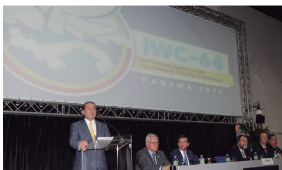
Ministro de Relaciones Exteriores, Roberto C. Henríquez, participa en la inauguración de las sesiones plenarias de la 64ª Reunión Anual de la Comisión Ballenera Internacional (CBI).