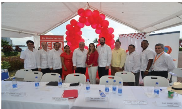
Conmemoración del Día Mundial contra el SIDA, en la Cinta Costera, ciudad de Panamá.