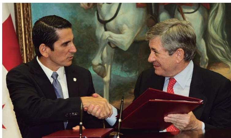
Firma del Convenio entre la Cancillería y la Fundación Europea para la Sociedad de la Información y Administración Electrónica.