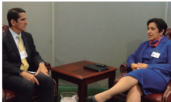
Reunión con la Presidenta de la Unión Europea en Nueva York, para fortalecer las relaciones comerciales y políticas.