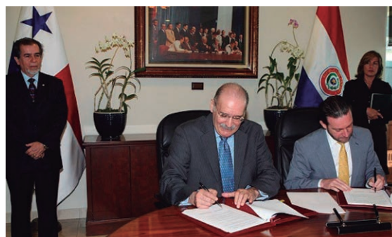
Firma del Acta de la Primera Reunión de las Comisiones Mixtas de Cooperación Educativa-Cultural y Técnica-Científica entre Panamá y Paraguay.