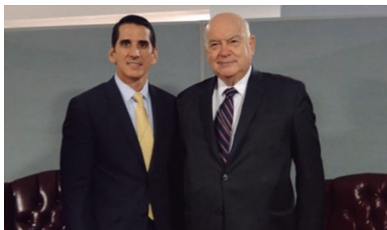
Canciller se reúne con Secretario General de la OEA, en Nueva York.