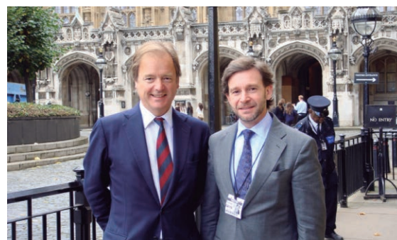
Vicecanciller Francisco Álvarez De Soto se reunió en Londres con Hugo Swire, Ministro de Estado de Asuntos Exteriores para América Latina, y concurrió ante el Canning House para exponer sobre la diplomacia comercial de Panamá.