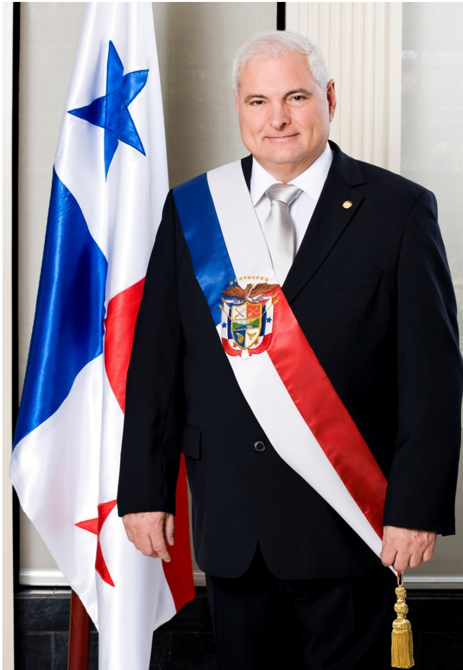
Excelentísimo Señor Ricardo Martinelli Berrocal Presidente de la República de Panamá