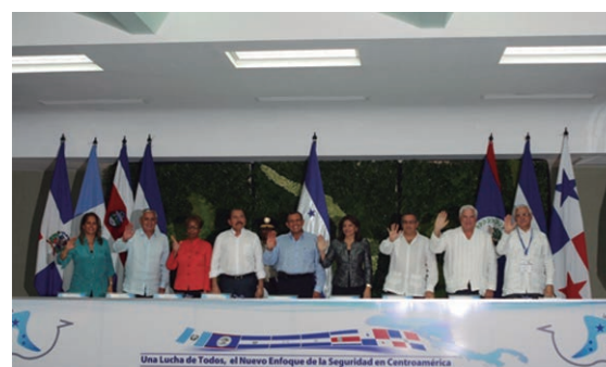
XXXIX Reunión Ordinaria de Jefes de Estado y de Gobierno del Sistema de la Integración Centroamericana (SICA), Tegucigalpa, Honduras.