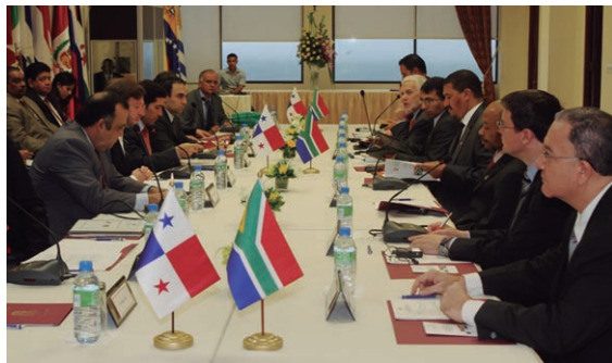
Ministro Encargado de Relaciones Exteriores, Francisco Álvarez De Soto y el Viceministro sudafricano de Relaciones Internacionales y de Cooperación, Marius Fransman se reúnen para fortalecer relaciones bilaterales.