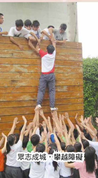
眾志成城，攀越障礙