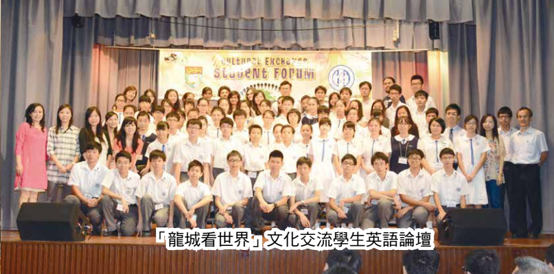
「龍城看世界」文化交流學生英語論壇