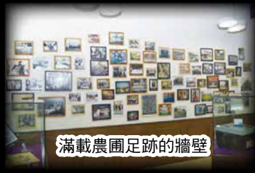
滿載農圃足跡的牆壁