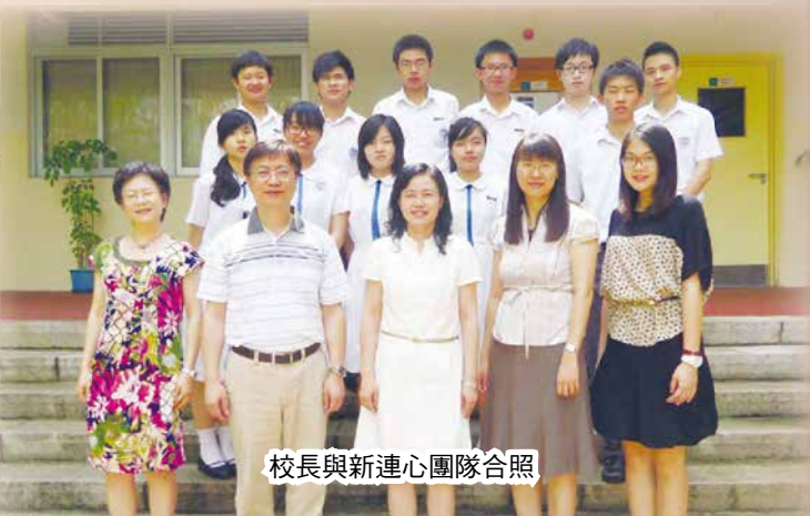
校長與新連心團隊合照