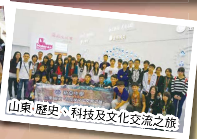
山東 歷史、科技及文化交流之旅