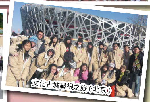
文化古城尋根之旅（北京）