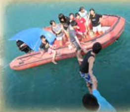
乘風啟航，熱愛生命