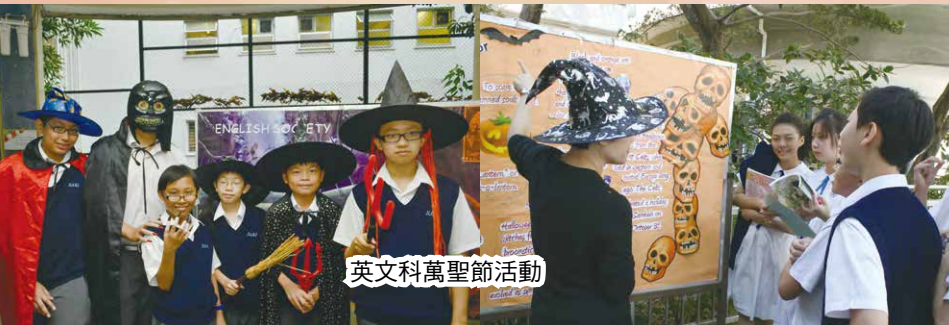
英文科萬聖節活動