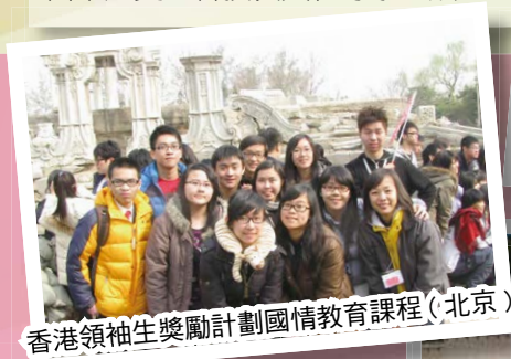
香港領袖生獎勵計劃國情教育課程（北京）