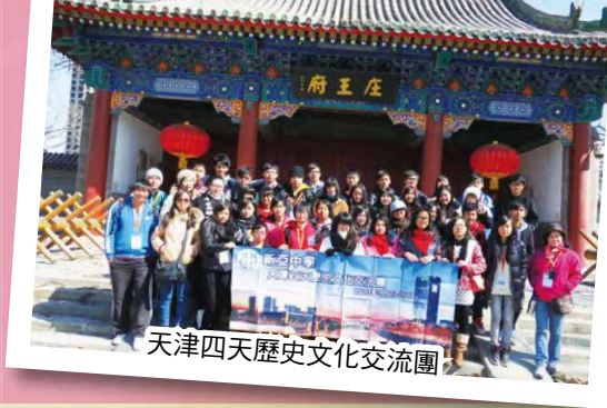
天津四天歷史文化交流團