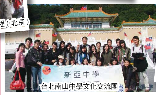
新亞中學 台北南山中學文化交流團