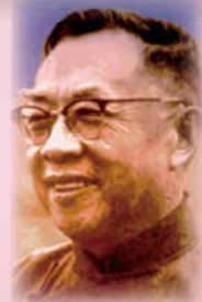
新亞精神的奠基者 — 錢穆教授