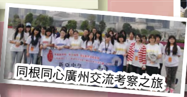
同根同心廣州交流考察之旅