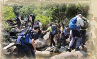
結伴同行，樂於助人