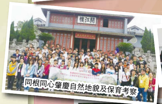
同根同心肇慶自然地貌及保育考察