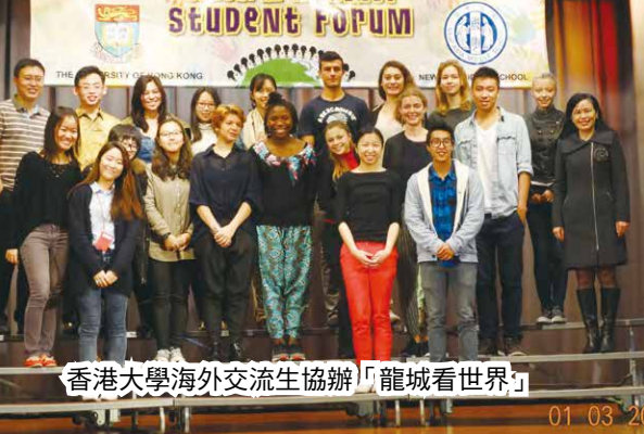
香港大學海外交流生協辦「龍城看世界」