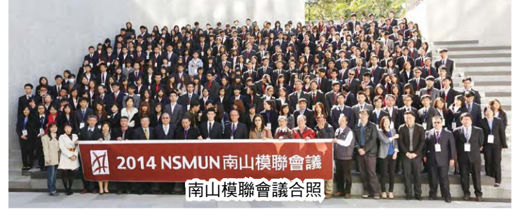
2014 NSMUN 南山模聯會議 南山模聯會議合照