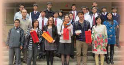
耶魯大學交換生參與本校文化日活動