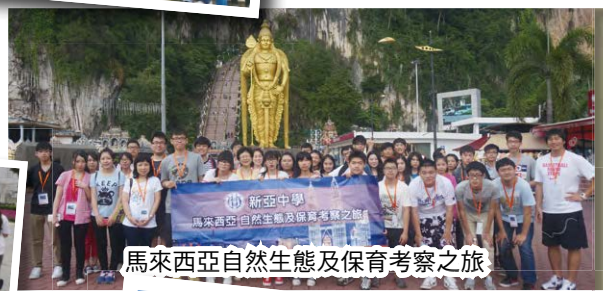
馬來西亞自然生態及保育考察之旅