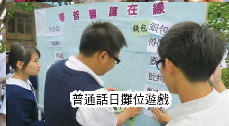
普通話日攤位遊戲