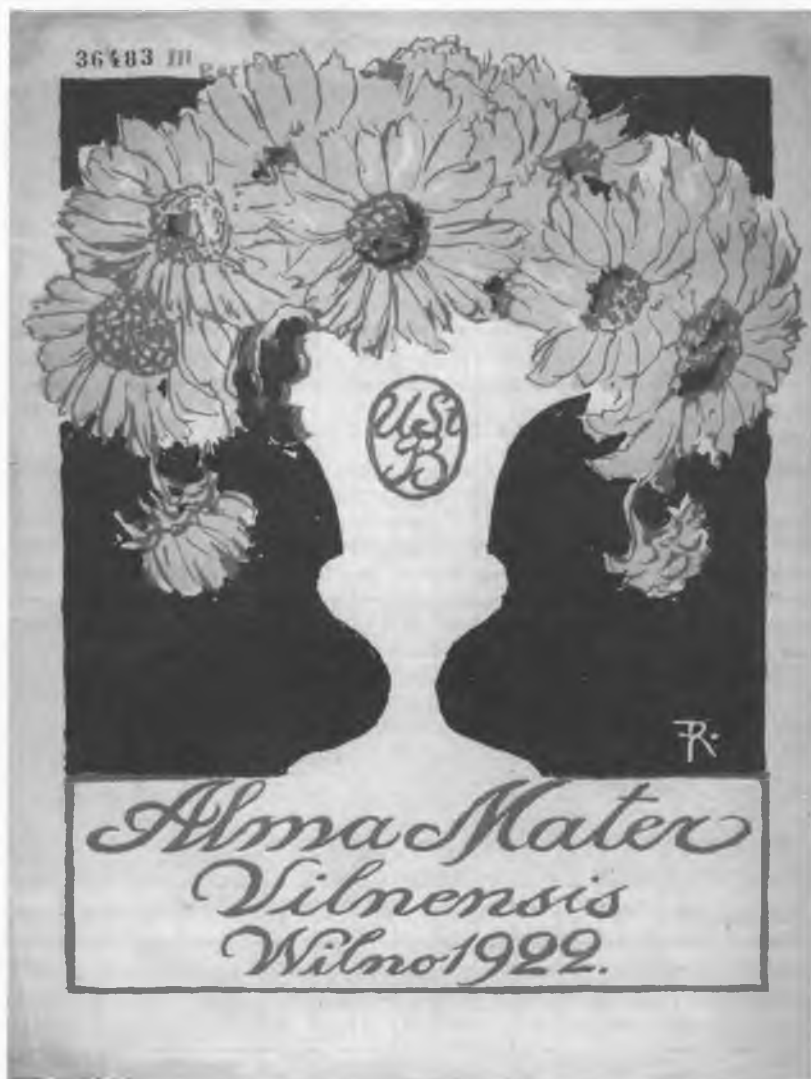
Okladka czasopisma akademickiego „Alma Mater Vilnensis”. Projekt F. Ruszczyc