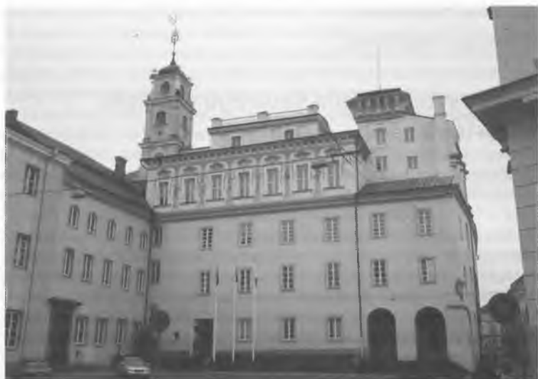
Gmach główny Uniwersytetu Stefana Batorego. Stan z roku 2009

zgasłoby w Polsce całej” 3 . Niestety Powstanie Listopadowe, a konkretnie jego niepomyślne dla Polaków zakończenie, stało się przyczyną likwidacji uniwersytetu, 1.05.1831r. car Mikołaj I wydał ukaz zamykający uczelnię. Co prawda zachowane zostały dwa wydziały, lekarski oraz prawno-teologiczny, które zostały przekształcone w Akademię Medyko-Chirurgiczną oraz w Akademię Duchowną, ale i one zostały zlikwidowane w 1842 r. Akademię Medyko-Chirurgiczną zlikwidowano całkowicie, natomiast Akademię Duchowną przeniesiono do Petersburga, gdzie rozpoczęła ona nowy żywot i funkcjonowała do 1917 r., kiedy to została zlikwidowana w wyniku rewolucji. Cały majątek uczelni, poza jej budynkami, został rozparcelowany po terenie imperium, ludzie także się rozproszyli, w Wilnie pozostała zaś pustka. Przez następne 87 lat wilnianie bezskutecznie podejmowali różne inicjatywy mające wskrziesić w tym mieście wyższą uczelnię. Taki stan rzeczy trwał aż do 1919 r., kiedy to w październiku wreszcie udało się władzom polskim dokonać reaktywacji uczelni jako Uniwersytetu Stefana Batorego (USB).