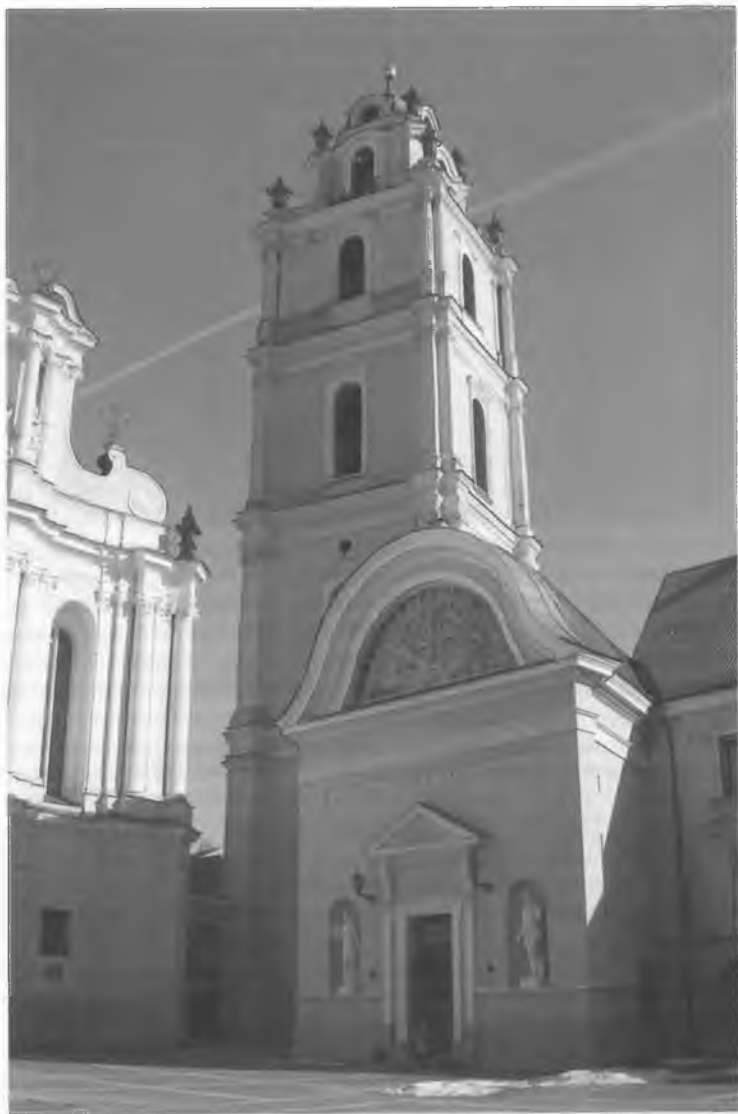
Dziedziniec Piotra Skargi i wejście do auli uniwersytetu