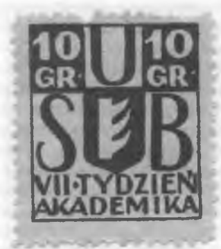
Znaczek wydany na VII Tydzień Akademika w Wilnie