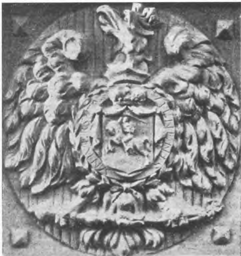
Godło USB umieszczone na gmachu uniwersytetu

pracowników USB. O integralnym powiązaniu uczelni z Polską świadczyła także jego działalność. Szczególnie ta w pierwszych latach jego istnienia. Najbardziej wymownym przykładem na to było zaangażowanie się naukowców w prace Sejmu Wileńskiego, który zdecydował na początku 1922 r. o włączeniu Wilna i Wileńszczyzny do Polski. Z polecenia Prezesa Tymczasowej Komisji Rządzącej Litwy Środkowej utworzona z grupy profesorów uniwersytetu 18 Komisja Naukowa do Spraw Sejmu Wileńskiego przy-