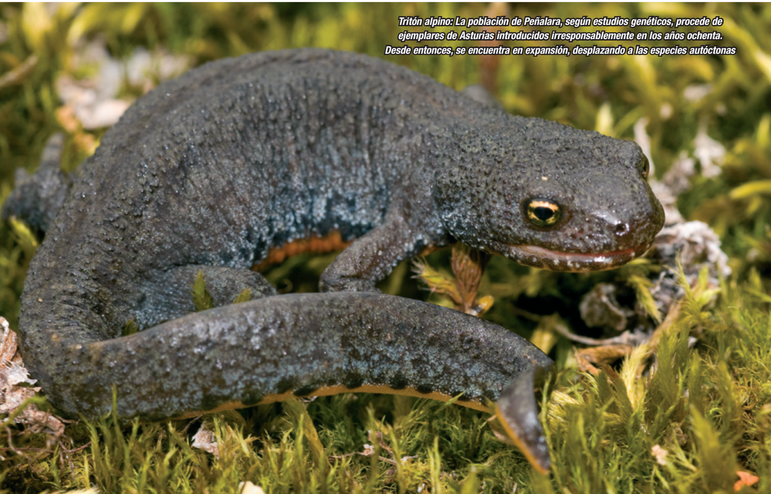
Tritón alpino: La población de Peñalara, según estudios genéticos, procede de ejemplares de Asturias introducidos irresponsablemente en los años ochenta. Desde entonces, se encuentra en expansión, desplazando a las especies autóctonas

de su temporalidad, principalmente en las zonas bajas de la comunidad, aunque llega hasta los 1.480 metros en el puerto de Malagón; el sapo de espuelas ( Pelobates cultripes ), especie típica de ambientes mediterráneos que necesita suelos blandos y arenosos donde poder enterrarse utilizando su espuela córnea que se reproduce en masas de agua con cierto volumen, como balsas terrazas para el ganado, y que llega hasta los 1.460 metros en el puerto de Cancia; y por último, las discutidas dos especies de sapillos pintojos, el sapillo pintojo ibérico ( Discoglossus galganoi ) y el sapillo pintojo meridional ( Discoglossus jeanneae ) que actualmente son consideradas dos especies distintas por algunos autores, mientras que otros las consideran dos subespecies dentro de una única especie. Las dos se localizan en pastizales encharcados, manantiales y encharcamientos junto a pilones, fuentes y abrevaderos, ocupando la primera la mitad occidental de la comunidad y la segunda la mitad oriental; aun así, existen poblaciones difícilmente asignables genéticamente a una u otra especie. Aunque no sube en altura, de forma ocasional se ha encontrado algún ejemplar en el entorno del puerto de Cotos.