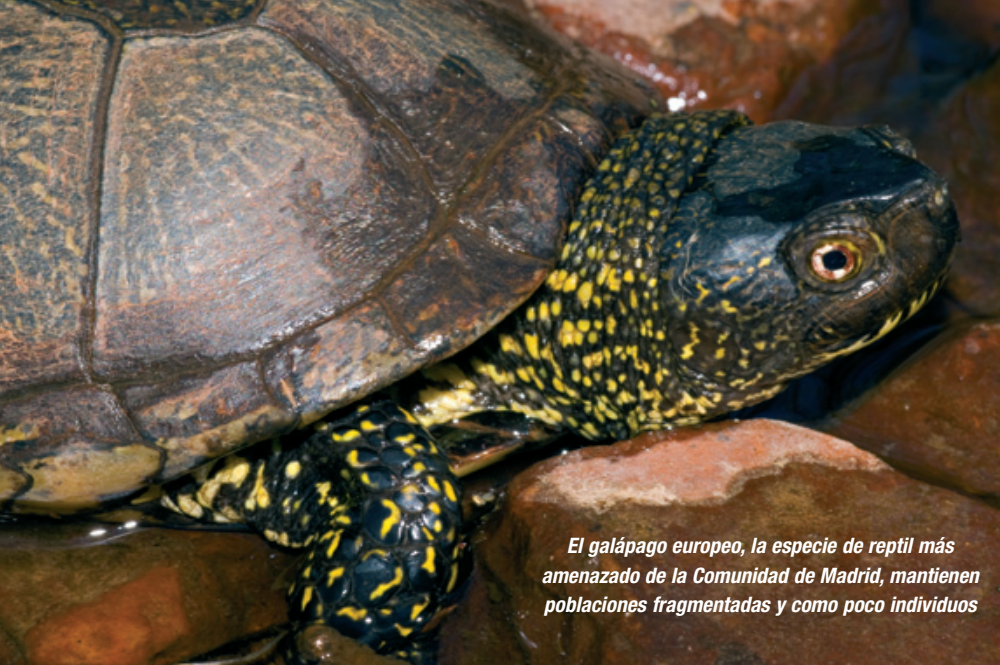
El galápago europeo, la especie de reptil más amenazado de la Comunidad de Madrid, mantienen poblaciones fragmentadas y como poco individuos