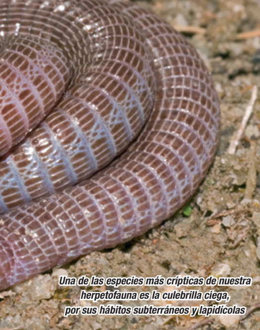
Una de las especies más crípticas de nuestra herpetofauna es la culebrilla ciega, por sus hábitos subterráneos y lapidícolas