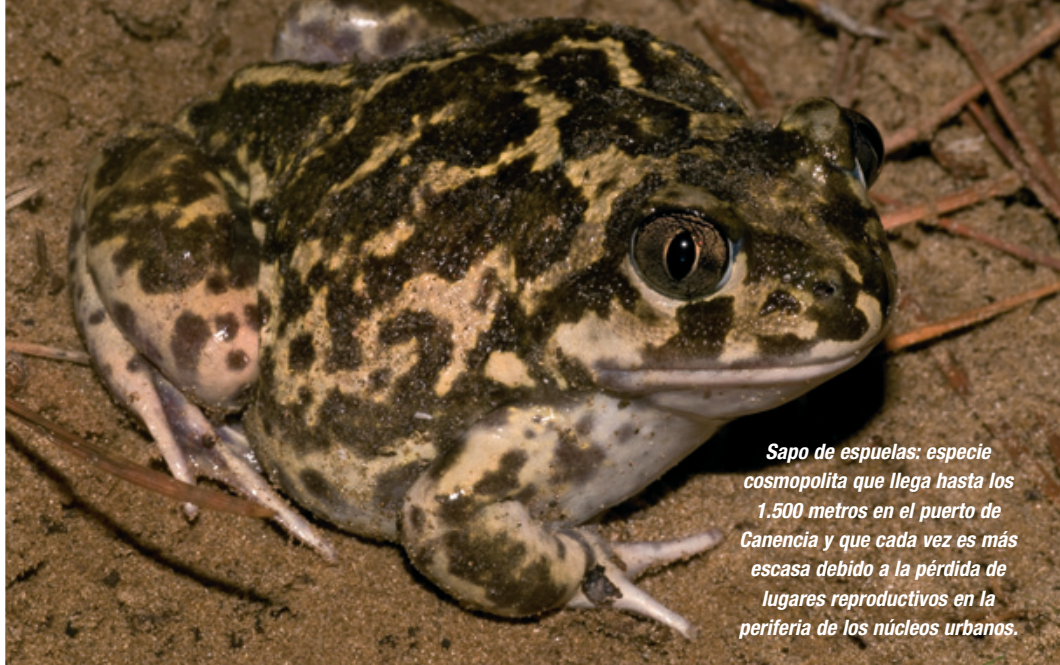
Sapo de espuelas: especie cosmopolita que llega hasta los 1.500 metros en el puerto de Canencia y que cada vez es más escasa debido a la pérdida de lugares reproductivos en la periferia de los núcleos urbanos.

doméstica. Este problema se acentúa cuando se manifiesta con el reptil más amenazado de la fauna madrileña, el galápagos europeo.