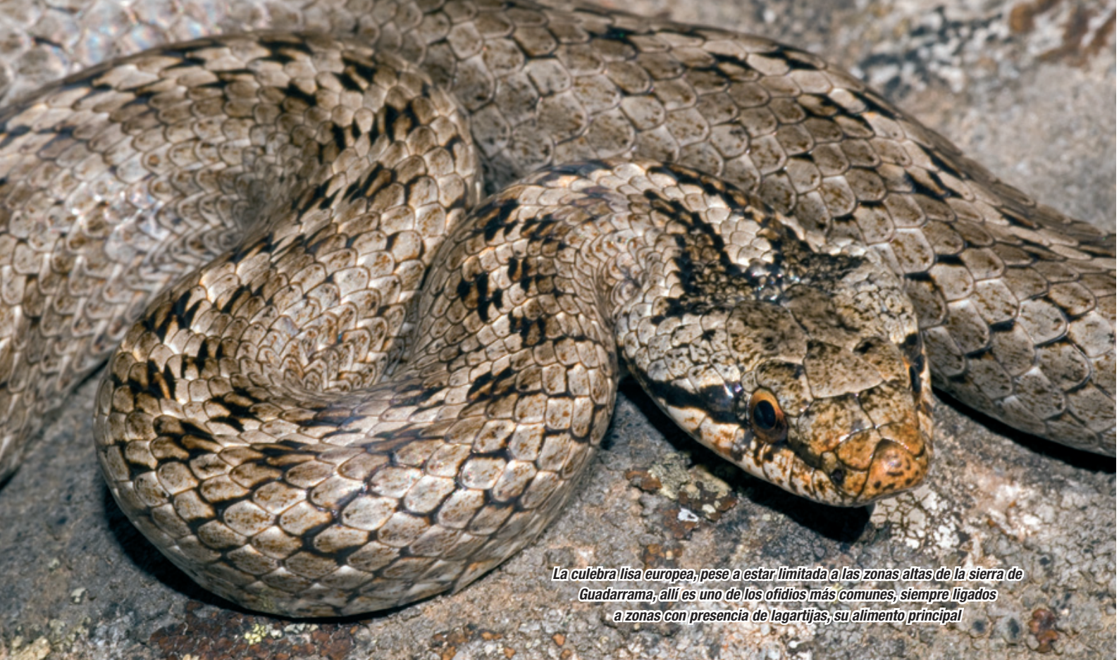
La culebra lisa europea, pese a estar limitada a las zonas altas de la sierra de Guadarrama, allí es uno de los ofidios más comunes, siempre ligados a zonas con presencia de lagartijas, su alimento principal