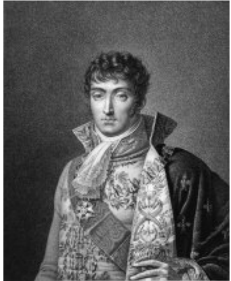
Afb. 2 Lodewijk-Napoleon (1778-1846) van 1806 tot 1810 koning van het koninkrijk Holland. Van 9 juni tot en met 24 september 2006 zijn in Museum Het Schielandshuis te Rotterdam prenten en tekeningen van dit intermezzo in de vaderlandse geschiedenis te zien uit de collectie Atlas van Stolk, tijdens de tentoonstelling 'Lodewijk Napoleon, eerste koning van Nederland, 1806-1810'.

Het koninkrijk Holland is in dit verband een fenomeen dat te complex schijnt om voor een groot publiek aantrekkelijk te zijn. Tussen 1806 en 1810 werd de basis gelegd voor Nederland als staat en natie. Lodewijk-Napoleon – de eerste koning die dit land heeft gehad – vestigde in die periode een centraal bestuur, codificeerde de versplinterde wetgeving en liet instituten voor cultuur en wetenschap oprichten die nu nog een prominente rol vervullen. Toch wordt koninkrijk noch vorst een groot gedenjaar waardig geacht. Lodewijk de Eerste mag dan nog zo zijn best hebben gedaan om de belangen van zijn nieuwe vaderland te beschermen tegen zijn keizerlijke broer, kennelijk is hij in de ogen van velen nog steeds een usurpator die we maar beter kunnen doodzwijgen. Het uiterst boeiende symposium dat de door hem opgerichte Koninklijke Nederlandse Academie voor Wetenschappen in maart rondom dit onderwerp organi-