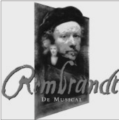
Afb. 1 Promotiemateriaal voor 'Rembrandt De Musical'.

Het zwaartepunt van de activiteiten ligt in Amsterdam en Leiden. Deze laatste stad beschikt nauwelijks over tastbare overblijfselen van Rembrandt en naast de drie bijzondere Rembrandttentoonstellingen die Stedelijk Museum De Lakenhal dit jaar organiseert, kent het programma hoofdzakelijk activiteiten die gericht zijn op het toerisme. Zoals onder meer een mozaïek van een zelfportret van Rembrandt in 58.000 bollen, een ijssculpturen-festival, een buitenexpositie met schilderijen in de binnenstad, uitvoeringen van muziek uit Rembrandts tijd, een wandelroute en een driedaags kernprogramma in juli met kluchten, muziek, een levende Nachtwacht en rondleidingen op de warenmarkt waar acteurs rondlopen in kleding uit de 17 e eeuw. De relatie met Rembrandt is bij sommige onderdelen flinterdun.