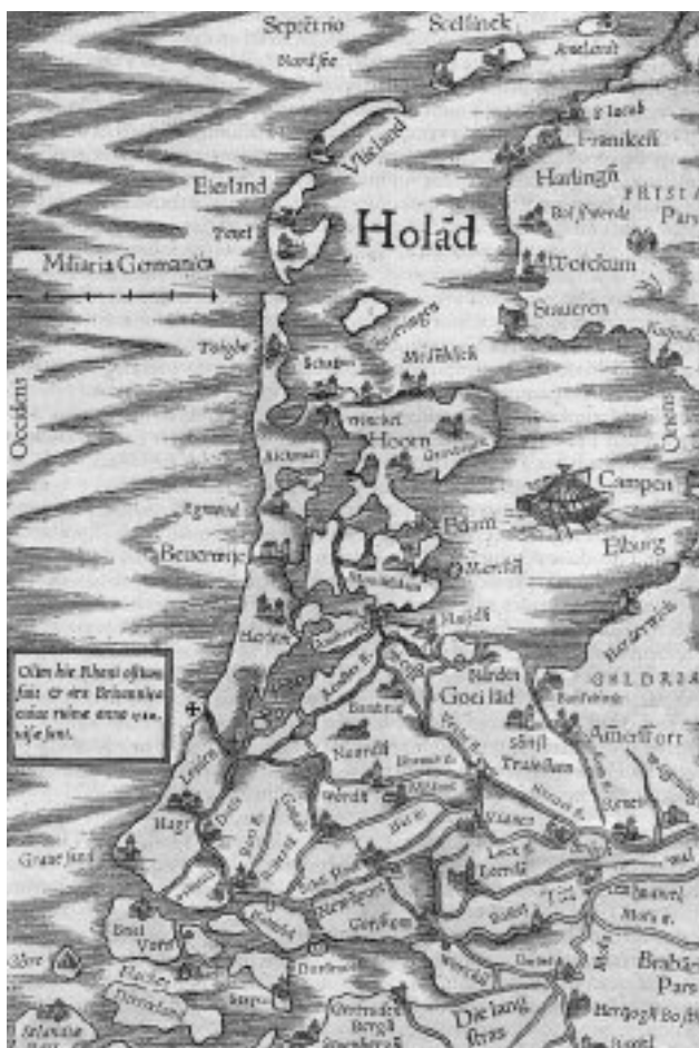
Afb. 1 Het graafschap Holland, begin 16de eeuw [houtsnede uit Sebastian Münster, Cosmographia Universalis, editie 1550; ].

dan vooral met de steden, die hij aan zich verplichtte door het verlenen van de nodige privileges en door de instelling van een stedelijke adviesraad.