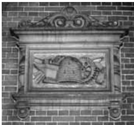
Afb. 3 Reliëf met symbolen van de nijverheid, eilandperron.

De term wachtkamer is eigenlijk een tamelijk bescheiden aanduiding 12 . Er is meer sprake van een koninklijk paviljoen, dat aan de linkerzijde van het front is uitgebouwd. Hier bevindt zich de ingang met een apart trappenhuis met rijk gekleurd marmer, bronzen balusters en lantaarns, muurschilderingen en een groot glas-in-loodraam van de firma Jan Schouten uit Delft, dat leidt naar de