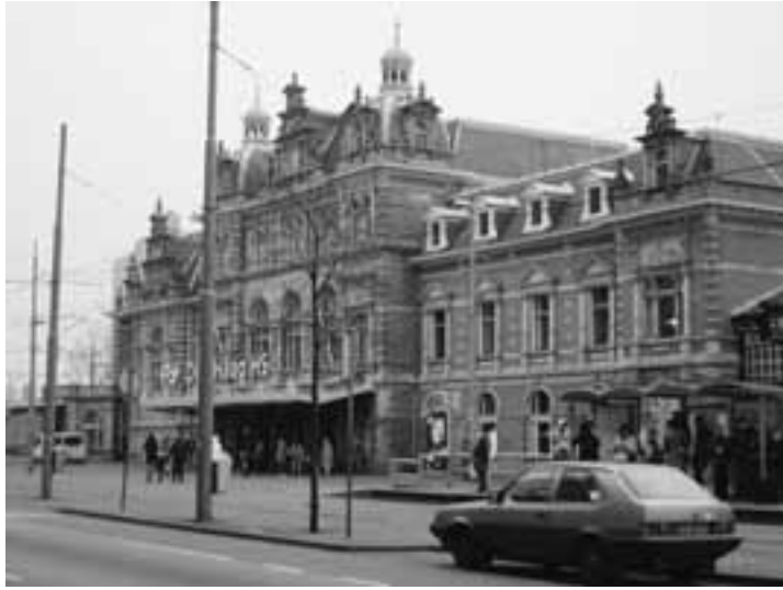
Afb. 6 Stationsplein met station Hollandse Spoor, 2006.

Haag Centraal Station begin jaren zeventig bestond het idee om Hollandse Spoor maar af te breken en een eenvoudiger station te bouwen met minder functies. Centraal Station zou het hoofdstation van Den Haag worden. Later bleek Hollandse Spoor toch belangrijker dan verwacht en werd besloten tot restauratie. Deze startte met de koninklijke