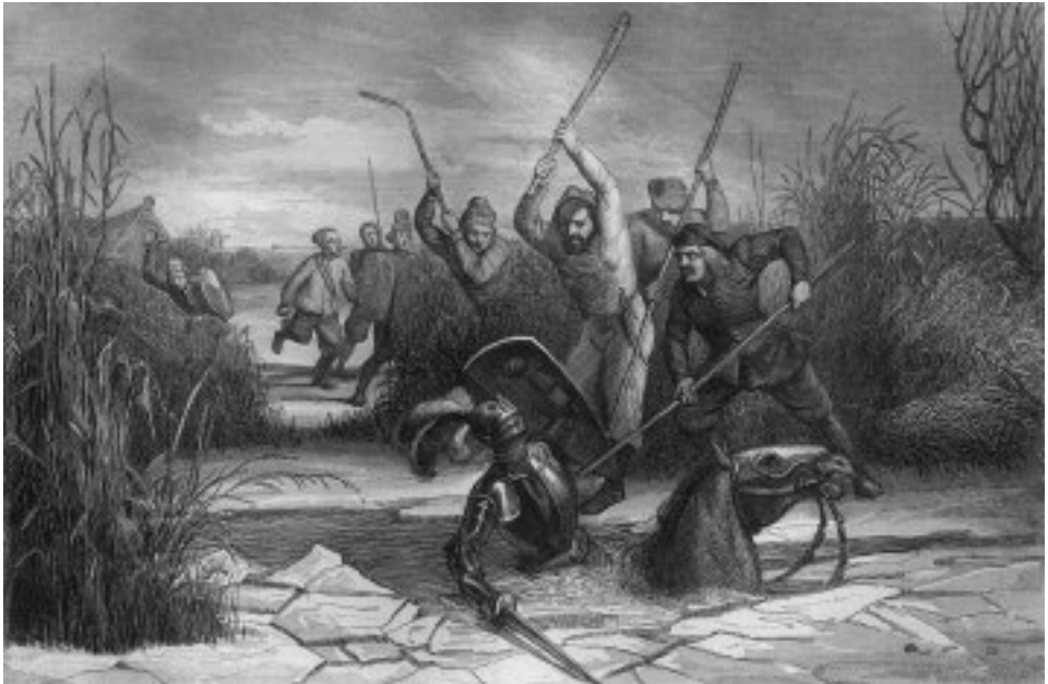
Afb. 3 Graaf Willem II sneuvelt in de Slag bij Hoogwood.