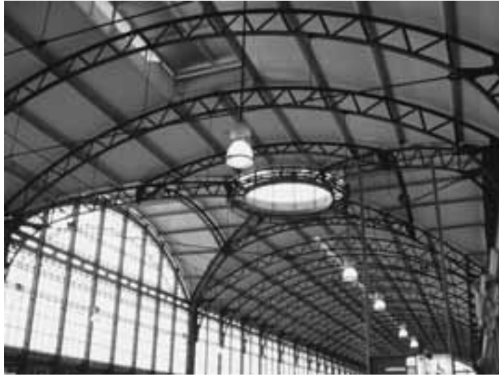
Afb. 2 Eén van de peronoverkappingen met koepel.

bestemming van het gebouw van buiten af herkenbaar maken. Veel symbolen geven de nijverheid en industrie aan, zoals het tandrad, het scheepsanker en de bijenkorf. De spoorwegen worden met het symbool van het gevleugelde wiel verbeeld. Deze beeldtaal sluit nauw aan bij het gedachtegoed van de 19e-eeuwse liberale burgerij. Veel van het beeldhouwwerk werd geleverd door het Amsterdamse, van oorsprong Belgische, atelier Elisée van den Bosche en Crevels.