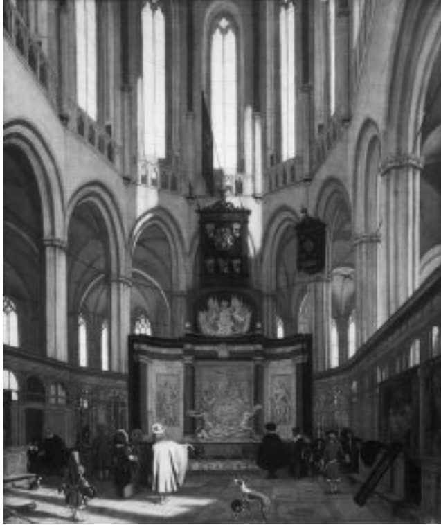
Afb. 2 Het koor van de Nieuwe Kerk te Amsterdam met het praalgraf van Michiel de Ruyter, Emanuel de Witte, 1683. Rijksmuseum Amsterdam.

waterschapsbeheer. Amsterdam wilde een niet al te hoog waterpeil omdat anders alle huizen nattig zouden worden en de scheepvaart onder de bruggen werd belemmerd. Een laag waterpeil was echter weer lastig voor een aantal waterschappen rondom de stad, want dan moesten ze extra bemalen. Amsterdam zette echter spijkerhard door en met succes.”