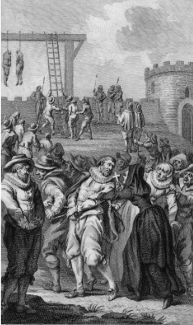
Afb. 1 Quirijn Dirksz Talesius, oud-pensionaris van Haarlem, wordt op weg naar de galg getroost door vrouw en dochter. Reinier Vinkeles (1741-1816). Kopergravure.

In deze aanstellingsakte ligt de nadruk allereerst op de externe vertegenwoordiging van de stad en de verslaggeving daarvan aan de burgemeesters en pas in tweede plaats op zijn rol als raadsman van het gerecht. Deze omkering in de taakomschrijving zou kunnen duiden op een verschuiving in de werkzaamheden van de pensionaris aan het einde van de 15de eeuw.