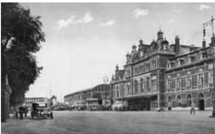
Afb. 1 Stationsplein met station Hollandse Spoor, ca. 1925. Ansichtkaart.

Voor het Laakhavengebied achter het station Hollandse Spoor was het bijna te laat. Slechts een paar in het oog springende panden, die voor de lokale industriële geschiedenis nauwelijks van belang