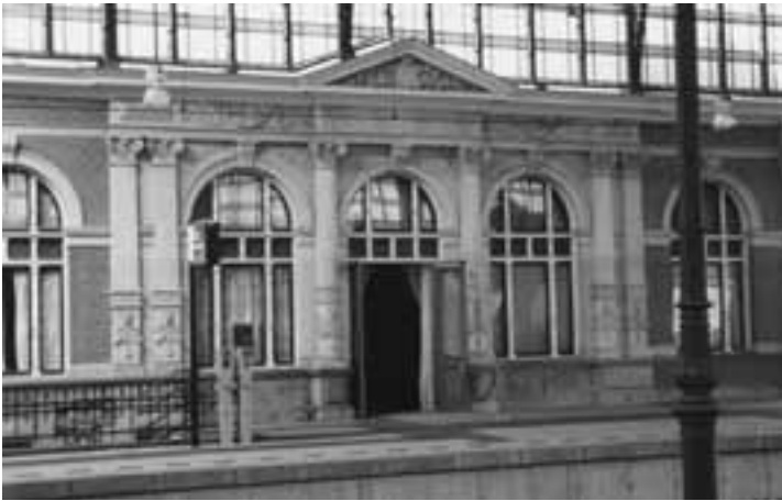
Afb. 4 Ingang koninklijke wachtkamer aan perronzijde.

ontvangstruimten. Deze worden gevormd door een driedelige wachtkamer, twee kabinetten met toiletruimten en twee zijkamers. De centrale wachtruimte heeft een rijke geschilderde plafonddecoratie met in de koof geschilderde wapens van alle provincies. De wanden zijn bespannen met stof waarin bloemmotieven of figuren zijn geweest. In de zijruimten bevinden zich twee schouwen met schoorsteenmantels met tegels van de firma Rozenburg 13 . Boven de schoorsteenmantels bevinden zich geschilderde schoorsteenstukken. Overigens is de ruimte niet echt een wachtkamer, maar meer een aankomst- en ontvangstruimte, want de koningin is tenslotte de enige in Nederland die nooit op de trein hoeft te wachten.