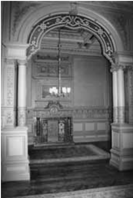
Afb. 5 Interieur koninklijke wachtkamer.

Haag Centraal Station begin jaren zeventig bestond het idee om Hollandse Spoor maar af te breken en een eenvoudiger station te bouwen met minder functies. Centraal Station zou het hoofdstation van Den Haag worden. Later bleek Hollandse Spoor toch belangrijker dan verwacht en werd besloten tot restauratie. Deze startte met de koninklijke