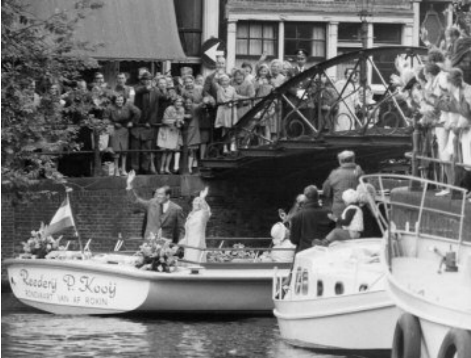
Afb. 3 Rondvaartboot met Beatrix en Claus op de Amsterdamse grachten, 3 juli 1965.