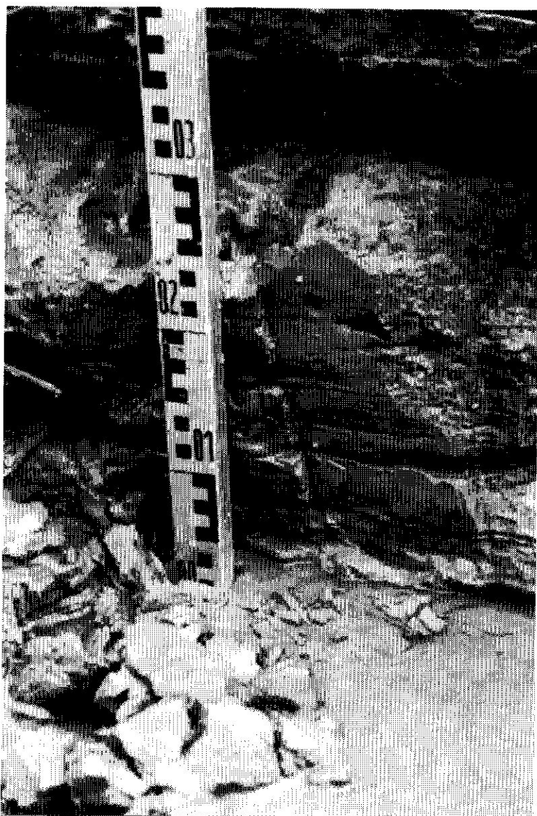
Fig.2 - Particolare della zona centrale di fig.1 in cui viene evidenziato il livello a varve sottostante al tronco di conifera visibile in alto nella fotografia.

in quanto evidenziano che nel livello estivo (campione 3) è prevalsa la mobilitazione della frazione granulometrica modale della sabbia e nel livello invernale (campione 4) quella dell'argilla siltosa.