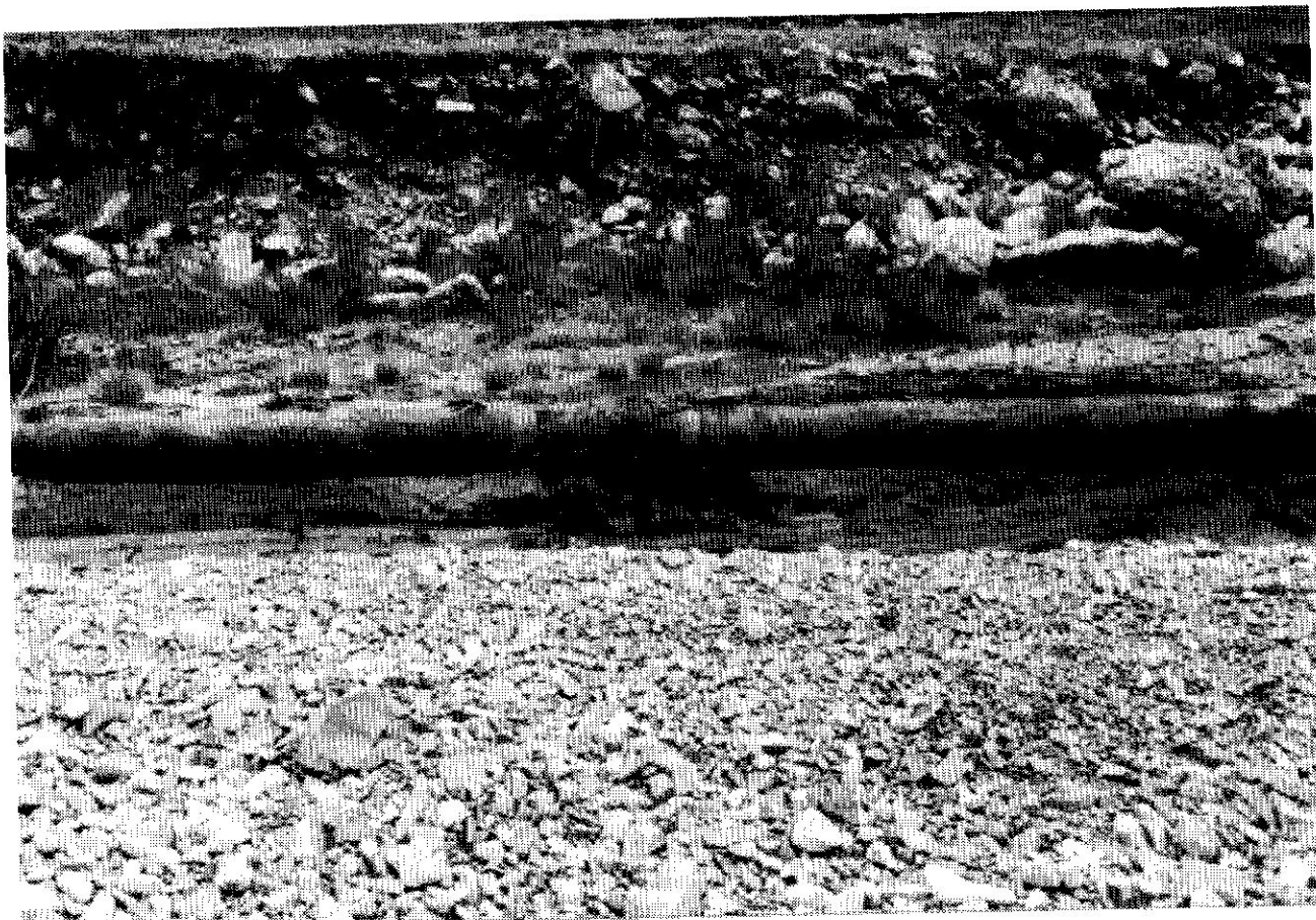
Fig. 1 – Alveo della Vobbia in località foce del Rio Rabbioso con l'affioramento, al centro della fotografia, del deposito argilloso lacustre, contenente il tronco di conifera con il livello a varve e ricoperto, in alto nella fotografia, dalle alluvioni oloceniche di piena ordinaria. In primo piano nella fotografia l'attuale letto di magra della Vobbia.

Bed of the Vobbia River near its confluence with the Rio Rabbioso. The outcrop, with the lacustrine clayey deposit containing the conifer trunk and the varve layer are in the centre of the photograph. The ordinary Holocene flood deposit is in the upper part of the photograph. The present low-water mark of the of the Vobbia River can be seen in the foreground.