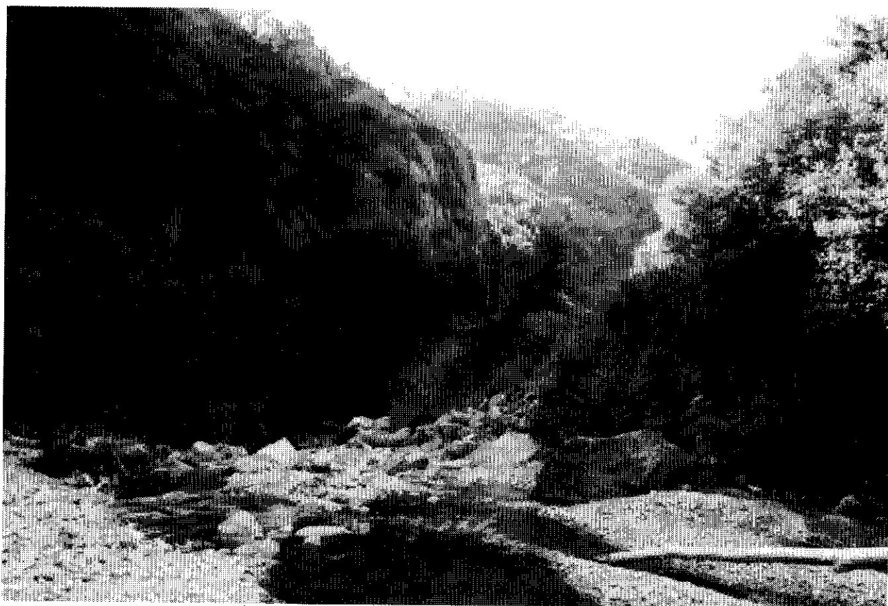
Fig. 4 - In primo piano l'alveo della Vobbia a monte del Ponte di Zan dove si verificò lo sbarramento dell'alveo in seguito ad una frana di crollo e di scoscendimento proveniente dal versante vallivo a sinistra nella fotografia.

Il complesso quindi delle risultanze dell'analisi sedimentologica conferma sostanzialmente la natura