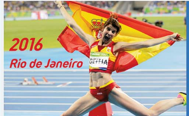
2016 Rio de Janeiro