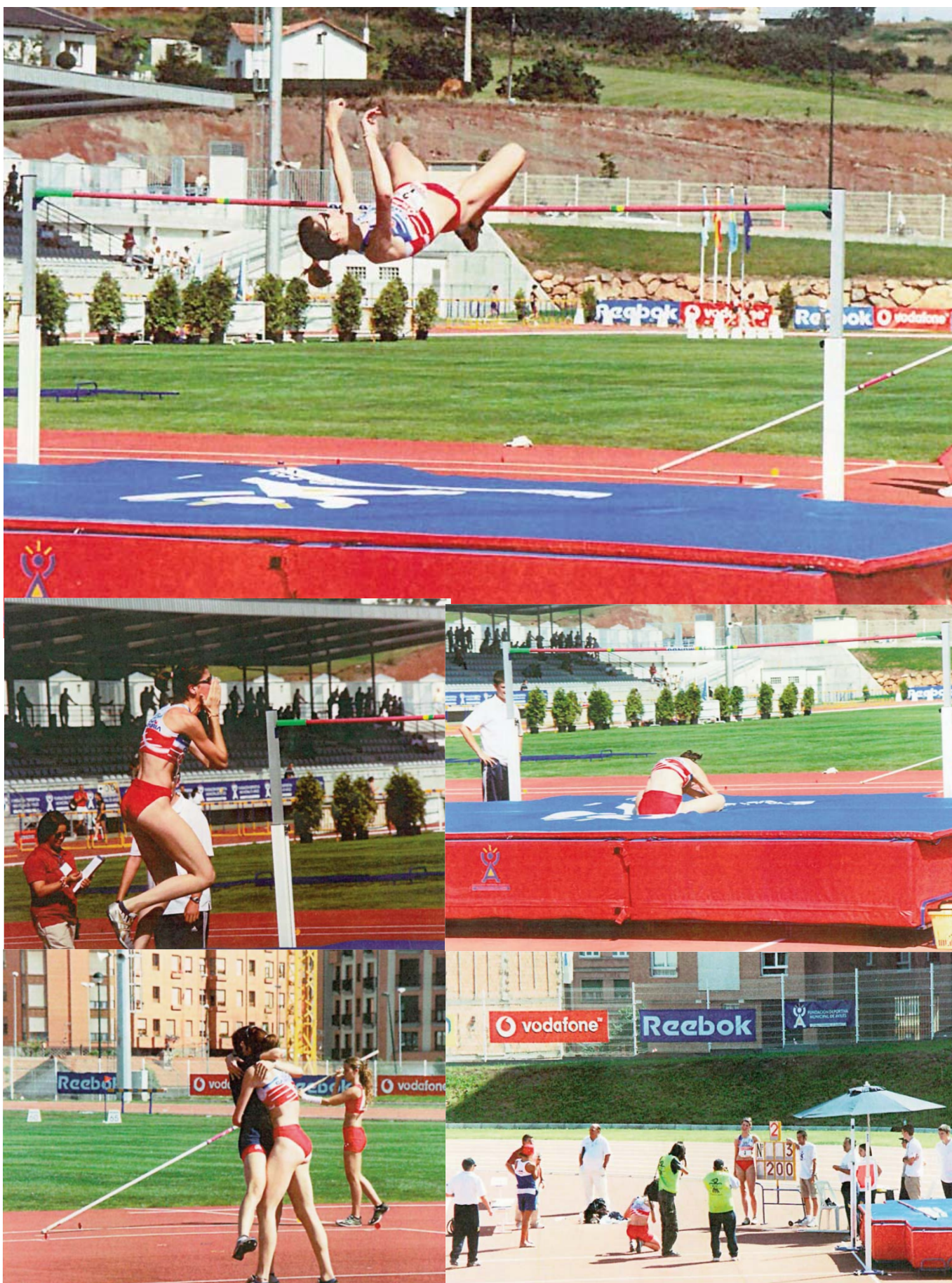
Cinco imágenes de un día histórico: el record de Ruth Beitia sobre 2.00m que saltó en 2003 en Avilés