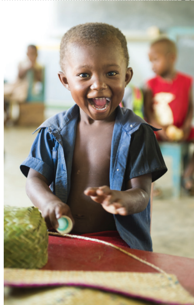
Een jongetje uit Madagascar

Wie een bedrag wil nalaten aan een of meerdere goede doelen kan dit alleen doen via een testament. Bij een testament benoemt u vaak een executeur