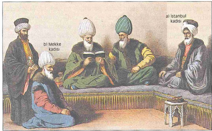
Temsilî bir resimde a) İstanbul kadısı b) Mekke kadısı (Ârif Mehmed Paşa, Mecmûa-i Tesâvir-i Osmâniyye , İstanbul 1279)

ki eyaletlere kadılar düzenli olarak tayin edilirdi; kısacası kadı Osmanlılar'da asırlar boyunca hâkimiyet sembolü olan bir memurdu.