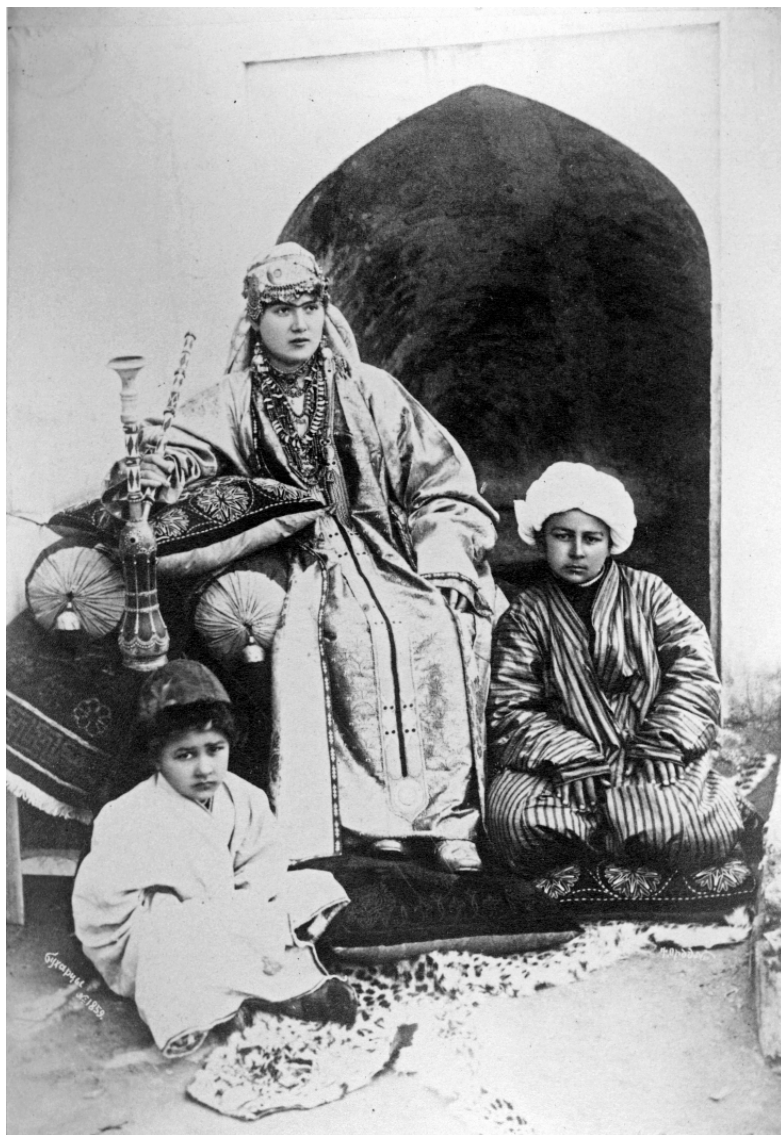
Рис. 3. Бухарцы. Н. Ордэ. 1894 г. (МАЭ. Колл. № 255-167)