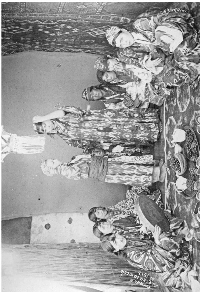
Рис. 10. Коканд, Сарянки и бача. Н. Ордэ. 1894 г. (МАЭ. Колл. № 255-295)