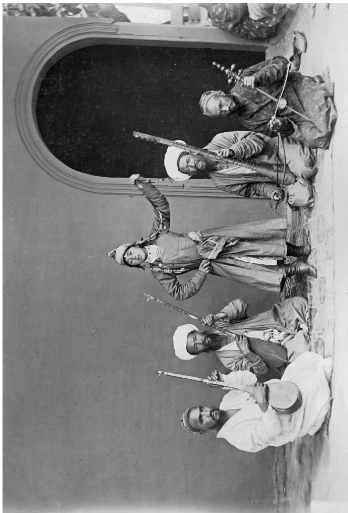
Рис. 11. Ферганская область. Люгче. Пляска мальчика-бачи (МАЭ. Колл. № 512-146)