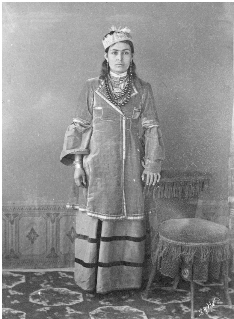
Рис. 5. Богатый наряд сарятки. Н. Ордэ. 1894 г. (МАЭ. Колл. № 255-128)