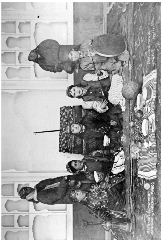
Рис. 6. Сарянки на своей половине. Маргелан Н. Ордэ. 1894 г. (МАЭ. Колл. № 255-126)