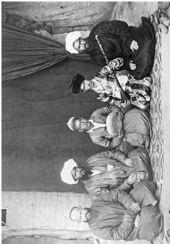
Рис. 12. Бачи и их поклонники. Ташкент. Н. Ордэ. 1894 г. (МАЭ. Колл. № 255-286)