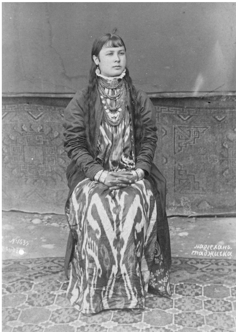
Рис. 4. Таджичка. Маргелан. Н. Ордэ. 1894 г. (МАЭ. Колл. № 255-125)