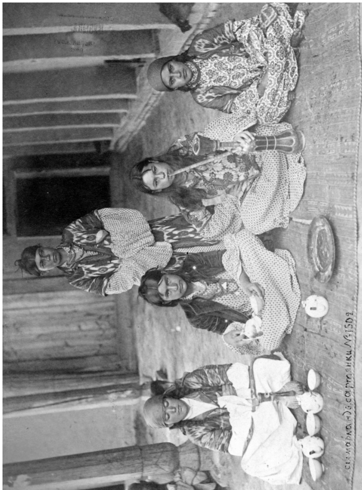
Рис. 8. Публичные женщины. Самарканд. Н. Орда. 1894 г. (МАЭ, Колл. № 255-113)