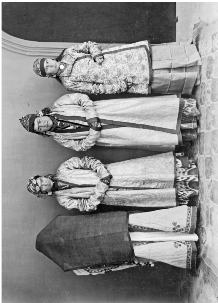
Рис. 2. Женские типы. Ош. Лютче. Ферганская область. Начало XX в. (МАЭ, Колл. № 512-142)