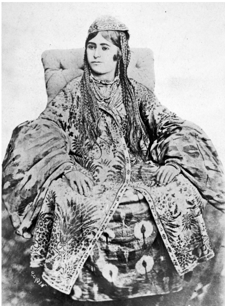
Рис. 9. Кокандская ханша. Н. Ордэ. 1894 г. (МАЭ. Колл. № 255-154).