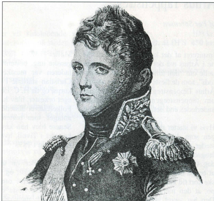
Alexander d. I (1777 - 1825).