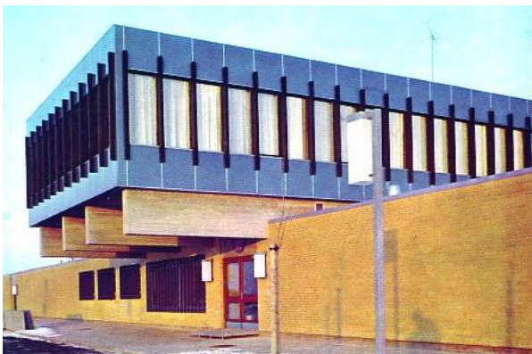
Det nye klubhus på den nuværende adresse i 1969.