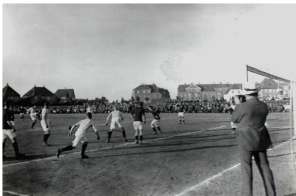
Kamp på anlægget mod OB i starten af tyverne.

”Idrætshuset” blev ombygget flere gange og i starten måtte B 1909 dele anlægget med først B 1922 samt Odense Gymnastikforening og senere Od. KFUM.