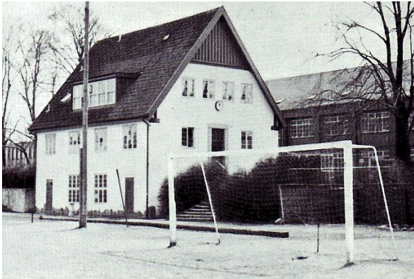
Fra Kochsgade 16 med den særlige nierånd til: