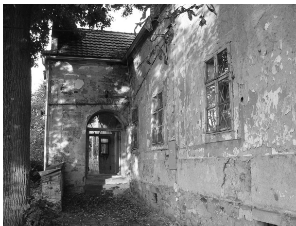
1. kép: Fülek (Fil'akovo), Koháry kúria, 18. század eleje.

A Gömör-Kishont vármegyében lévő Koháry uradalmak nyersanyagban és olcsó munkaerőben gazdag birtokoknak számítottak. A 18. század végén és a 19. század elején épült-átépült urasági székhelyek, birtokigazgatási központok a Koháryak gazdaságilag legstabilabb korszakához köthetők.