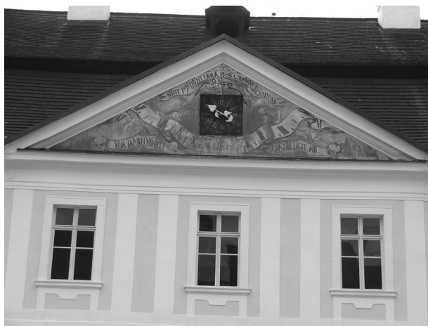
4. kép: Hontszentantali kastély (Svätý Anton), belső udvar, kronosztichon és óralap az északi timpanonban, 1750.

sal, illetve mindkettő kapcsolatban volt a kastély belső udvarán lévő szökőkúttal. Irodalmi források alapján tudjuk, hogy a víznyomás olyan erős volt, hogy a szökőkút vize az első emelet magasságáig fellövellt.