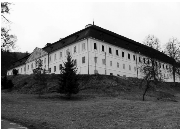
2. kép: Hontszentantal (Svätý Anton), Koháry-Coburg kastély északnyugat felől.

5. 2. 3. A Koháry család „Sanct Anton”-ban 1622–1826 között A Koháryak közel két évszázadot felölelő birtoklástörténete 1622-vel kezdődik és 1826-ban zárul le, amikor a Koháry család férfiágon kihalt. A 17. századból a kastély állapotára nézve adatok nem ismertek. Azonban egy 1699-ben Szentantalon keltezett levél alapján következtetni lehet annak romos állapotára, ugyanis II. Koháry István gróf a kastélyt lakhatóvá tette, és felújíttatta. 14 Az 1700-as évek elején a Rákóczi-féle szabadságharc idején az urasági épület jelentős károkat szenvedett, azonban 1720-ra, Koháry András házasságának idejére helyreállt a rend; Koháry András elsőszülött fia, Miklós ugyanis már a szentantali kastélyban született 1721-ben. A legkorábbi hiteles dokumentum az építési munkálatokra vonatkozólag egy 1722-ből való, Szentantalan keltezett levél Koháry András kezétől, amelyben követ rendel az építkezéshez. 15