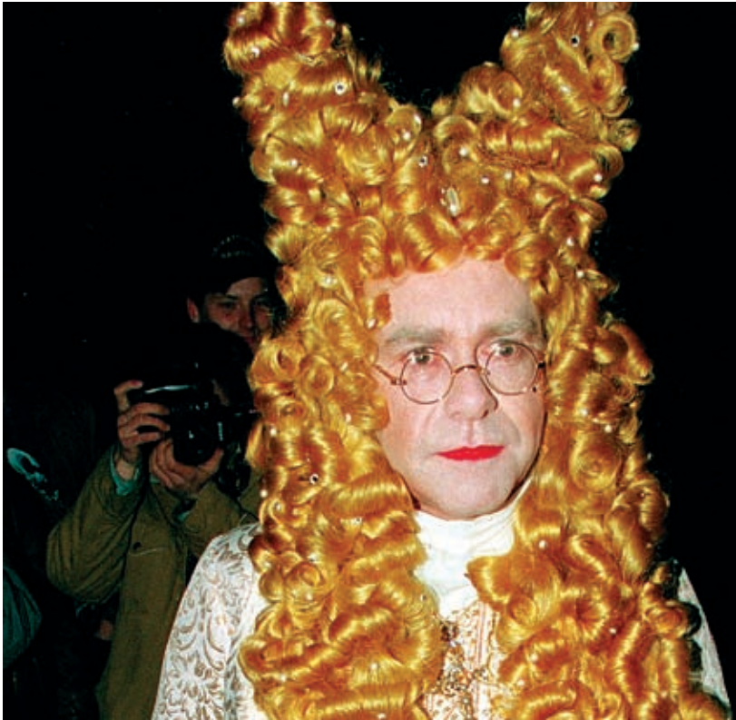
പാട്ടുപോലെ മാലികം കേശഭാരവും : ഗായകൻ എൽട്ടൺ ജോൺ

മുടി എഴുന്നൂനില്ക്കാനുള്ള കഴിവ് നഷ്ടമായിട്ടുണ്ടെങ്കിലും രോമങ്ങളെ ചലിപ്പിക്കുന്നതിനുള്ള ശേഷി അവയുടെ പേശികൾക്കുണ്ട്. 'അറക്ടർ പിലി' പേശികളെന്നാണ് അവയെ വിളിക്കുന്നത്. തണുത്തുവിറയ്ക്കുമ്പോഴും കഠിനമായ പേടിയുണ്ടാവുമ്പോഴും അവ നമ്മുടെ ശരീരത്തിൽ തടിപ്പുകൾ ഉളവാക്കും. ഈ വലിപ്പം വെക്കൽ ഇല്ലാത്ത രോമകവചത്തിന്റെ അഭാവത്തിൽ ശരീരവലുപ്പം തോന്നിപ്പിക്കാനുള്ള ശ്രമമാണ്. ഈ തടിപ്പ് കൂടുങ്ങിയ വായുകൊണ്ട് ശരീരത്തെ പൊതിയുകയും ദേഹം ചൂടായി നിർത്താൻ സഹായിക്കുകയും ചെയ്യും.