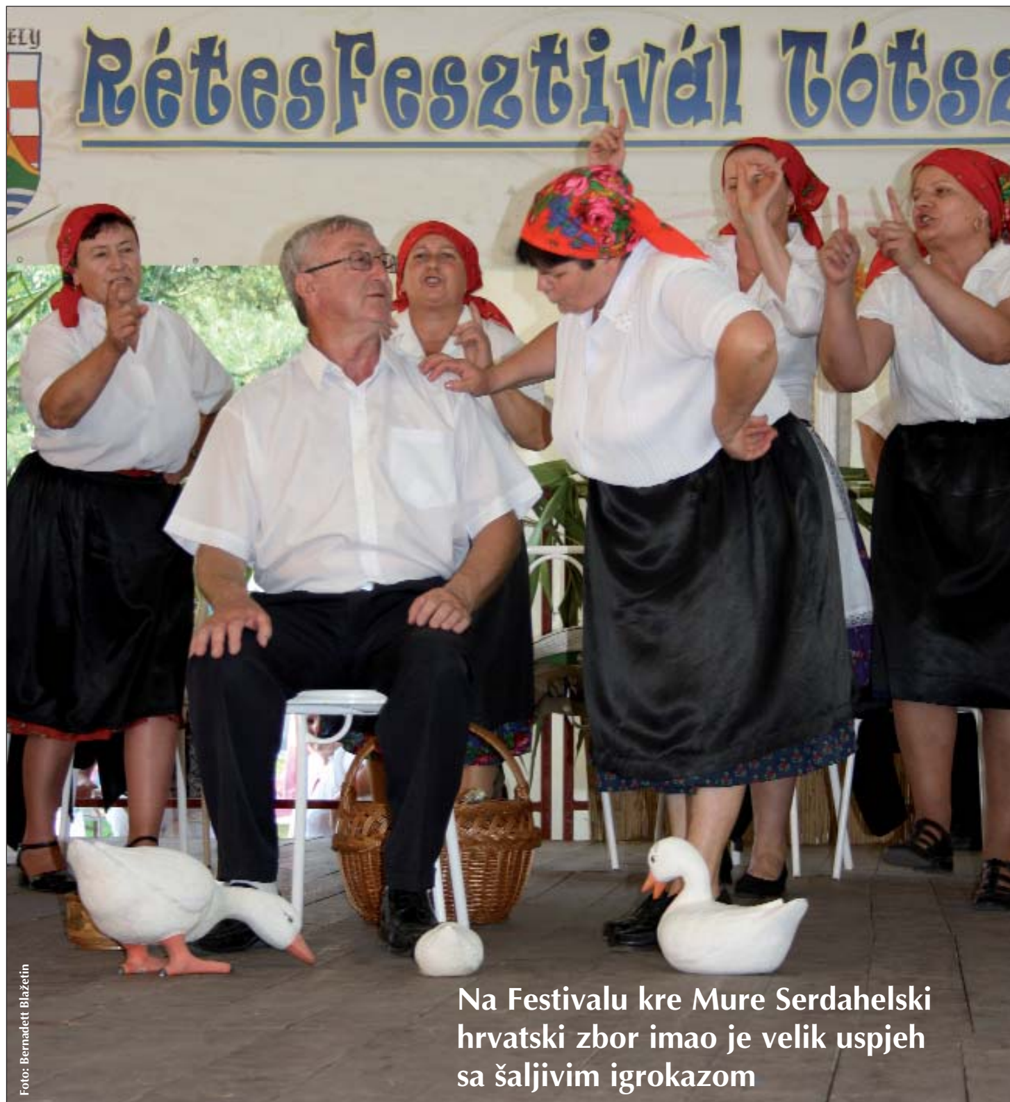
Na Festivalu kre Mure Serdahelski hrvatski zbor imao je velik uspjeh sa šaljivim igrokazom