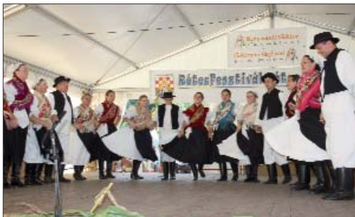
Plesači iz Donjeg Vidovca

tko vrhnje, naime umjesto da se ispeče kadšto se samo skuha, naravno, često je to i zbog štednjaka koji ne grije jednako. Nakon stručnog vrednovanja slijedila je dodjela priznanja i spomenica.