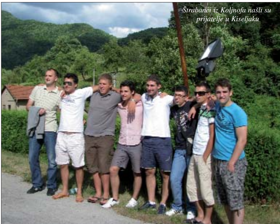
Štrabanci iz Koljnofa našli su prijatelje u Kiseljaku