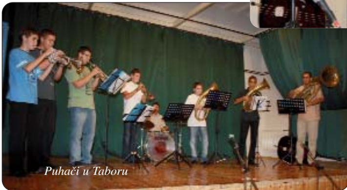
Puhači u Taboru