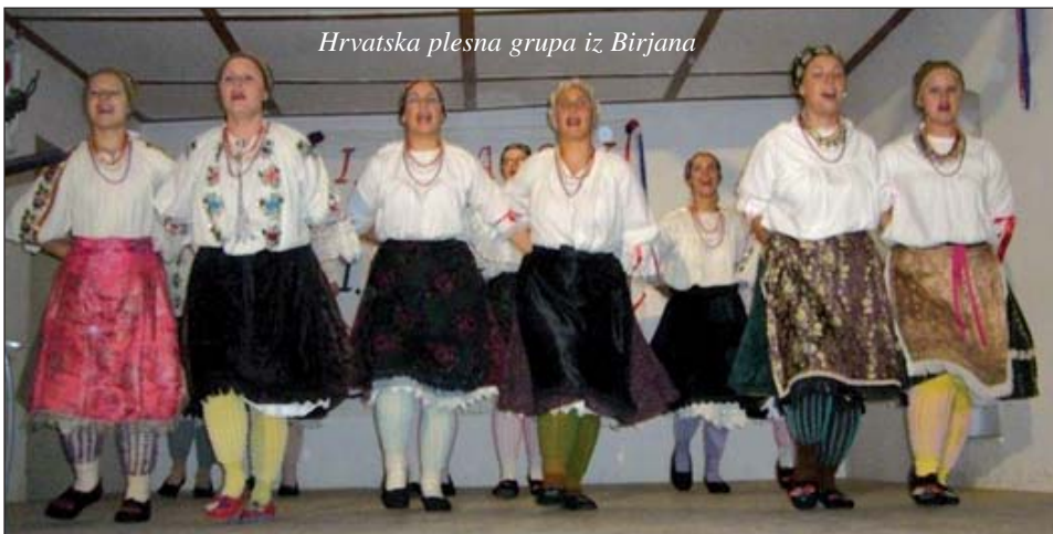
Hrvatska plesna grupa iz Birjana