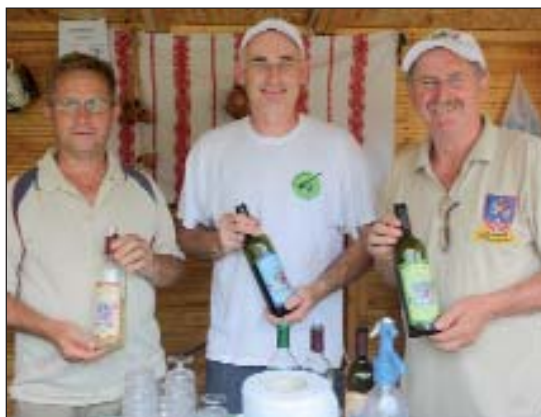
Uz gibanicu vino su nudili vinari Društva prijatelja vina iz Sumartona