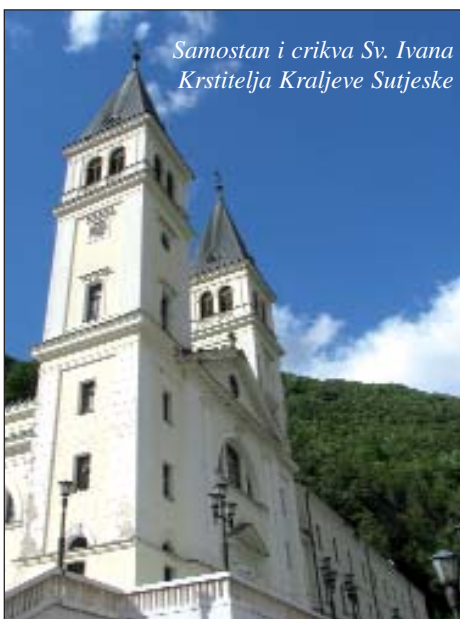
Samostan i crkva Sv. Ivana Krstitelja Kraljeve Sutjeske