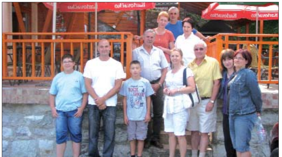
Koljnofska delegacija s gostodavatelji u panzionu Banja u Kreševu