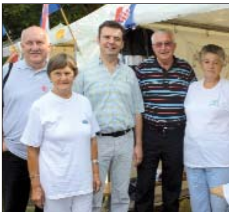
Družina iz Goričana dobila je priznanje za specijalnu gibanicu od heljde

Treći festival u slijedu šest festivala u kojem sudjeluju tri naselja iz Međimurja (Donji Vidovec, Donja Dubrava i Goričan) i tri iz našega Pomurja (Serdahel, Sumarton i Kerestur) započeo je već u petak, 5. kolovoza. Otvorenjem Folklornoga festivala kre Mure. Serdahelski načelnik Stjepan Tišler pozdravio je sudionike i goste s obje strane granice, naglasio kako priredbu u velikom dijelu financira IPA program Europske Unije, te ukratko predstavio projekt u čijim okvirima osim šest priređenih festivala bit će objavljene i male pjesmarice, odnosno predstavljaju se narodne nošnje i običaji, te dvd-materijali o sadržajima festivala.