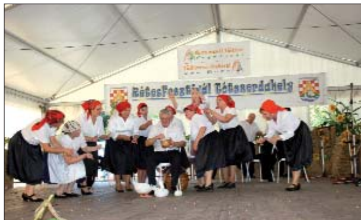
Pjevački zbor iz Serdahela u šaljevom igrokazu