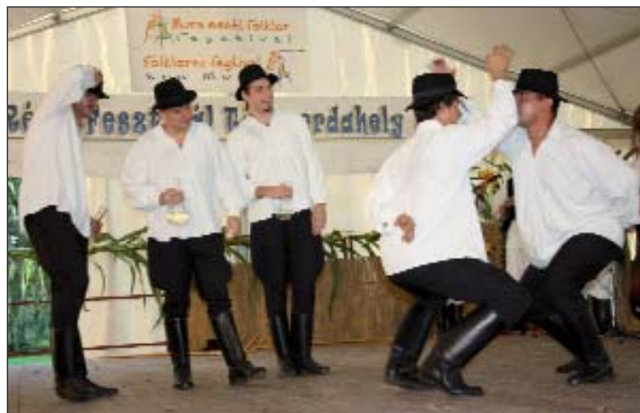
Plesači iz Donje Dubrave