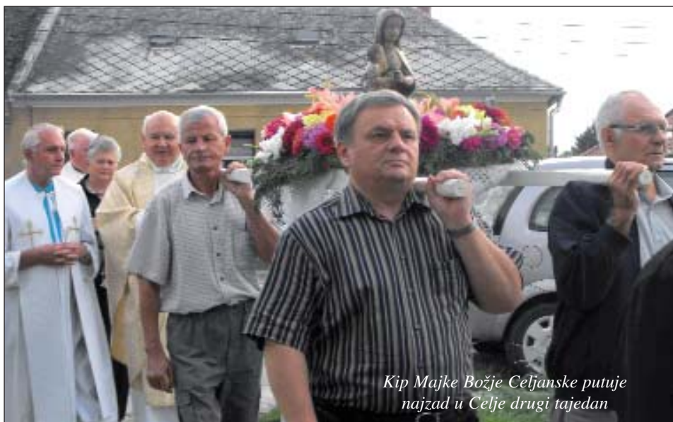
Kip Majke Božje Celjanske putuje najzad u Celje drugi tajedan

„Majka Božja Celjanska, moli se za nas!“