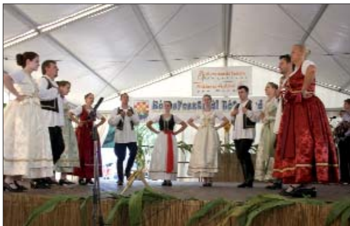
KUD Sumarton s novom koreografijom