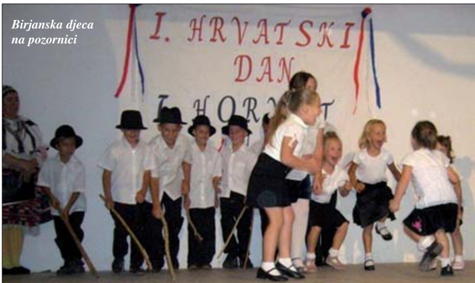
Birjanska djeca na pozornici

uzvanici, prijatelji i gosti. Nakon mađarske i hrvatske himne, te pozdravnih govora program su otvorili birjanski mališani s dječjim igrama. Nakon njih slijedili su i malo iskusniji, i to: Omladinska plesna grupa iz Gare s