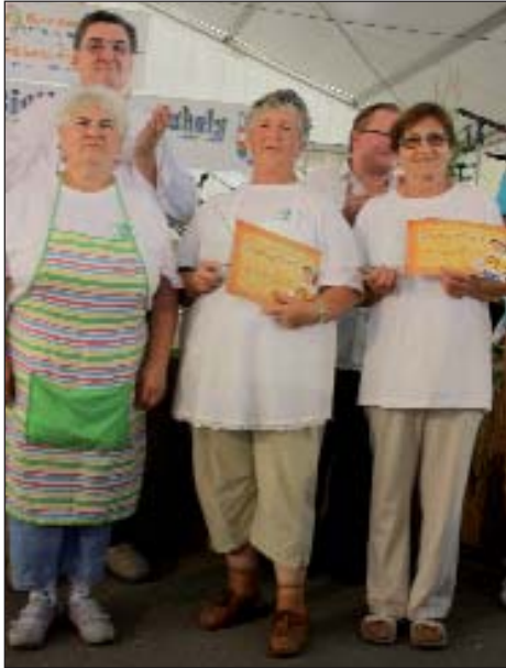
Umirovljenici su osvojili nagradu Najbolja serdahelska gibanica

Lani su bili nazvani Festivali „Puna zdel”, a ovaj put „Folklorni festivali kre Mure” koji su organizirani s lijeve i desne obale te rijeke u šest naselja u okviru IPA programa za prekograničnu suradnju Europske Unije. U slijedu festivala, nakon održavanja u Donjem Vidovcu i Donjoj Dubravi (Međimurje), 5. i 6. kolovoza stigao je red i na treći festival u Serdahel, gdje se uz tradicionalni gastronomski sadržaj pridružio i dvodnevni folklorni festival. Više od četiristo izvođača, domalo sto natjecatelja, golema količina tradicionalne slastice je očekivala pristigle goste iz raznih krajeva Mađarske i Hrvatske.