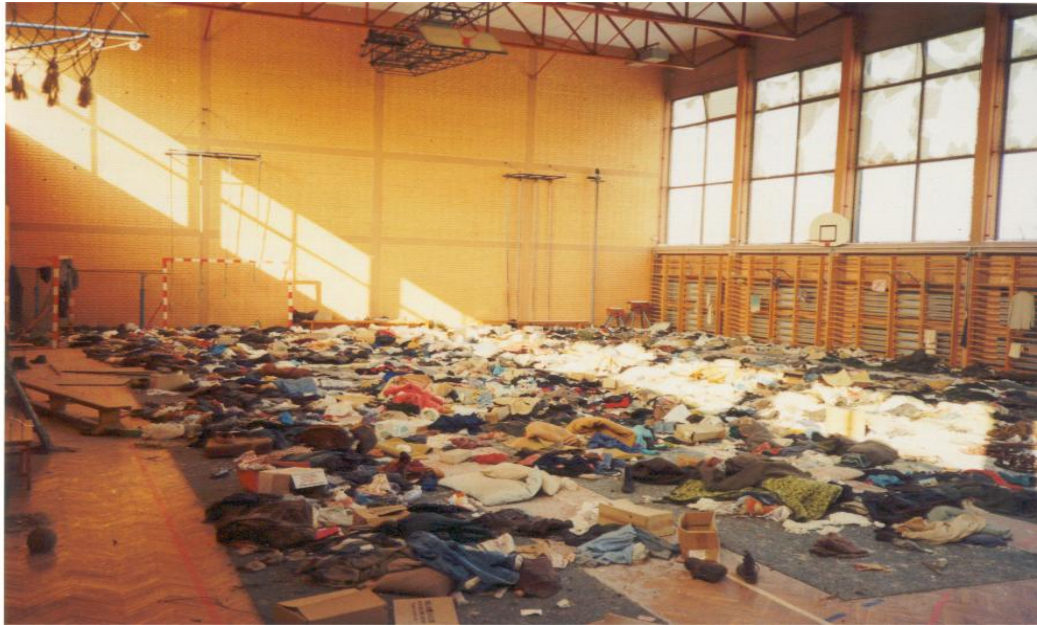
Средњошколски центар "Фриц Павлик" у Босанском Броду (спортска сала у којој су били заточени цивили српске националности 1992. године)