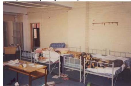
Просторија Средњошколског центра "Фриц Павлик"у Бос. Броду која је кориштена за сексуално иживљавање управи логора