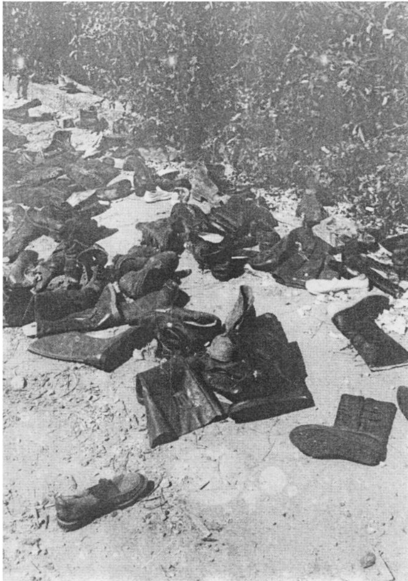
Дервента, 1992.: Мјесто заточења српских цивила.