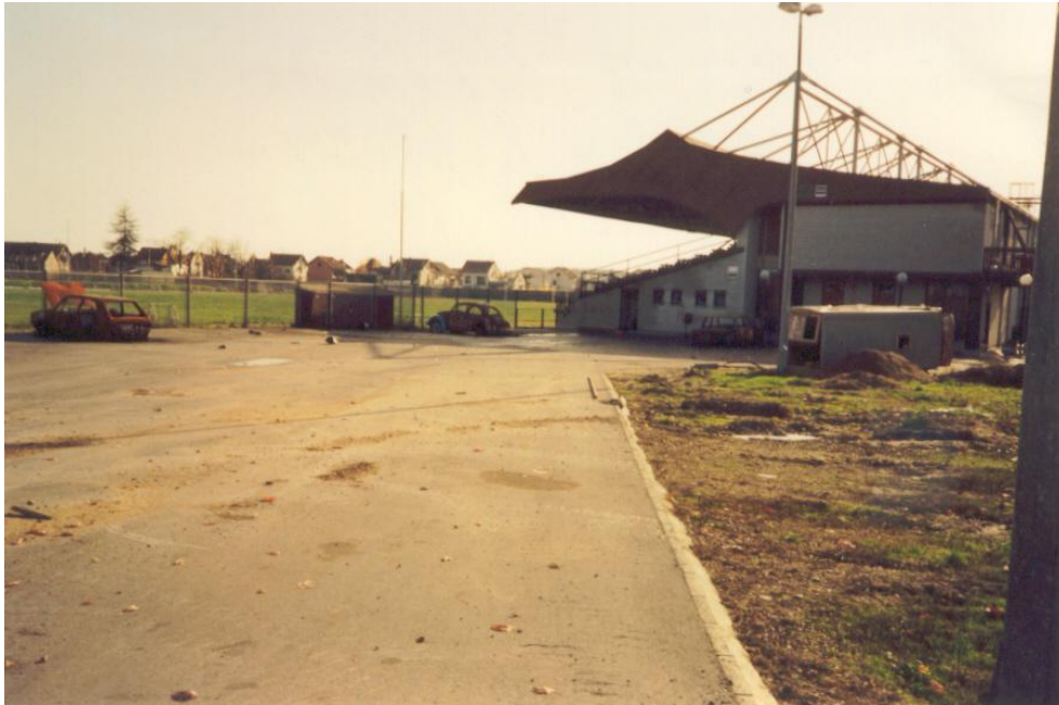
Стадион ФК "Полет"Бос. Брод претворен у логор