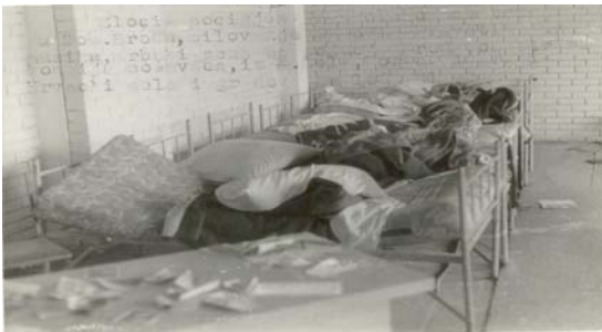
Просторија у логору у којој су сексуално злостављане заточене жене