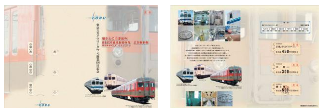
△記念乗車券台紙(イメージ)