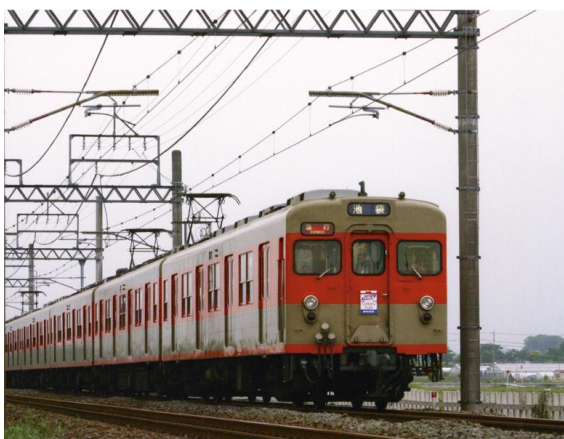
△8000系リバイバルカラー車両（イメージ）