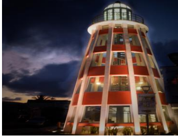
Faro del Saber