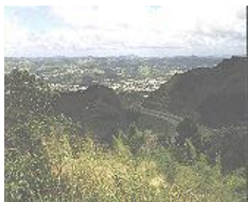
Vista a la Autopista PR 52