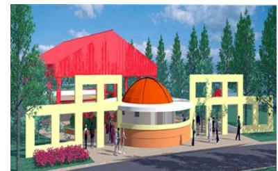
Escuela de Baloncesto