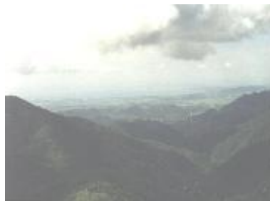
Vista al Mar