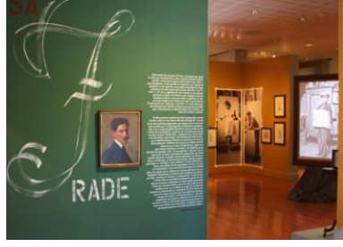
Museo U.P.R. Cayey