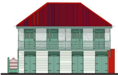
Casa Espada Cervoni (Diseño Restauración)