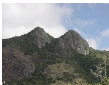
Tetas de Cayey