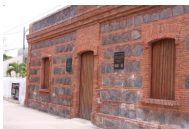
Centro Cultural Miguel Meléndez Muñoz (Antigua Casilla del Peón Caminero)