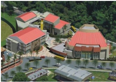
Conceptual Escuela de Bellas Artes