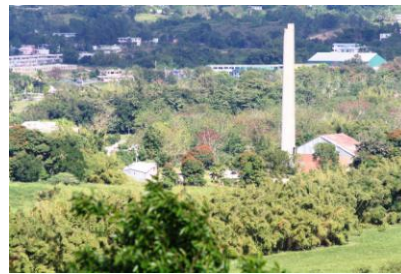
Antigua Central Las Vegas