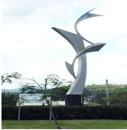
Monumento al Veterano

La historia de Cayey está llena de gestas militares. En un pasado teníamos aquí el Campamento Henry Barracks; recibiendo continuamente soldados valerosos de otros países e invitando a la juventud cayeyana a unirse en la lucha por la democracia y la libertad.