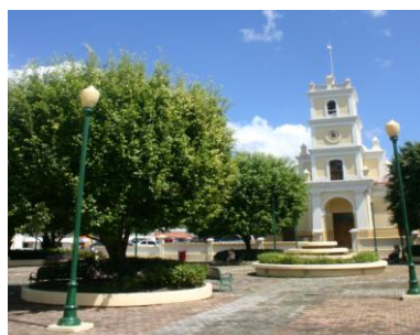
Parroquia Nuestra Señora de La Asunción