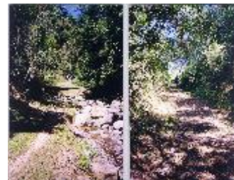
Florecidas Árbol del Roble