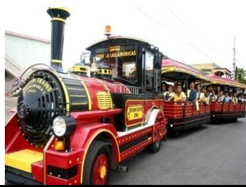
Trencito de las Américas