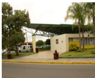
Terminal Mercedes Ortiz