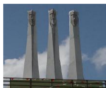
Monumento Tres Reyes Magos