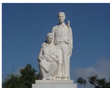
Monumento al Jibaro