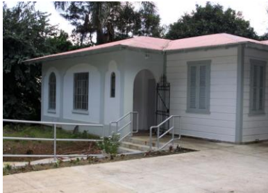
Restauración Casa de Campo Ex-Gobernador Luis Muñoz Marín