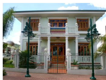
Salón de la Fama del Deporte Cayeyano