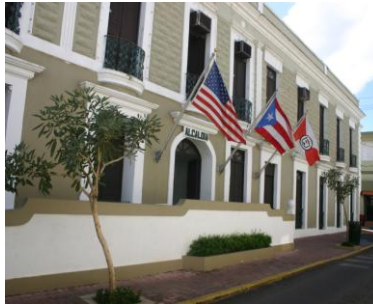
Casa Alcaldía (Antiguo Hotel Imperial)