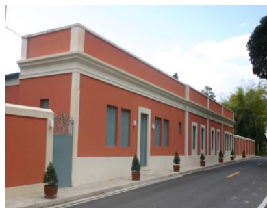
Casilla del Gobernador Jájome Alto, Cayey