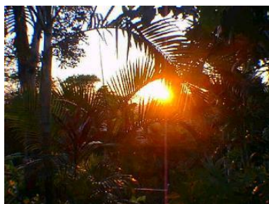
Amanecer en Cayey