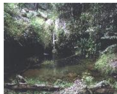
Charca Camino Helechales