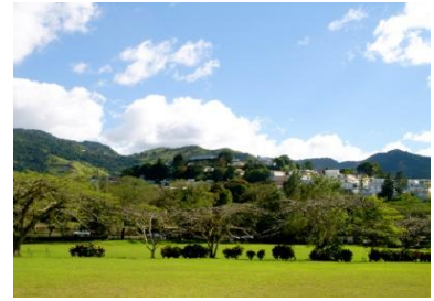
Campus U.P.R. Cayey