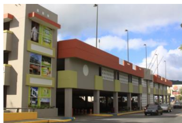
Terminal de Carros Públicos