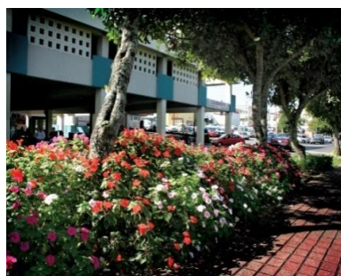
Jardines de la Ciudad