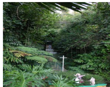
Gruta Virgen de Lourdes