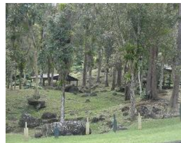
Bosque de Carite en Guavate