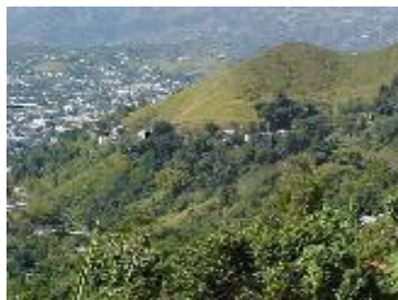
Vista a Cayey