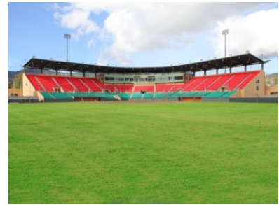
Estadio Municipal Pedro Montañez