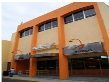
Centro de Innovación Tecnológica