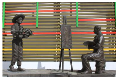
Frade pinta "El Pan Nuestro"