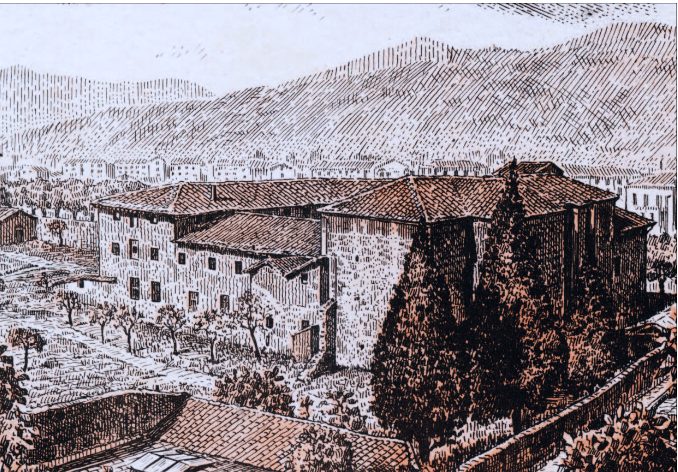
Santa Klara komentua, 1666an sortua