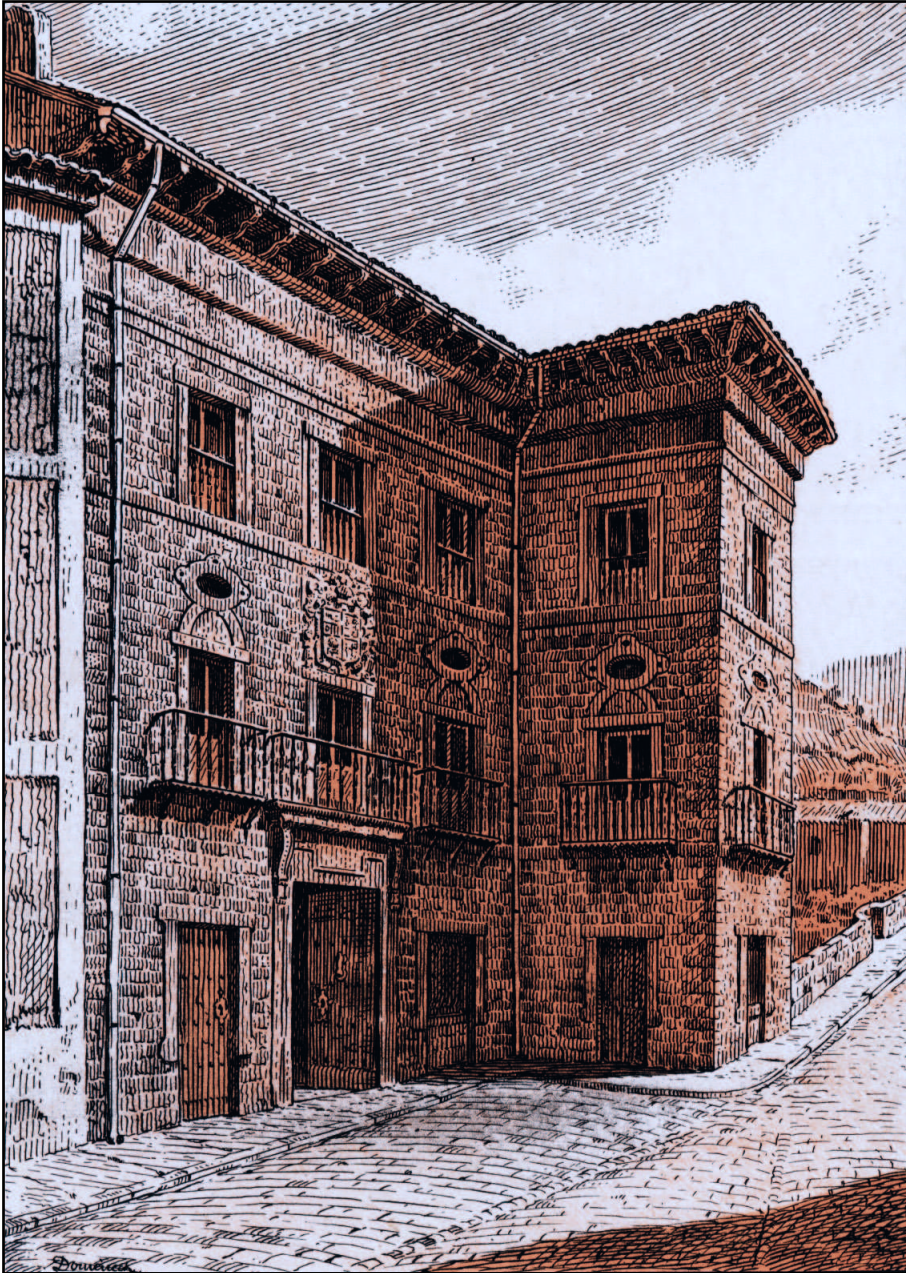
Idiakez Jauregia. Gaur egun Tolosako kasinoa