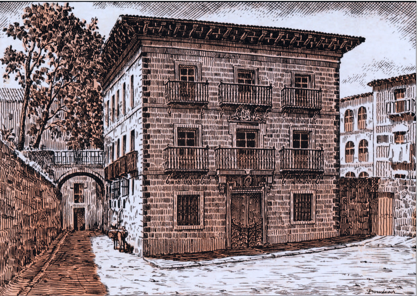
Aranburutarren oinetxea (Gaur egun Zabala jauregia)