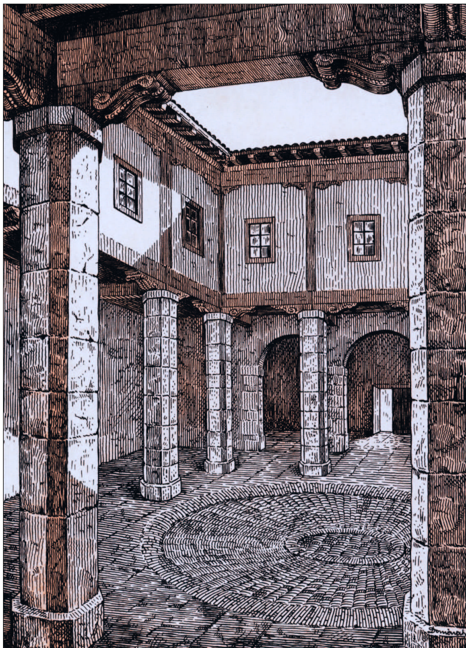
Errege Armategi zaharreko patioa (erregearen arma fabrika), 1630ean sortua