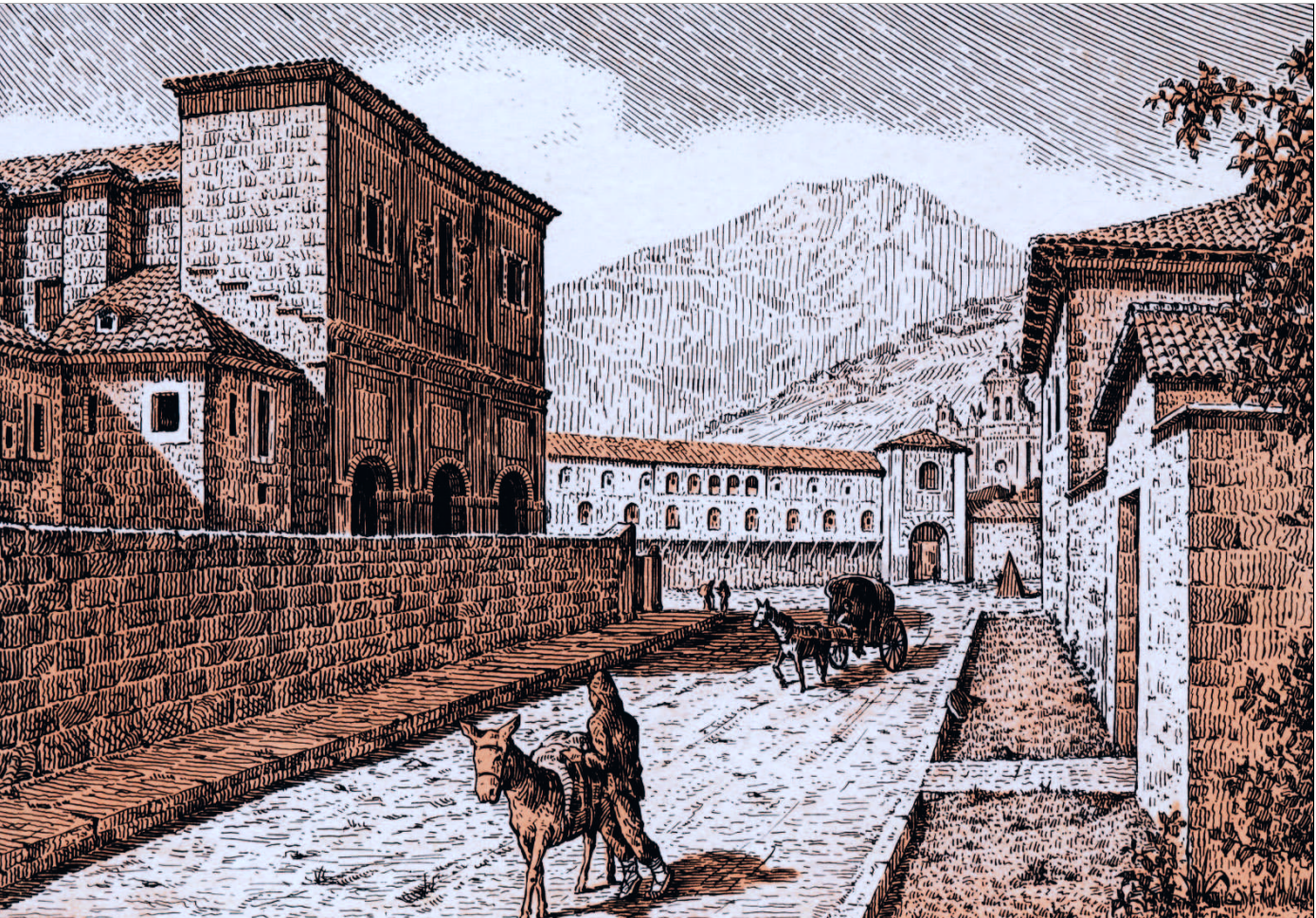
Aspaldiko San Frantzisko kalea,, Frantziskotarren komentua eta Laskorain dorrekoa