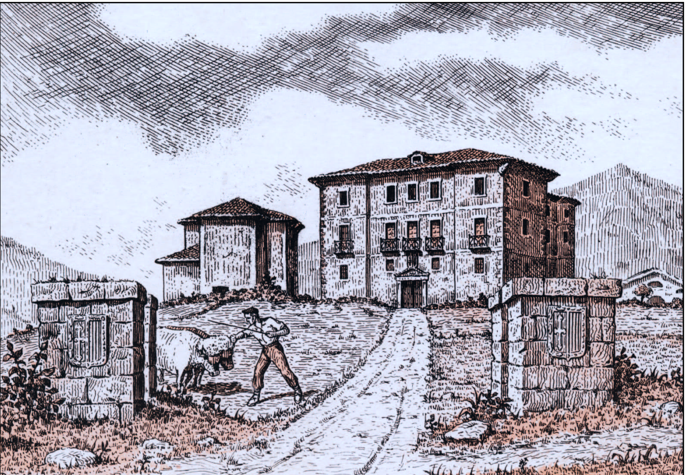
Jurramendi jauregia eta S. Migel eliza. (Gaur egun Miserikordia eta eretxea).