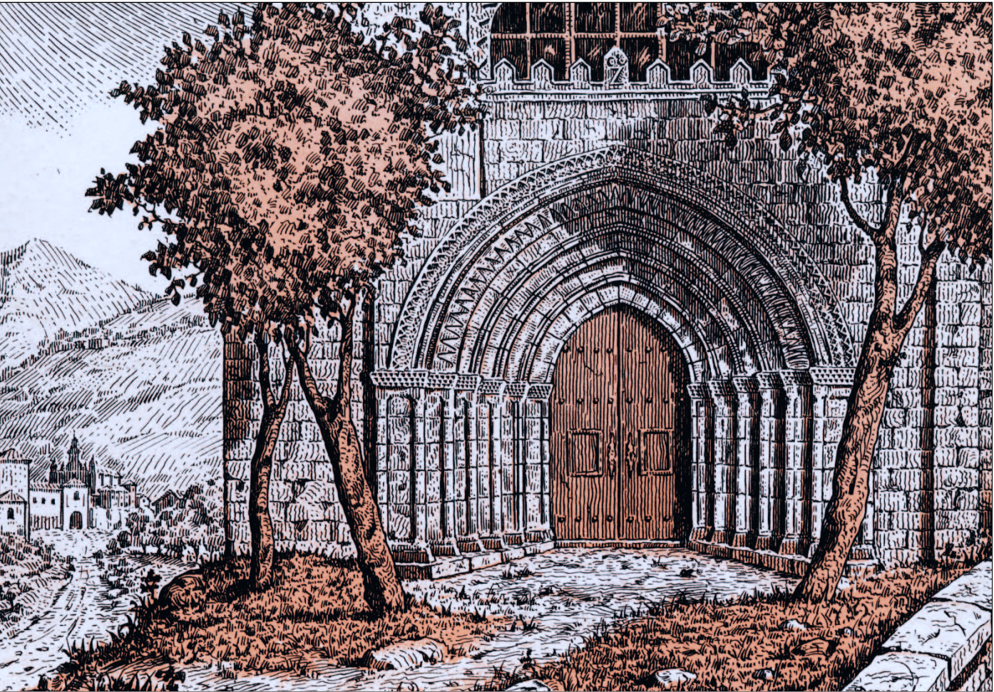
San Estebango portada erromanikoa. XIII. mendekoa (Gaur egun Santa Maria parrokiako bataiategian dago)