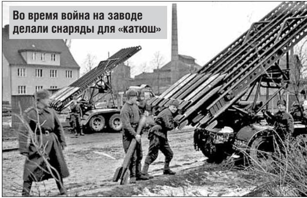
Во время войны на заводе делали снаряды для «катюш»

ные пластины. Но получалось это не всегда. Часть найденных после войны болванок установили на мемориальном комплексе на территории завода.