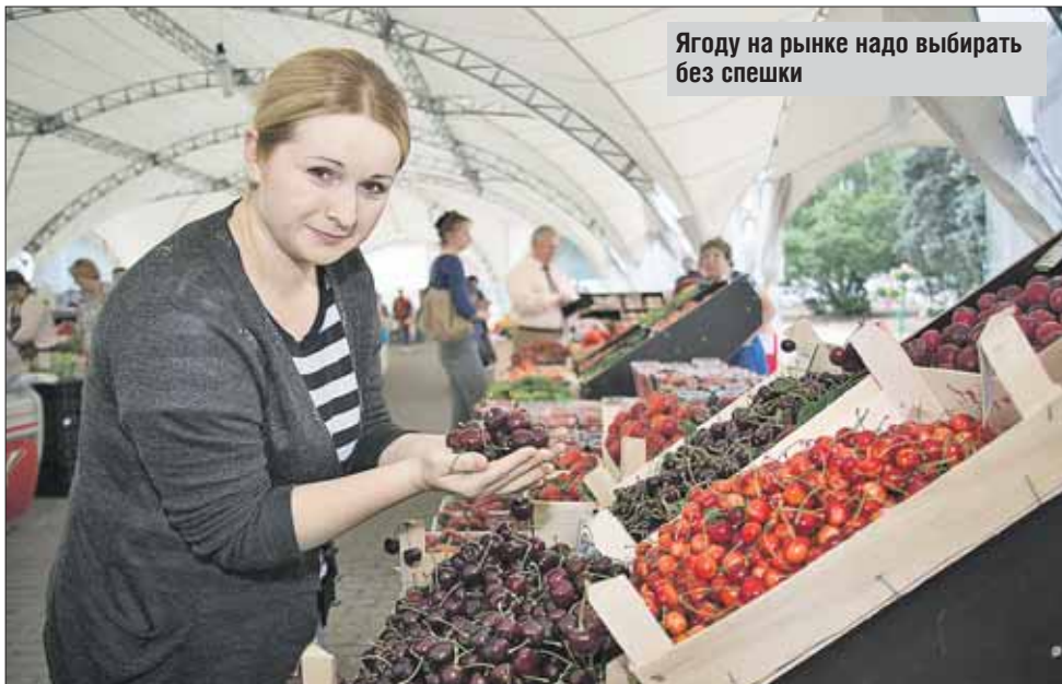
Ягоду на рынке надо выбирать без спешки

Для сравнения пробую ягоды с Кубани и из Крыма. Отдаю предпочтение крымской. Килограмм выторговываю за 130 рублей: вечерний базар! Ещё пробую клубнику у седовласой старушки. Подобно ей, на Преображенском рынке за прилавками трудятся с десяток пенсионеров-частников. Она гарантирует, что ягода своя,