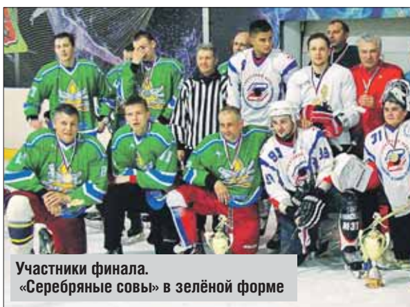
Участники финала. «Серебряные совы» в зелёной форме