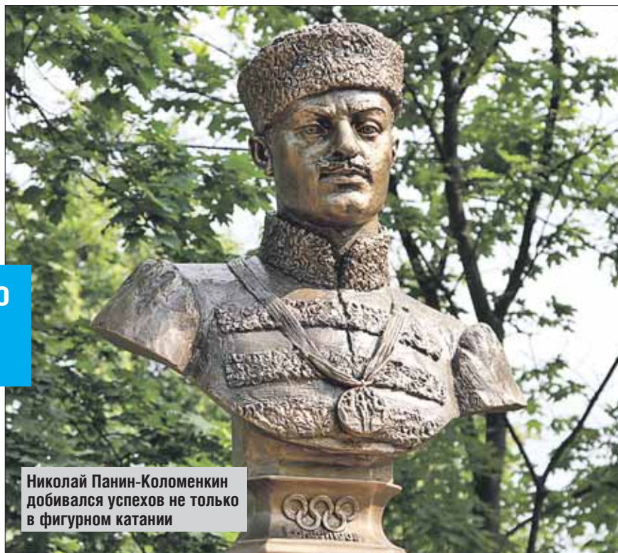
Николай Панин-Коломенкин добивался успехов не только в фигурном катании