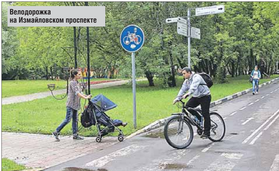
Велодорожка на Измайловском проспекте

Корреспондент «Восточного округа» выясняла, нужны ли в Измайловском парке велодорожки