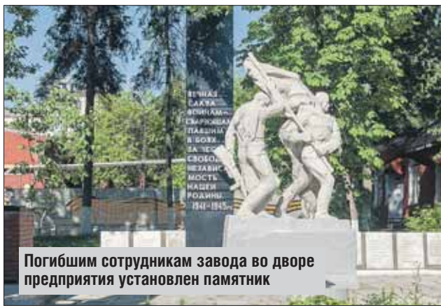
Погибшим сотрудникам завода во дворе предприятия установлен памятник

76-миллиметровые снаряды на СВАРЗ делали с первых дней войны. Литье заготовки поступали с другого завода, а местные умельцы придумали, как исправлять брак, прилагая к болванкам сталь-