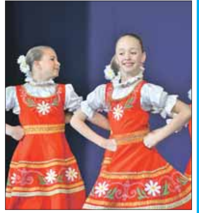
В центре «Юность» можно интересно и с пользой провести время