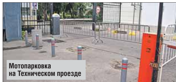
Мотопарковка на Техническом проезде

Раньше мотоциклистам приходилось оставлять своих железных коней на общих с автомобилями парковках. Теперь оставить мотоциклы можно на 3-м Лучевом проезде. Эта парковка рассчитана на 15 мотоциклов. Рядом находится пост охраны. Парковка будет удобна