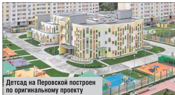
Детсад на Перовской построен по оригинальному проекту

В номинации «Лучший реализованный проект строительства объектов учебно-образовательного и учебно-воспитательного назначения» — детский сад на ул. Перовской, 66г, и школа на ул. Перовской, вл. 6б, корп. 10; в номинации «Луч-