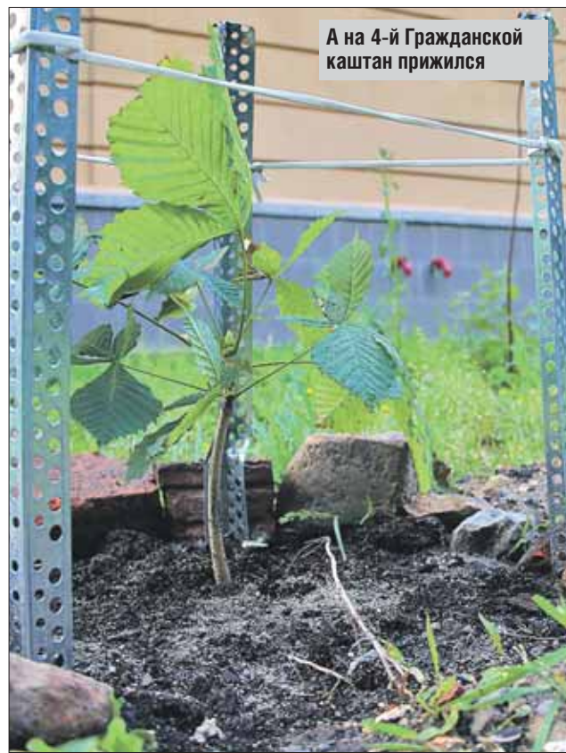
А на 4-й Гражданской каштан прижился

Собрание участников публичных слушаний: 21.07.2015 г. в