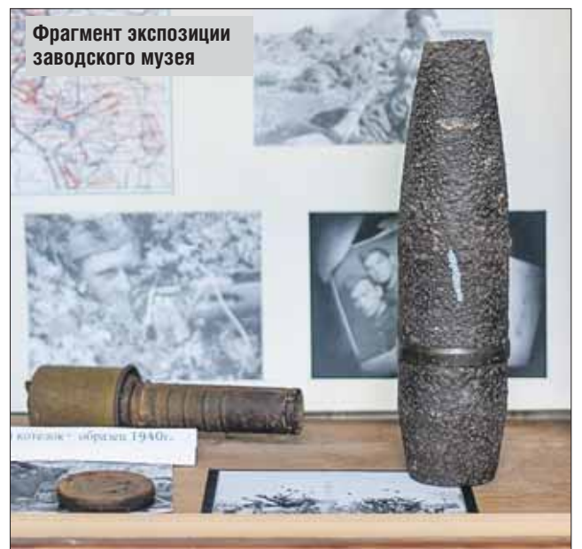
Фрагмент экспозиции заводского музея

Почти половина работников ушли на фронт, не