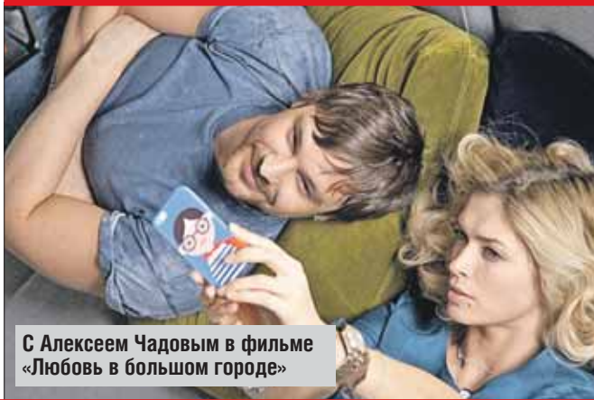
С Алексеем Чадовым в фильме «Любовь в большом городе»

Известная певица и актриса рассказала о своей миссии, о работе и о семье