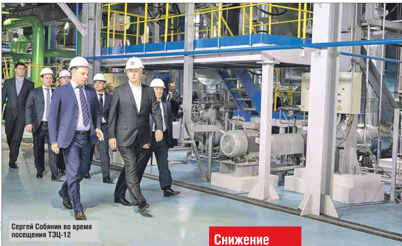
Сергей Собянин во время посещения ТЭЦ-12

По словам Сергея Собянина, жители Москвы уже в скором времени смогут ощутить положительные результаты от введения в строй нового энергетического объекта. Во-первых, благодаря снижению расхода топлива можно будет сдерживать повышение тарифов на коммунальные услуги. Во-вторых, парогазовый энергоблок обеспечит улучшение экологической обстановки в мегаполисе.