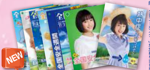
安全週間ミニポスターセット 8枚組 社名印刷不可 申込No.143 1,296円 B4判(364×257mm)