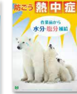
熱中症・シロクマ 申込No.156 216円 A2判 (緑十字ポスター)