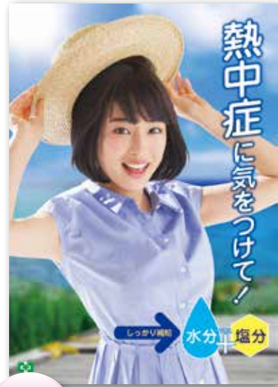
モデルは広瀬すずさん。

熱中症予防のために作業管理などの対策とともに、作業者への体調管理の呼びかけが大切です。