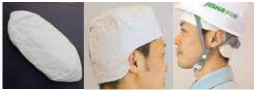
汗とりインナーキャップ 申込No.187 1,080円 フリーサイズ 素材：表・裏生地 綿100%(ガーゼ)・中綿 綿80%(脱脂綿)ポリプロピレン15%

ヘルメットの内側に 帽子の内側に 汗をとり快適 医療用純度の「脱脂綿」と「ガーゼ」でつくるパシーマだから、 pasima あっと驚く吸水性と吸湿性 糸の製造、織り、中綿の加工・染色・縫製仕上げまで国内工場で作成 ●後頭部が開くようになって自在に調整・洗濯後すぐに乾く速乾性 ●週1回以上洗濯してください。洗うほど風合いが良くなります。