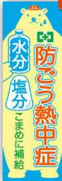
防ごう熱中症 申込No.186