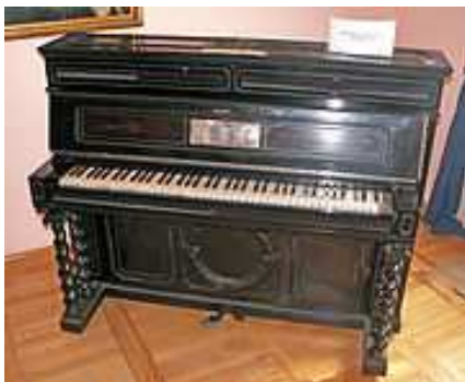
Piano de Chopin

Sin embargo su compañía marcará los últimos años de su vida. La escritora junto a sus hijos, habidos de un matrimonio anterior, acompañaron al músico a Valldemosa en la isla de Mallorca, a fin de que aliviara los trastornos de salud de su incipiente pero progresiva tuberculosis.