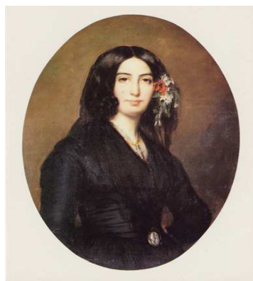
George Sand

Entre 1834 y 1835 reanudó sus giras visitando Renania, Checoslovaquia y Alemania, donde se relaciona con la familia del conde Wodzinsky pretendiendo en matrimonio a su hija María. La frágil salud del músico ocasionó el rechazo familiar a la solicitud. A su regreso a París en 1836, se produjo el encuentro con la que sería su mecenas y protectora, la escritora francesa George Sand (seudónimo de Aurore Dudevant), de personalidad avasallante que complementaba con vestimenta masculina. Al conocerla, Chopin exclamó: "Hoy he conocido a una gran celebridad, madame Dudevant, conocida como George Sand. Su apariencia no es agradable. De hecho hay algo en ella que indudablemente me repele. ¡Qué persona más falta de atractivo! ¿Es realmente una mujer? Me inclino a dudarlo..." (B. Gavoty “Chopin” Ed. Club Francés del Libro París 1974)