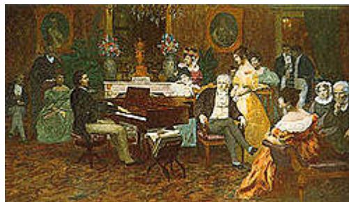
Velada musical de Chopin (1829) en la casa del Príncipe Radziwil (Pintura de H. Siemiradzki)

En 1831 llegó a París, principal centro de la cultura europea, donde el movimiento romántico estaba en su auge. Allí cultivó la amistad con Liszt, Berlioz, Rossini, Bellini y Mendelssohn, tomó contacto con la literatura y las personalidades de Víctor Hugo y Balzac y el arte de Delacroix. Instalado en la “ciudad luz” impartió clases a estudiantes extranjeros de variada procedencia mientras deleitaba con sus conciertos a un público muy diverso. Luego de la epidemia de cólera que diezmó la ciudad en 1832 y que sumió al músico en períodos de melancolía y dificultades económicas, varios miembros de la aristocracia (familias Radziwill, Rothschild, Vaudemont entre otras) lo tomaron bajo su protección invitándole a impartir lecciones de piano y a ofrecer “veladas” musicales ante un público selecto que lo admiraba.