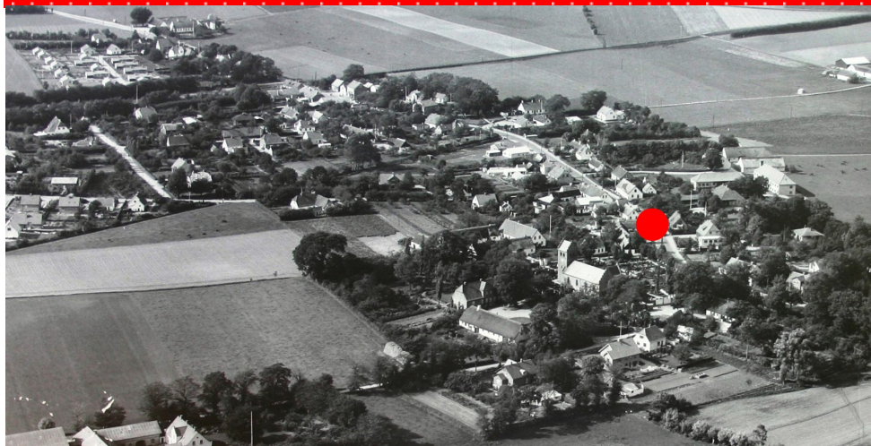
Luftfoto: Stenløse - Byvej, Stenløse, ca. 1958

Stenløse Kirke ses midt i billedet, over denne: Byvej, hvor Egedal Centret nu findes. I 1966 blev det besluttet at bygge et større indkøbscenter på baggrund af de mange ny tilflyttere. For at bygge centret blev Byvej lukket og en del ældre huse nedrevet for at give plads til centret.