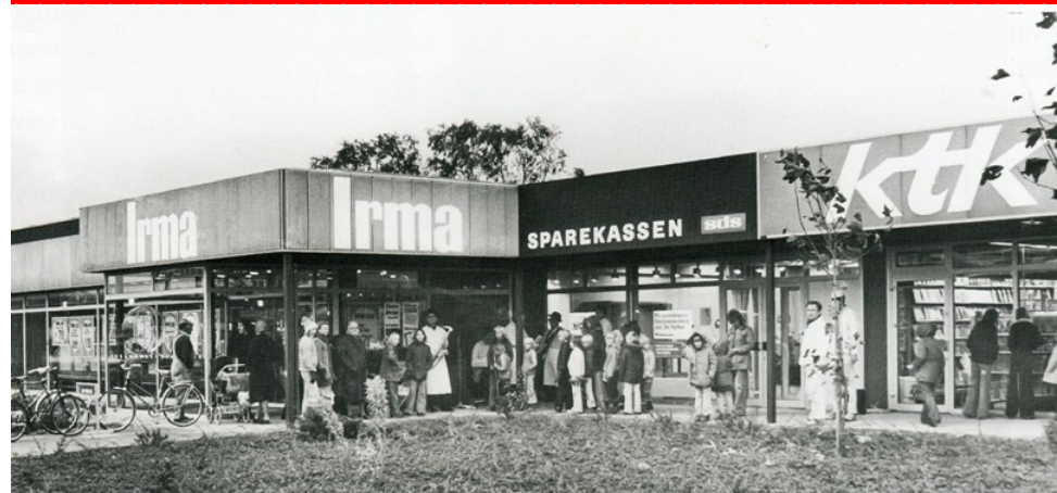
Smørum Butikscenter, ca. 1974.

Smørum Centret blev påbegyndt i slutningen af 1960'erne, hvor sognerådet i samarbejde med Irma planlagde et indkøbscenter, da der i dette område var et stort nybyggeri.