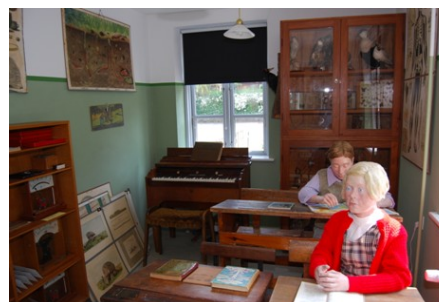
Skolestue i 50'erne

Arrangementet er for både børn og voksne, så tag børn og børnebørn med.