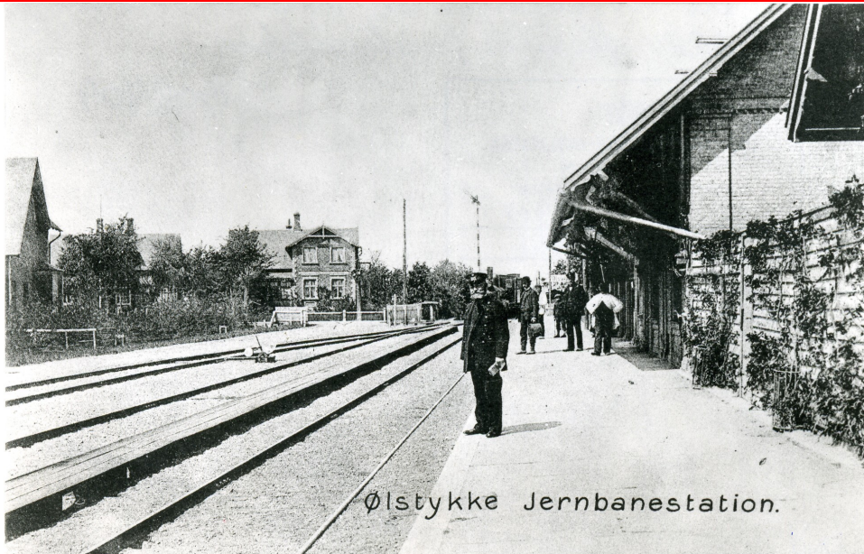
Ølstykke Station, 1908. Til højre ses den nu nedrevne stationsbygning (1999)

Jernbanen mellem København og Frederikssund blev anlagt i 1879. Muligheden for transport af varer og personer til/fra den voksende hovedstad var vigtig for udviklingen i Egedal. Ølstykke Stationsby opstod som en konsekvens af jernbanen, idet dette område ikke tidligere var bebygget.