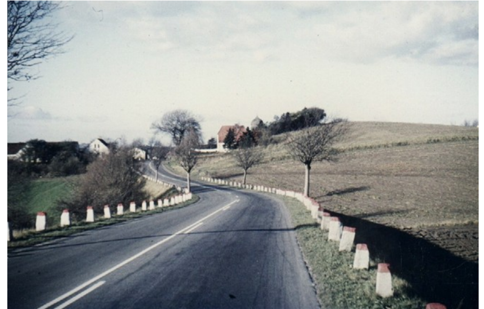
Frederikssundsvej mellem Veksø og Stenløse, ca. 1956.

Frederikssundsvej var en del af fingerplanen, der i 1947 fastlagde principperne for den fortsatte byudvikling i forstadsområdet omkring København. Frederikssundsfingeren var en af de fem fingre, hvor byen voksede med grønne kiler med rekreative områder imellem.