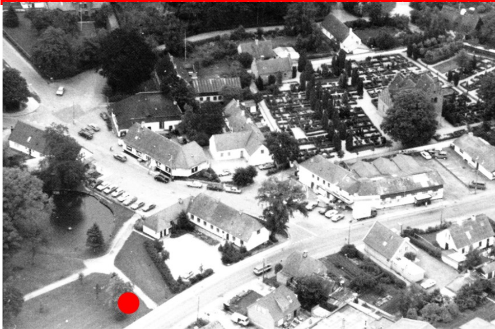
Luftfoto: Ganløse, Østergade og Bygade, ca. 1960

Ganløse landsby er et skoleeksempel på den type landsby, der kaldes fortelandsby. Strukturen peger måske helt tilbage til jernalderen for 2.000 år siden. Ganløse er et særlig velbevaret eksempel, hvor forten stadig er ubebygget.