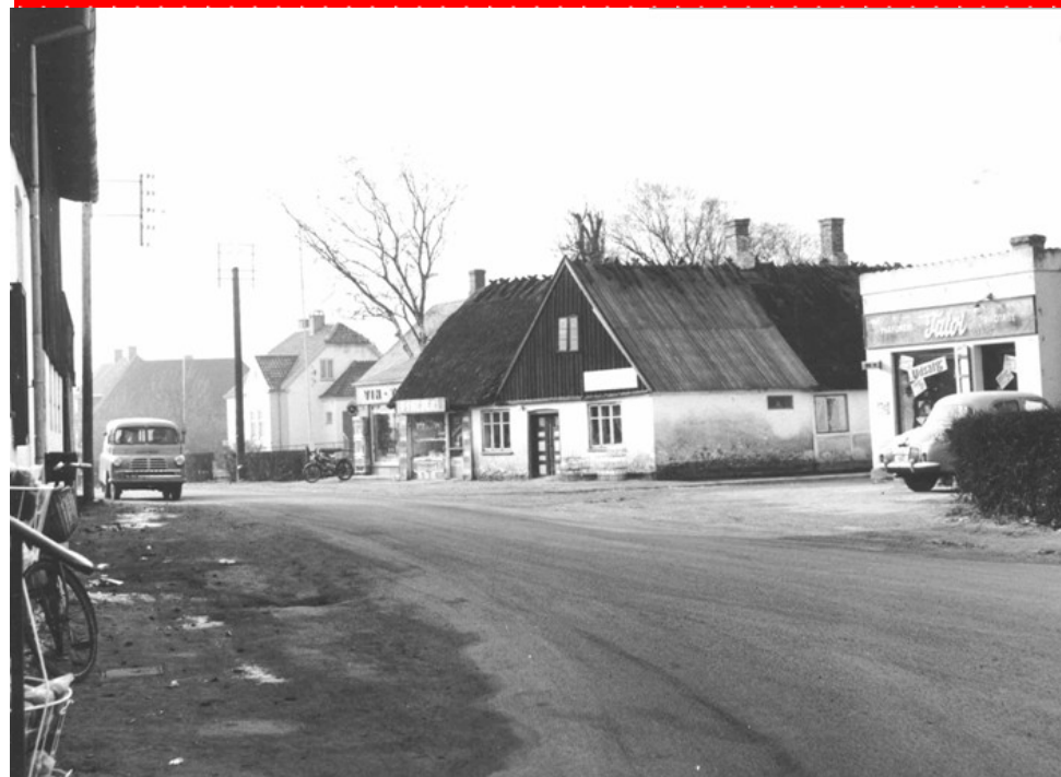
Bygade, Ganløse, set mod syd, 1964