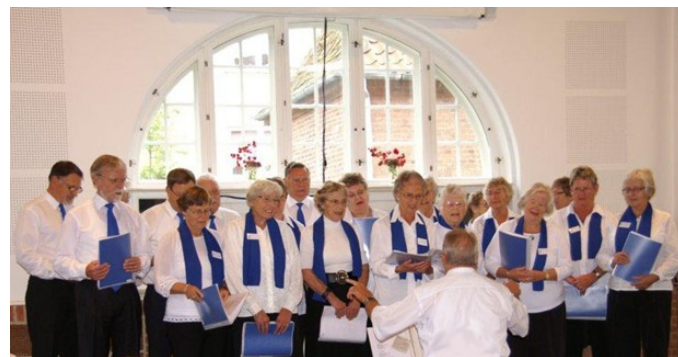
Det Tredje Krydderi

Sangkoret er et aktivt og kreativt pensionistkor, som består af ca. 32 medlemmer. Koret underholder ved koncerter fortrinsvis for andre pensionister.