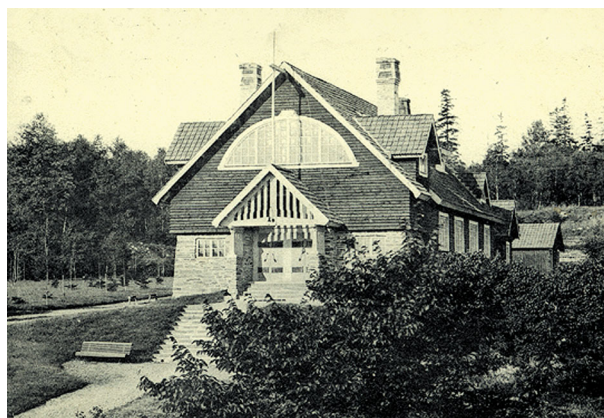
IOGT:s ordenshus i Åtvidaberg.

– allt är delar av det som brukar betraktas som den nationalromantiska trenden i det tidiga 1900-talets svenska arkitektur. Samtidigt som Westman arbetade med Läkarsällskapets hus fortsatte hans engagemang i Åtvidaberg. Ett av de märkligaste husen Westman nu ritade där var IOGT:s ordenshus – en byggnad som i sin blandning av engelsk Jugend och nordisk tradition kan föra tankarna till Karin och Carl Larssons ”Lilla Hyttnäs” i Sundborn.