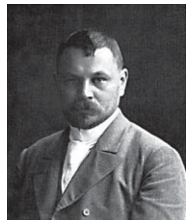
Carl Westman.