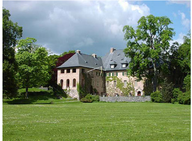
Adelsnäs herrgård.

Bland alla de byggnader som Clason och hans medarbetare stod bakom i Åtvidaberg under perioden från sekelskiftet fram till 1913 kan, förutom olika bostadshus för arbetare och andra personer knutna till godset och gruvdriften, nämnas Johanneskyrkan och folkskolebyggnaden vid Slefringevägen. Det största av Theodor Adelswärds och Clasons gemensamma projekt var dock den nya huvudbyggnad till herrgården som Adelswärd började planera sedan han 1901 tillträtt fideikomisset. När Clason tre år senare grep sig an Adelsnäs var han ingalunda utan erfarenhet av slotts- och herrgårdsbyggen. På 1890-talet hade han byggt om Kronovalls slott på Österlen och tillsammans med Lars Israel Wahlman nybyggt Hjularöds slott, också det i Skåne. Under tiden som han arbetade med Adelsnäs hann han också med att bygga om Hanebergs herrgård i Sörmland och att rita den herrgårdsliknande villan Lönö i Östergötland. Adelsnäs är den sista riktigt stora slottsbygget som genomförts i Sverige. Det uppfördes 1915-21 i den ”kärva” svenska stil som Clason nu förespråkade. Slående är hur skickligt Clason har utnyttjat terrängens nivåskillnader för att skapa eleganta övergångar mellan park och hus. Adelsnäs bär vittnesbörd om såväl Clasons ”tekniska” briljans som hans känsla för estetik.