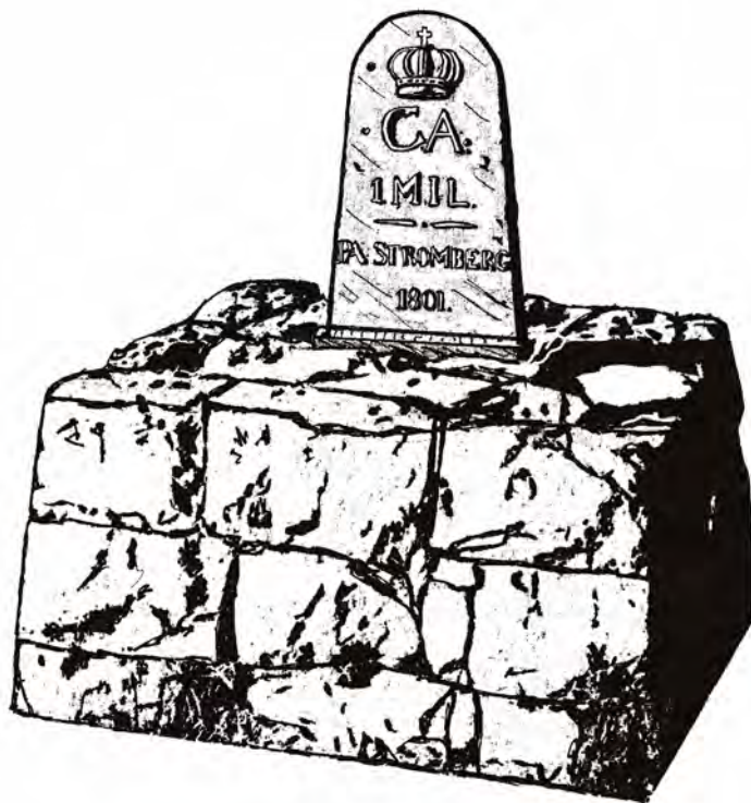
Milstenen i Röbbäck

Fram till mitten av 1800-talet behövde resande ha inrikespass , som inte var så lätt att få för den som inte hade försörjningen ordnad.