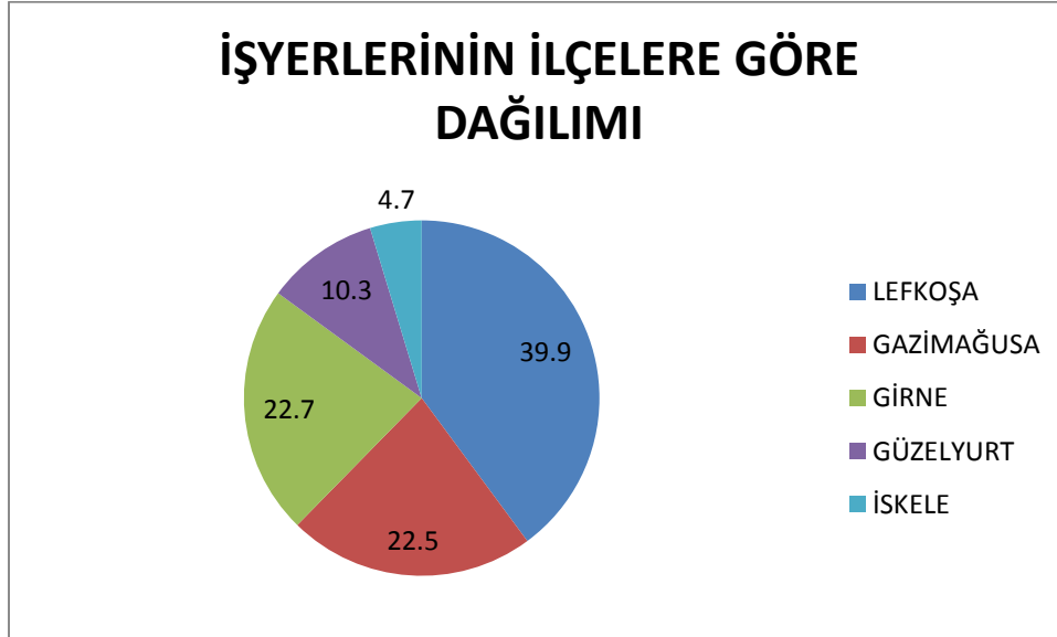
Grafik 1: İlçelere Göre İşyerlerinin % dağılımı

İşyerlerinin % 39,9'u, çalışanların ise % 49,5'i Lefkoşa'dadır. Bunu % 22,7 işyeri ve % 22,8 çalışan ile Girne ilçesi takip etmektedir.