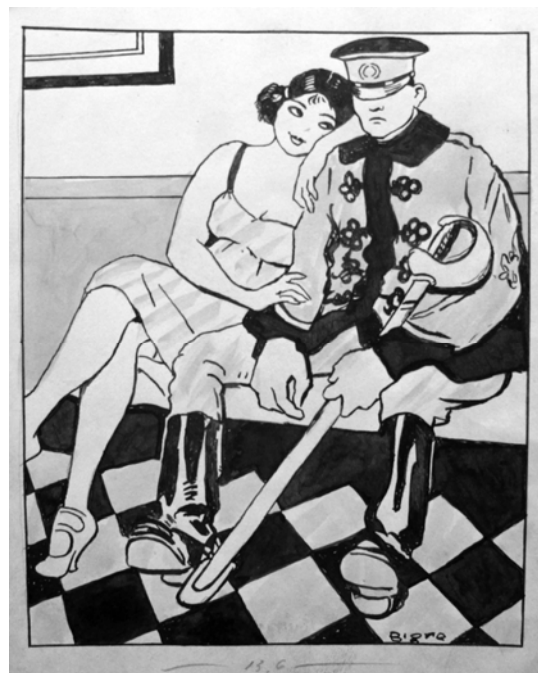
Ricard Opisso "Bigre" "Anda chico decídete..." 19 x 15,5 cm Tinta y aguada azul sobre papel

Revista erótico sicalíptica creada en Barcelona a la vez que La Traca y el Papitu . Daban prioridad a esta temática. Era un modelo de revista que no entraba oficialmente en la mayoría de los hogares decentes pero todo el mundo leía. Se movía en un terreno impreciso y difuso. Colaboraban dibujantes como Ricard Opisso, quien firmaba "Bigre".