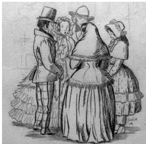
Lola Anglada “Els nostres avis” 24 x 17 cm Lápiz sobre papel

La prensa de principios del siglo XX era un instrumento para hacer política y el humor y la sátira de Cu-cut! animaron a la creación de nuevas revistas con un estilo similar basado en la sátira de carácter catalanista. Aparecieron La Tralla (1903-1907), La Barretina (1903), La Tralla del Carreter (1903-1904), Or i Grana (1906-1907) o Metralla (1907-1909). Otras publicaciones ya existentes se vieron obligadas a revisar la línea editorial como es el caso de La Campana de Gràcia (1870-1934) y L'Esquella de la Torratxa (1879-1938) que incorporaron nuevos dibujantes y un giro hacia el catalanismo. También influyeron en otras publicaciones como L'Hereu (1913-14), La Piula (1916), Cuca Fera (1917), L'Estevet (1921-23), El Borinot (1923-1927) o Papitu (1908-1936).