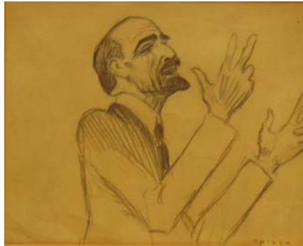
Ricard Opisso “Francesc Cambó” 17,5 x 20,5 cm Llapis sobre paper