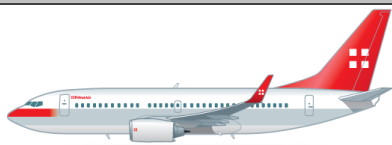
Boeing 737-700 (BBJ)