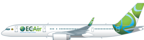
Boeing 757-200 im Einsatz für EC Air