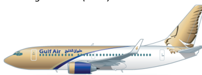
Boeing 737-700 (BBJ) im Einsatz für Gulf Air