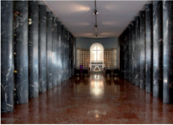
Veduta della navata