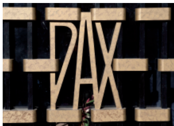
Dettaglio del portale d'ingresso in vetro con elementi bronzei

Il Sacrario architettonicamente riecheggia lo stile razionalista degli anni trenta con stilemi più tipici degli anni cinquanta.