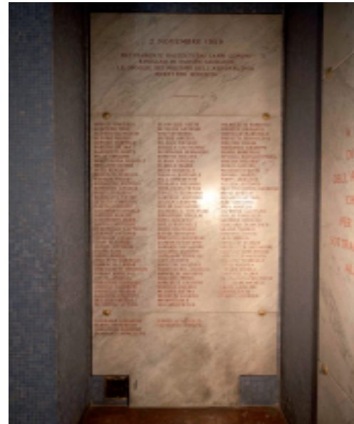
Lapide a chiusura dell'ossario comune

Ai lati maggiori sono disposti i loculi per le salme, ordinati in sei file, chiusi da lastre di travertino antico arrotato e non lucidato.