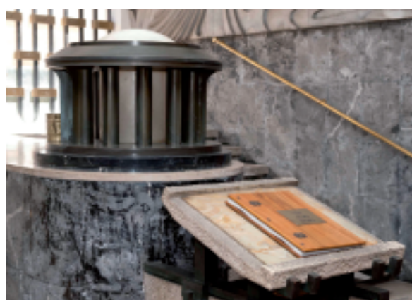
Lampada votiva e Albo d'Oro dei Caduti con ubicazione e circostanze delle morti

Il Sacrario è a pianta longitudinale a unica navata (cosiddetta "aula unica").