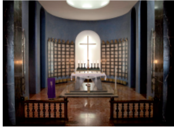
Veduta dell'abside e dell'altare Ai bracci minori sono visibili i loculi ossario

In assenza di luce naturale, la cripta è illuminata indirettamente con punti luminosi schermati dalle centine ricavate tra le file dei loculi; centine che ricordano le forme della fusoliera degli aeroplani. Le fonti luminose sono tenui a eccezione della luce cadente dal settore centrale.