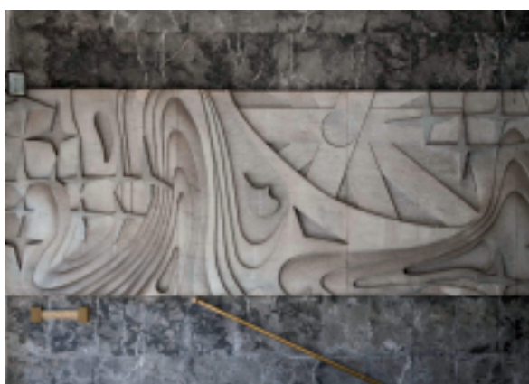
Pannello laterale sinistro in marmo con la stilizzazione del cielo con i corpi celesti e i vortici d'aria che richiamano al volo

È una struttura realizzata interamente in cemento armato, costruita con assoluto rigore e in modo estremamente funzionale, con linee dritte e squadrate che ne accentuano la monumentalità. Immediata è nel visitatore la percezione dell'aura di sacralità che la memoria e il ricordo del sacrificio impongono.