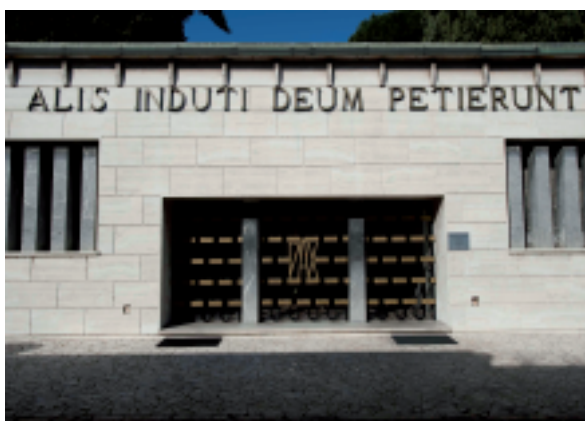
Veduta della facciata con il motto latino liberamente traducibile in "con le ali ascesero a Dio"