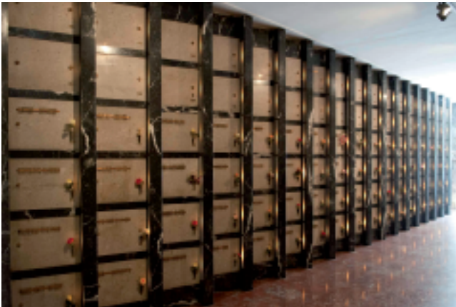
Veduta dei loculi

L'altare in pietra costituisce l'elemento decorativo predominante.