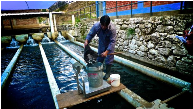
Aquacultivos del pacifico.

Las culturas más avanzadas son de vieiras y langostinos, que son principalmente para la exportación. Cultivo de la trucha está avanzando en los altos Andes para el mercado local y exportación. Otras especies nativas e introducidas se cultivan y comercializan en los mercados locales y regionales solamente.