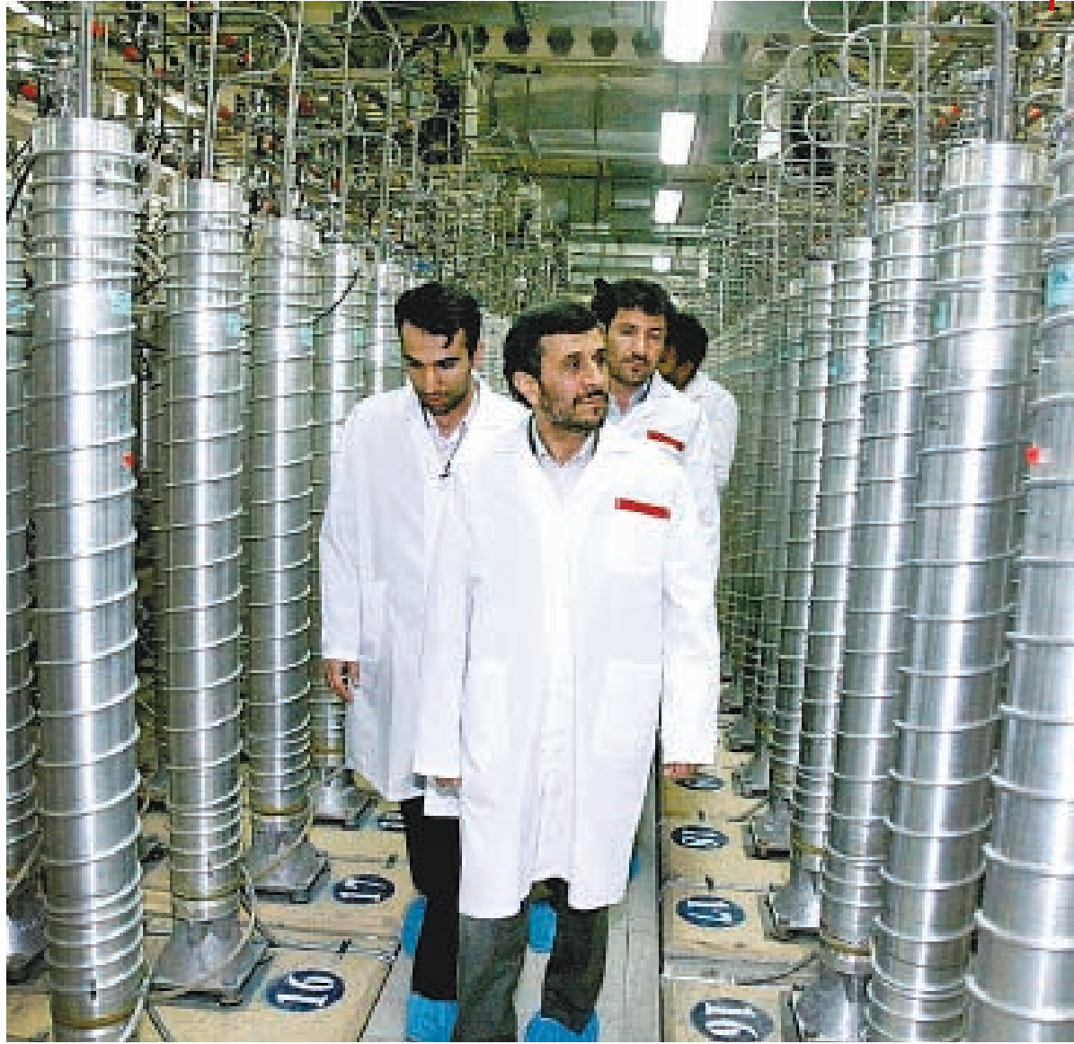
മഹ്മൂദ് അഹ്മദി നെജാദ് ഇറാനിലെ ഒരു ആണവറിയാക്ടറിൽ

ഇതേസമയം, ഇസ്രായേലിലെ മാദ്ധ്യമങ്ങൾ ഇറാനെതിരായി ആണ