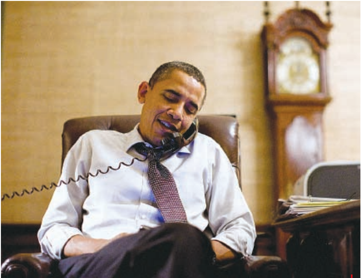
ഇറനെയറായ തന്ത്രങ്ങൾ വീജയിക്കുമോ?: ബറാക് ഒബാമ |

ധങ്ങൾ ഉപയോഗിച്ചുപോലും തകർക്കാൻ കഴിയുന്നവയാണീ നിലയങ്ങൾ.