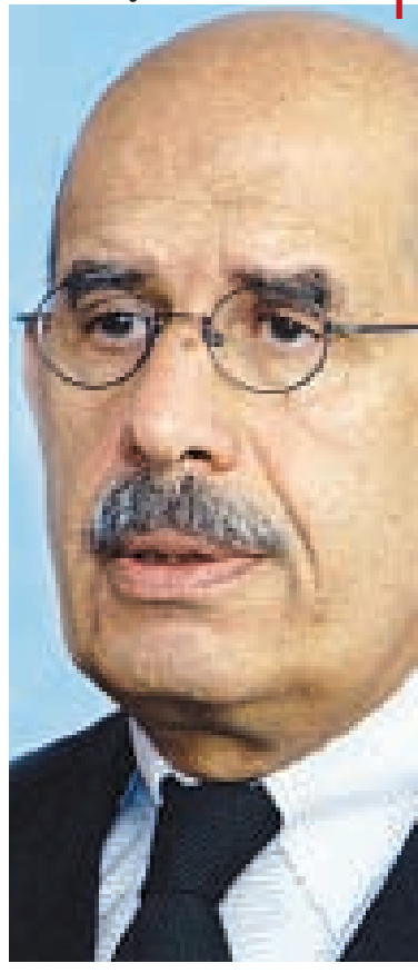
മുഹമ്മദ് അൽ ബറാദി

വയും ഏറ്റവും മികച്ച സാങ്കേതികവിദ്യകൾ ഉപയോഗപ്പെടുത്തുന്നുണ്ട്. നൂറുശതമാനം സമ്പുഷ്ട യൂറേനിയം നിർമ്മിക്കാൻ കഴിവുള്ള ലേസർ എൻറിച്ച്മെന്റ് കേന്ദ്രങ്ങൾ ഈ രാഷ്ട്രങ്ങൾ ഉപയോഗപ്പെടുത്തുന്നു. എന്നിട്ടും ഈ രാജ്യങ്ങളൊന്നും അമേരിക്കയുടെ ക്രോധത്തിന് പാത്രമാകുന്നില്ല എന്നുള്ളിടത്താണ് അങ്കിൾ സാമിന്റെ മധ്യ-പൂർവ്വമേഖലകളിലെ രാഷ്ട്രീയലക്ഷ്യം വെളിപ്പെടുന്നത്.